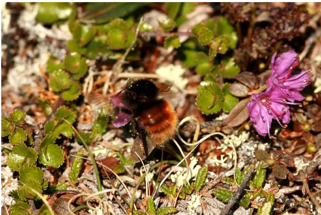
Alphumla Borrasiatjåkka 2010-07-02