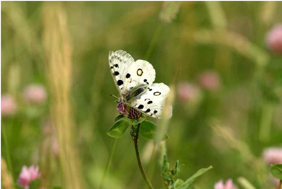
Apollofjäril Loftahammar 2010-07-10

Nästa anhalt blev Kallvik belägen intill Loftahammar. När jag var på en lämplig lokal för apollofjäril 2008, var det en snabb affär att hitta arten igen. Jag fann tre apollofjärilar, en hagtornsfjäril och några gräsfjärilar. Jag var klar här klockan 15:30.