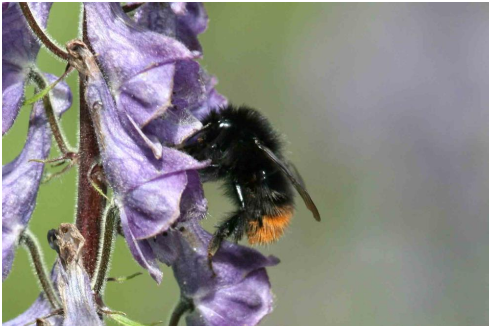
Tjuvhumla Vivallen 2010-07-29

Jag for därefter upp till Vivallen (6944656, 1327195). Vädret var småfuktigt men i stormhattarna fanns gott om tjuvhumlor.