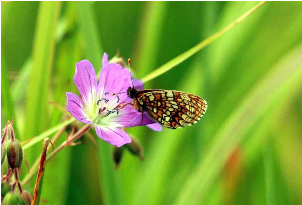
Veronikanätfjäril Fagersta 2010-06-25

Då även lokalen för veronikanätfjäril utanför Falköping låg längs vägen mot Norrland gjorde vi gemensamt ett sök här. Som följd av att solen inte sken då vi anlände fann vi istället veronikanätfjäril sittande helt öppet i nästan meterhög vegetation.