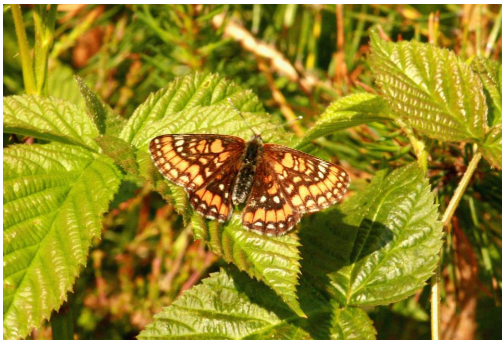
Asknätfjäril Munkhyttan 2010-06-25