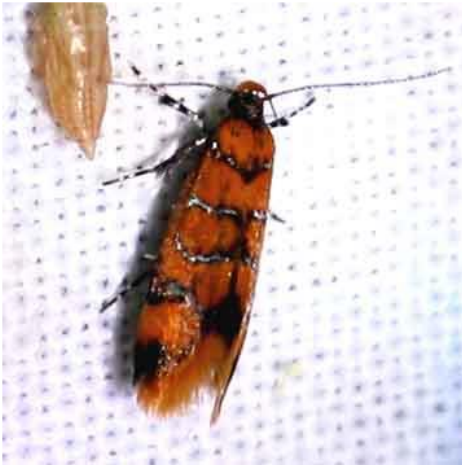
Hieroglyphpraktmal Sandby 2010-07-10 kl 00: 53