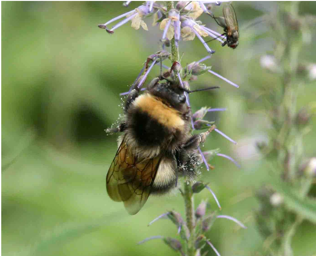
Rallarjordhumla Kukkolaforsen 2010-07-26