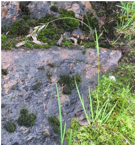
Venhavre Bergfors 2010-07-22

Vi anlände till Bergfors (7567318, 1664978) i hällregn, avvaktade det mest intensiva nedfallet men gav oss ut så snart regnet var något mindre intensivt. Mållart här var venhavre Trisetum subalpestre vilken jag såg här i juli 1986. Vi sökte på den plats jag sett stråna 1986 och vi sökte på de platser arten rapporterats till Artportalen 2008, samtliga belägna på norra sidan utan att finna något exemplar. Jag fann så småningom ett enda strå av arten på jockens södra sida. Då sällskapet församlat tog sig genom vegetationen till växtplatsen råkade förste man trampa på en gnagare, vilket upptäcktes av andre man, Djuret lyftes upp och studerades. Inledningsvis misstänktes mellansork. Detta visade sig omsider vara felaktigt. Djuret var en gråsidning.