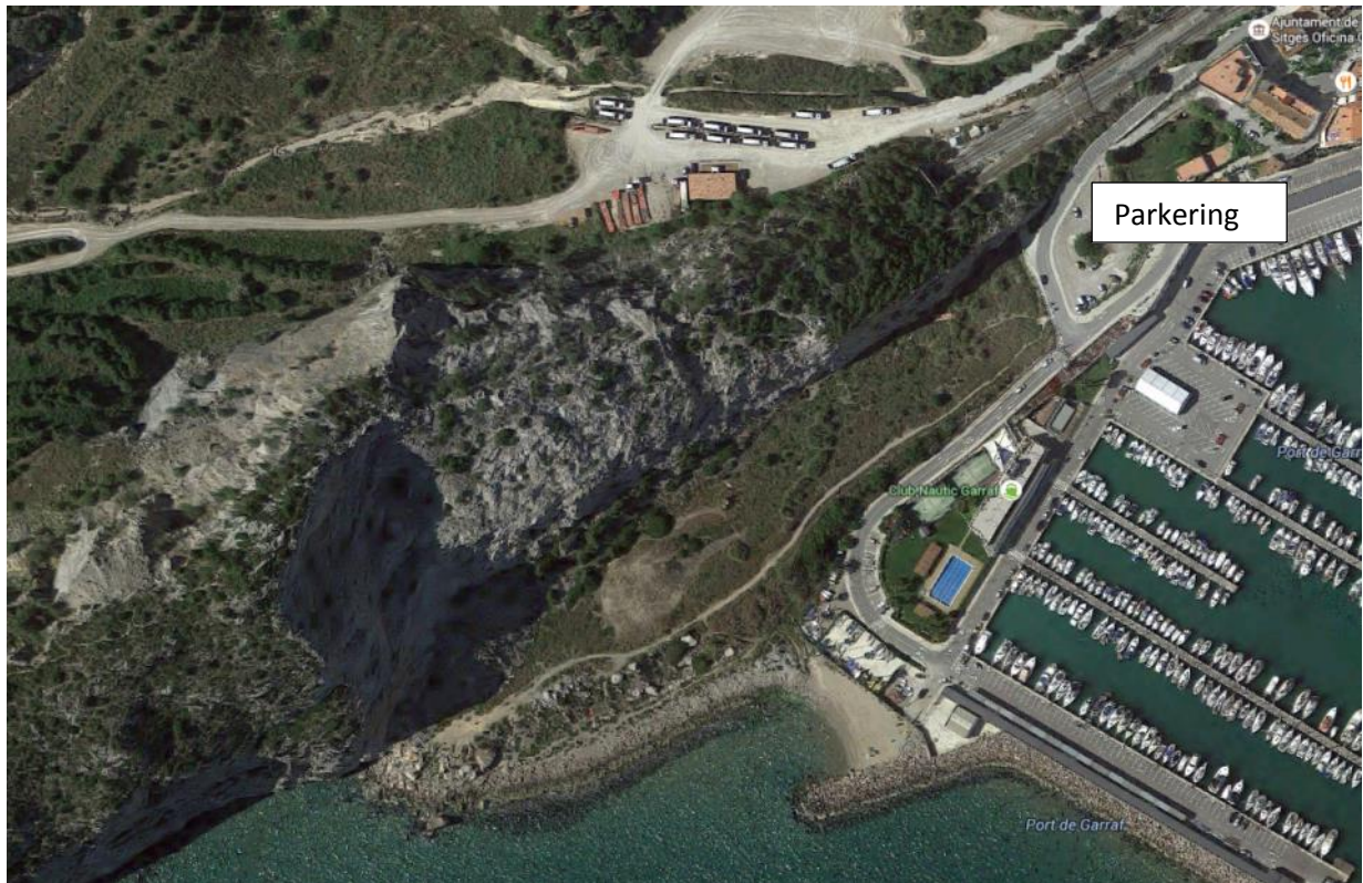
Småbåtshamnen i Garraf (Sitges). Följ stigen som går till vänster i bild.