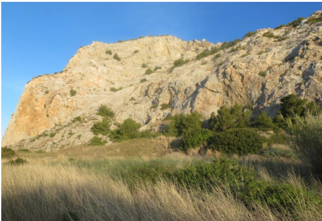
Klippan nära småbåtshamnen i Garraf.