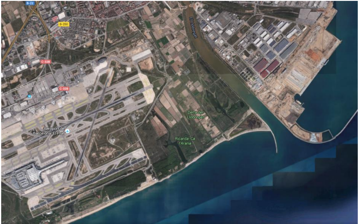
Karta över området.