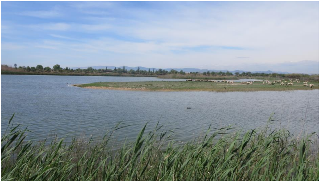
Vy från ett av gömslena i deltat.