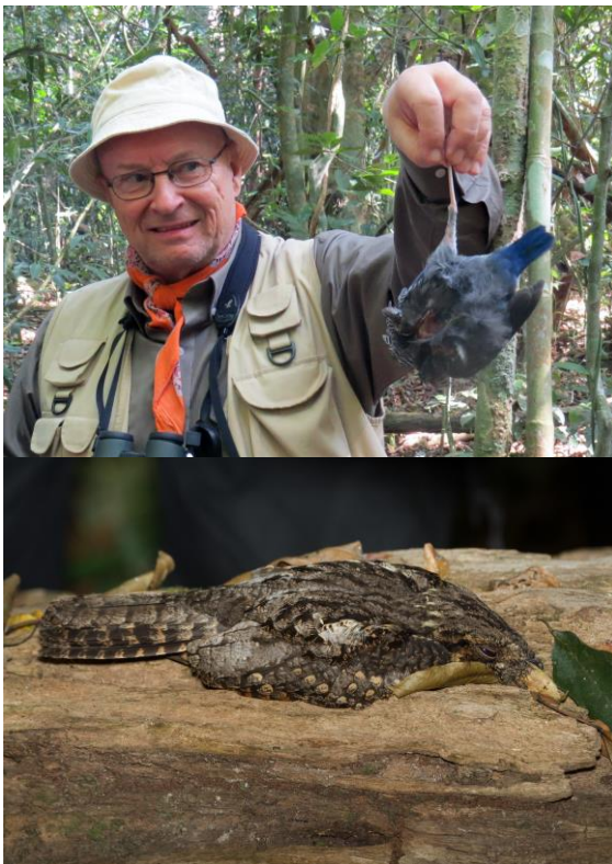
Blue Pitta helt död. Grey Nightjar levde lite.

Partridge (hörd), Red Junglefowl , Crested Goshawk , Emerald Dove , Thick-billed Green Pigeon , Vernal Hanging Parrot , Collared Owlet (hörd), Orange-breasted (hörd) och Red-headed Trogon , Chestnut-headed Bee-eater , Moustached Barbet , White-bellied Woodpecker (hörd), Greater Flameback (hörd), Heart-spotted Woodpecker , Indo-chinese Cuckoshrike , Rosy Swinhoe's samt Ashy Minivet , Blue Rock Thrush , Slaty-backed Forktail , Large Scimitar Babbler och Lesser Necklaced Laughingthrush .