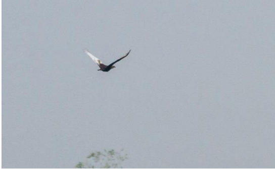
Bengal Florican flyr fältet.

En betydligt mindre, men för området också mycket speciell art var Manchurian Reed Warbler , som namnet antyder en över-vintrare här. Vi hittade minst två ex. i det höga gräset och fick se dem ganska fint.