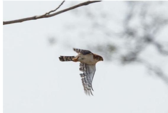
White-rumped Pygmy Falcon

Längs vägen upptäckte vi ett par av den i Sydostasien alltmer svårfunna White-rumped Pygmy Falcon , i ett område där Bengt varje gång sett arten under sina tre tidigare resor till Kambodja. Ett lite stycke längre bort hittade vi nästa rovfågel av dvärgväxt – en Collared Falconet .