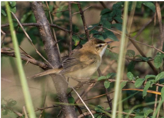
Manchurian Reed Warbler

En betydligt mindre, men för området också mycket speciell art var Manchurian Reed Warbler , som namnet antyder en över-vintrare här. Vi hittade minst två ex. i det höga gräset och fick se dem ganska fint.