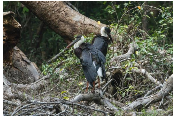
Woolly-necked Stork men ingen and.

naturligtvis också övriga som så småningom anländer till platsen.