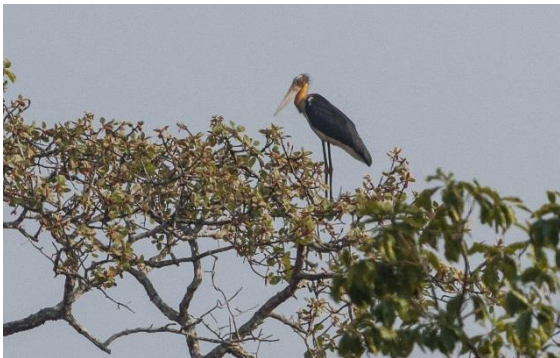
En fin vägart: Lesser Adjutant.

Ett stopp på vägen gjordes vid ett stort öppet gräs/våtmarksområde omgivet av skog. Det liknade mycket ett svenskt skogsmyrlandskap. Här noterade resans tredje och fjärde Lesser Adjutant samt första och enda Changeable Hawk-eagle , båda sittande i trädtoppar, den senare dock på ganska långt håll. Ett stort antal Baya Weavers huserade i gräset och buskarna vid vägen.