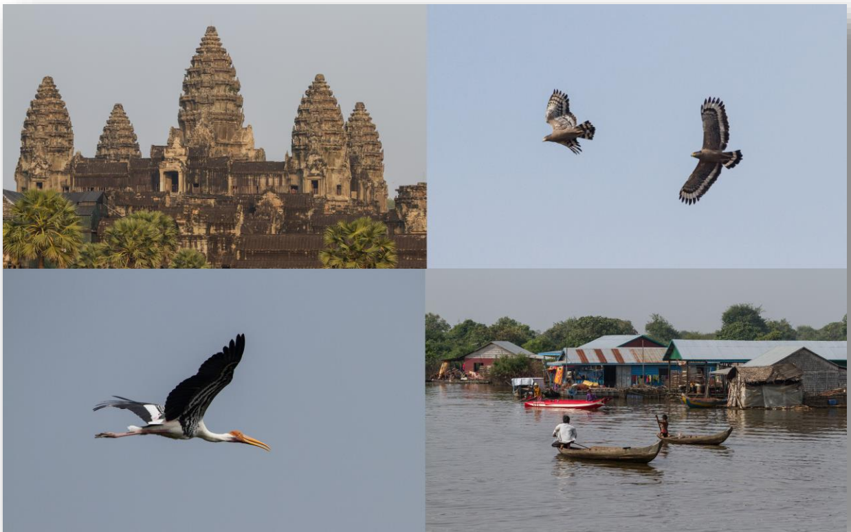
Angkor Vat, Crested Serpent Eagle, Painted Stork samt Prek Toal