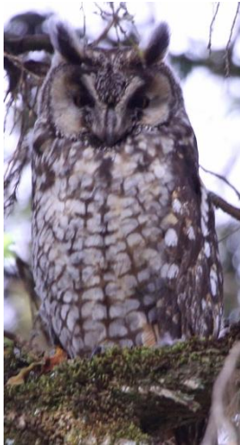
African Long-eared Owl

Vi hann inte pusta många minuter innan den lokale fågelguiden Abdullah kom för att ta oss med på en "game walk" i närområdet. Vi blev påvisade många ståtliga Gedemsa (Mountain Nyala), några Ethiopian Highlands (Menelik's) Bushbuck och även gott om Common Warthog . Djuren var både fina och extremt nära, men det var nog den på dagkvist fint sittande African Long-eared Owl som vi blev gladast för.