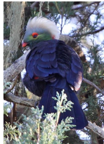
Prince Ruspoli's Turaco