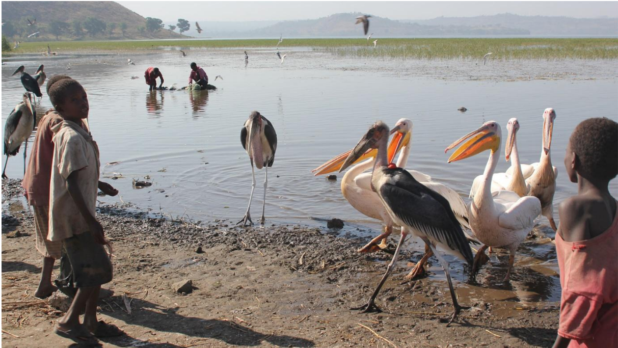
Awassa Fish Market

Vi såg ungefär samma arter som dagen innan. Vi gjorde också ett kort stopp vid den berömda "Fish market", vilket var en intressant fågelupplevelse, men även kul att se hur vissa fiskare rensade fångsten genom att använda munnen! Hade vi inte redan upplevt närheten till Marabou Stork och Great White Pelican vid Lake Ziwai hade naturligtvis upplevelsen av Awassa Fish Market varit ännu starkare, men den var fortfarande imponerande.