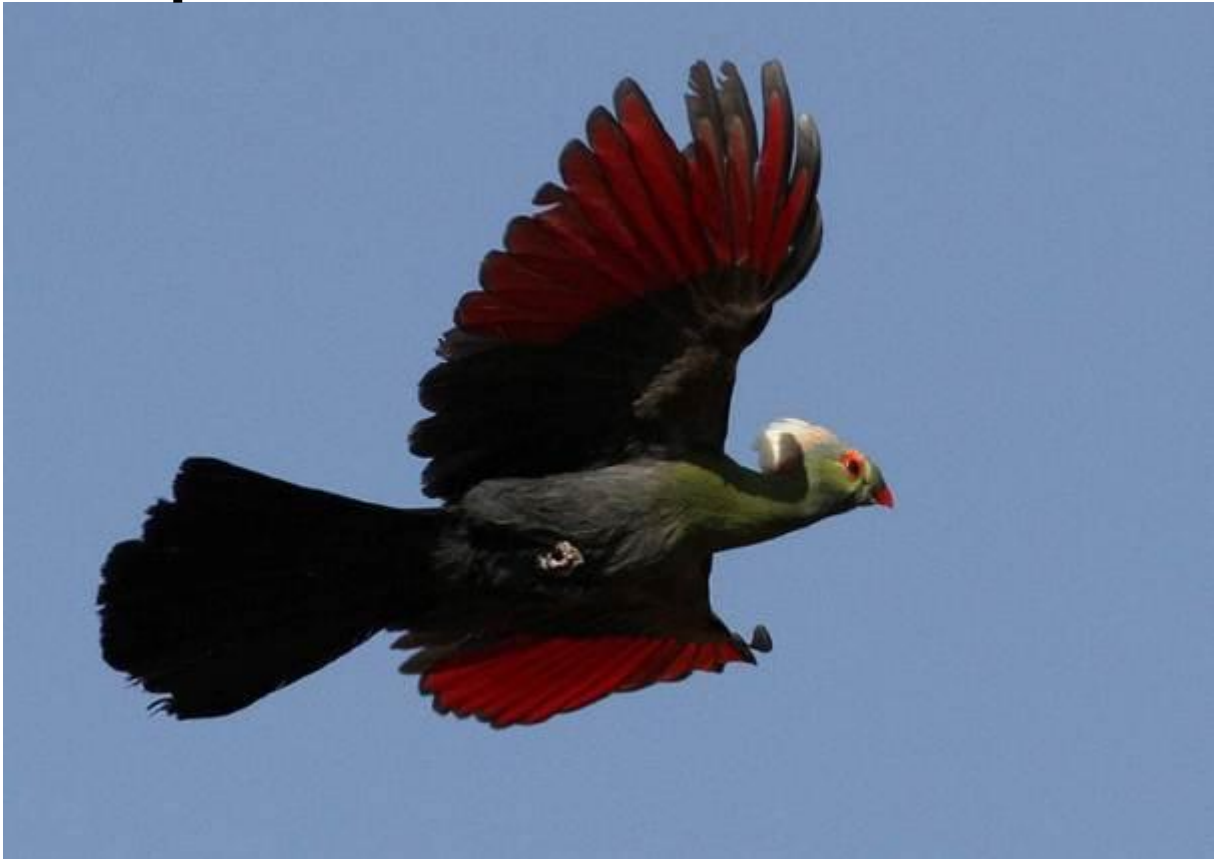
Alla bilder bl.a. Prince Ruspolis Turaco här ovan, tillhör David Erterius