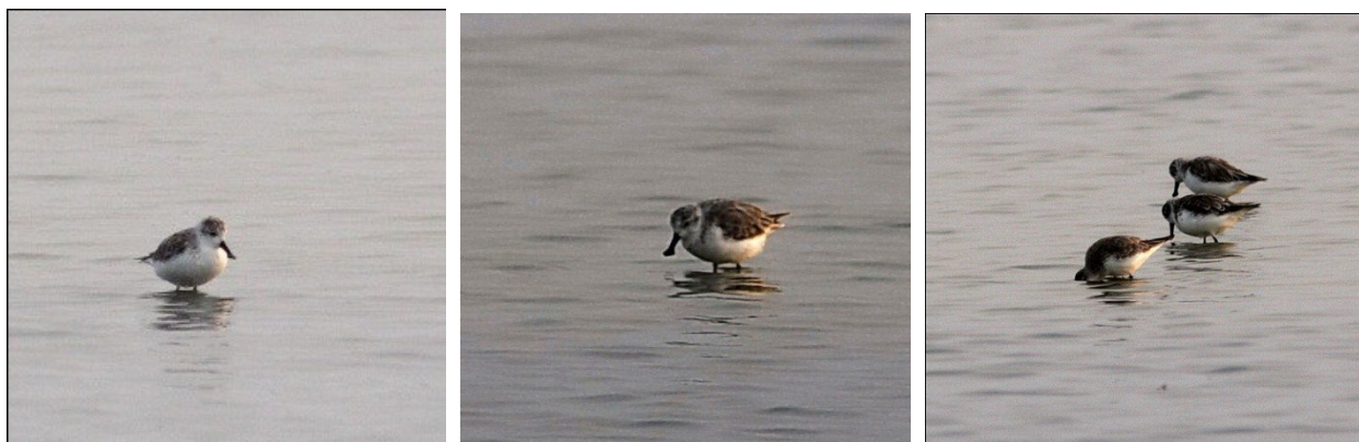
Det fanns 5 Skedsnäppor som övervintrader i Laem Pak Bia i år. Evt. fanns det ytterligare 2 där sporadiskt. Vi såg 2 av dem denna gång...