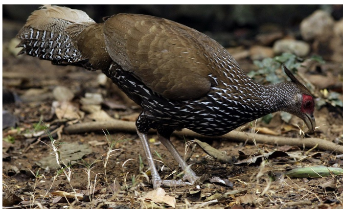
Kalij Pheasant - höna