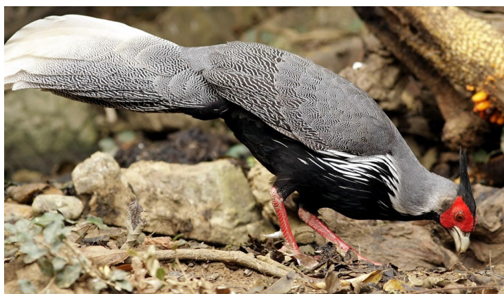
Kalij Pheasant – tupp