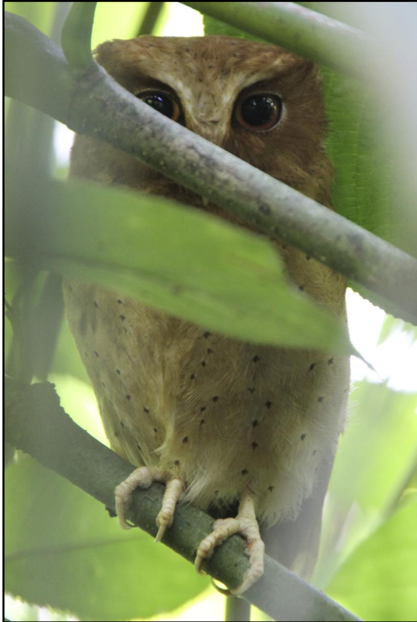
Serendib Scops Owl