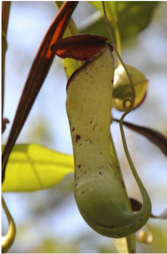
Carnivorous plant Nepenthes

Nuwara Eliya i det centrala bergsmassivet. Men det låg utanför vår färdplan.