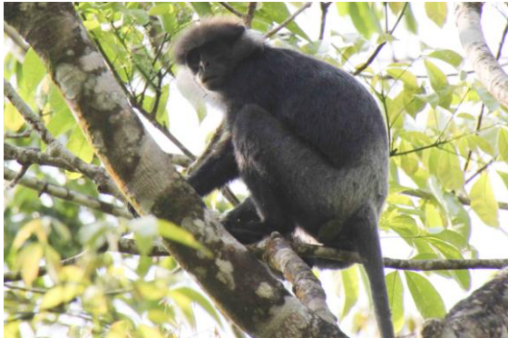
Purple-faced Leaf-monkey, Sinharaja

bobygge 2½ meter upp i en buske. Dagen avslutades med en god femrätters middag med knaprigt, salt och gott papadambröd, allt nersköljt med Sri Lanka-ölet Lion.