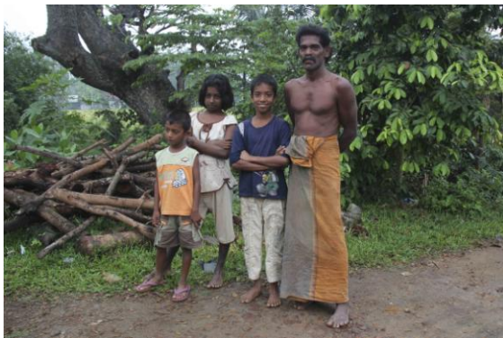
The potter family outside Tissa

Common Myna Sri Lankan race, Nuwara Eliya Vi checkade sedan in på ett fascinerande hotell, Leisure Village, på andra sidan av sjön vid Nuwara Eliya. Många hus i staden, även de nybyggda, är uppförda i klassisk brittisk stil, så också detta hotell som byggdes bara för några år sedan. Möbler och inredning var också i gammal engelsk stil, mera chubby än chic. Man hade verkligen lagt sig vinn om att allt skulle vara gammalbrittiskt och opraktiskt, både det mekaniska och det elektriska. Möglet i badrummet var förmodligen importerat från Windsor. Men vid middagen var utsikten över sjön med den upplysta staden på andra sidan verkligen magnifik och likaså trerättersmiddagen. Akustiken i den sterila matsalen var dock helt hopplös.