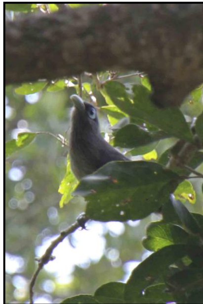
Blue-faced Malkoha

Brown Fish Owl Ketupa zeylonensis zeylonensis (Brun fiskuv)