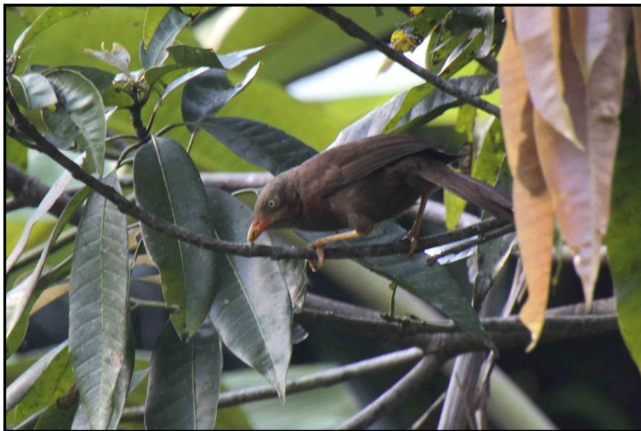
Sri Lanka Rufous Babbler

1 ex Kitulgala Forest reserve 8/3, 1 ex Sinharaja NP 10/3.