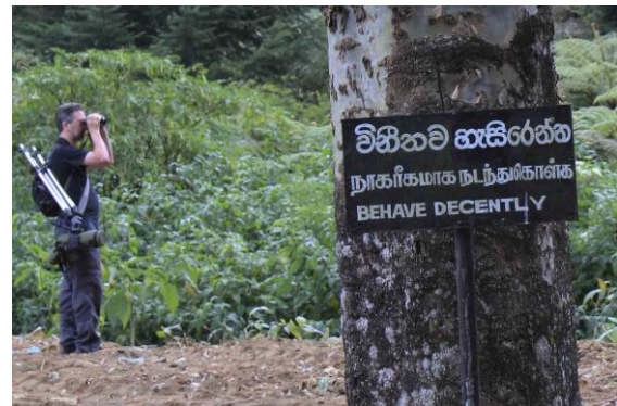
How to behave in Victoria Park

och pekade ut den granna hanen med läckert rödfärgat bröst. Sedan svischade vi åter förbi de förvånade parkvakterna in i parken och där hittades raskt en annan läckerbit, en Velvet-fronted Nuthatch med grannt blå rygg och röd näbb. Kanske grannast av alla nötväckor. Därefter raskt vidare mot nästa kryss tillsammans med hela skådarflocken. Men objektet var inte kvar. Efter en stunds lyssnande och letande hittade vi de två vackra hanarna Pied (Ground-) Thrush, snyggt svarta och vita med gul näbb. Det tog en bra stund innan pulsen lugnade ner sig efter detta veritabla trippeldrag. Mycket roligt att få uppleva!