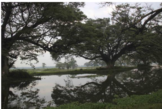
Wetlands outside Tissa

Dag 7: Söndag 13/3 med megalarm. Under frukosten drog stora flockar med med Rose-ringed Parakeet, totalt över 600 individer, och grupper med Indian Cormorant över hotellträdgården för att börja dagens födosök.