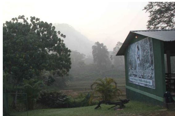
Blue Magpie Lodge, Sinharaja

Abey ville göra ett nytt försök på Serendib Scops Owl vid risfältet istället för att åka vidare till Sinharaja som planerat. Sagt och gjort. Av med kängorna och med igelsockorna i beredskap antrade vi kanoten på nytt. Vid överfärden i den urholkade trädstammen såg vi en Stork-billed Kingfisher. Ny endem blev det i form av tre ursnygga Sri Lanka Swallow. Vi fick sedan fina obsar på Indian Pitta, Sri Lanka Hanging Parakeet, Crimson-backed Flameback, Layard's Parakeet, Malabar Trogon och Sri Lanka (Hill) Myna. Ingen ugglan idag heller, men väl en hörobs. På återvägen dök det upp en grupp med endemen Sri Lanka Junglefowl på stigen. 11.20 Avfärd mot Sinharaja med box-lunch i bagaget, som senare avnjöts i bilen.