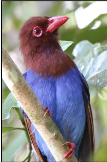
Sri Lanka Blue Magpie