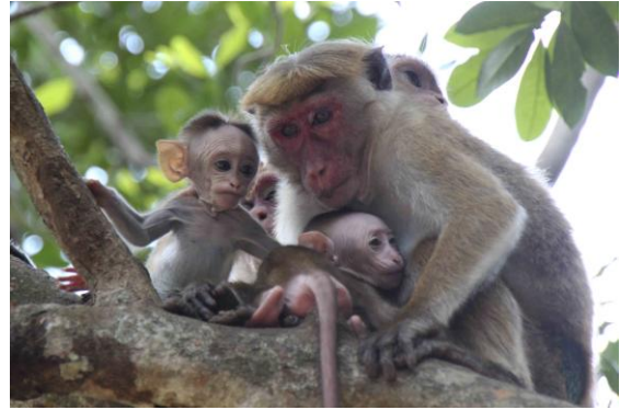
Toque Macaque family, Yala

På icke-fågellistan kunde vi summera Sri Lanka Grey Langur, sex Asian Elephant varav en 'tusker', drygt 50 Water Buffalo, Spotted Deer, Sambar Deer, Marsh Crocodile och en snygg Star Tortoise. På väg ut ur parken höll vi på att råka ut för en förödande olycka. Chauffören somnade vid ratten och vi var en hårsman från att välta ned i diket med den öppna jeepen. Skönt att få åka hem till hotellet i Toyotabussen med stabila Abey som förare. Vi var tillbaka kl 18 på hotellet.