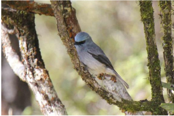
Dull Blue Flycatcher, Horton Plains