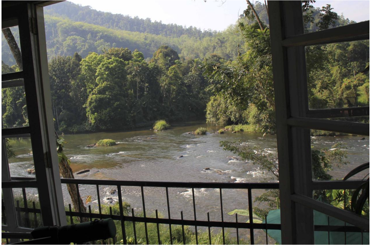
First morning at Kitulgala Rest House