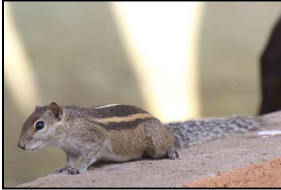
Indian Palm Squirrel