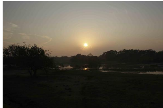
Sunset in Udawalawe

Land och Water Monitor observerades. Vi hade här också resans enda Asian Koel.