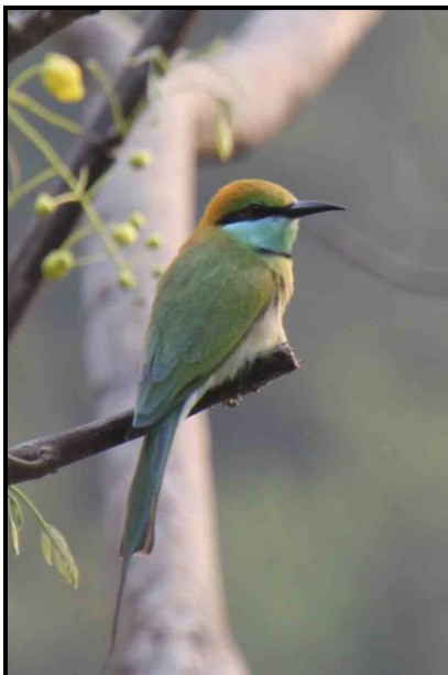
Little Green Bee-eater

>25 ex Uda Walawe NP 11/3, >35 ex Yala NP 12/3. Endemisk ras.