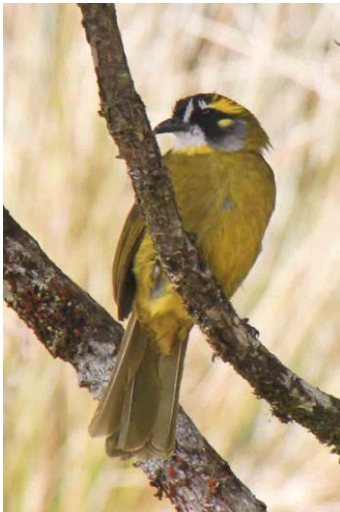
Yellow-eared Bulbul, Horton Plains