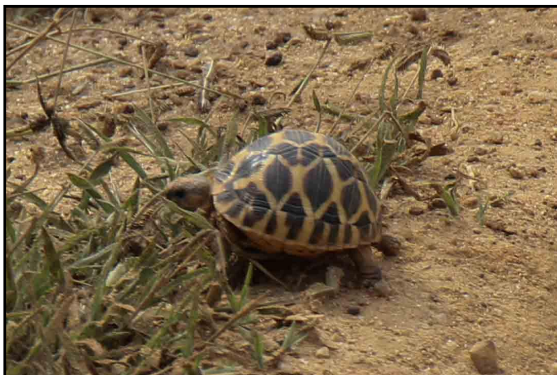
Indian Star Tortoise

Indian Star Tortoise Geocelone elegans (Stjärnsköldpadda)