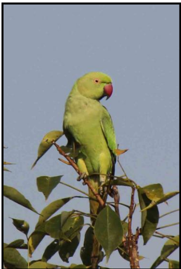
Rose-ringed Parakeet, female

2 ex Kitulgala Forest reserve 8/3, 4 ex Kitulgala Forest reserve 9/3. Endem.