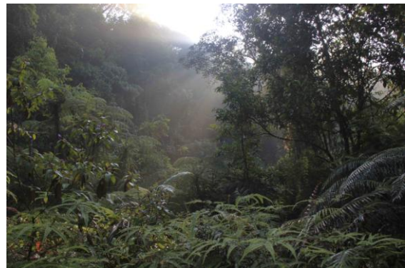
Kitulgala forest Reserve