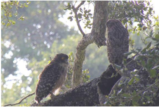
Brown Fish-owl at nesting hole, Yala

försäkrade sig om att vi förstått det. Proffsig!