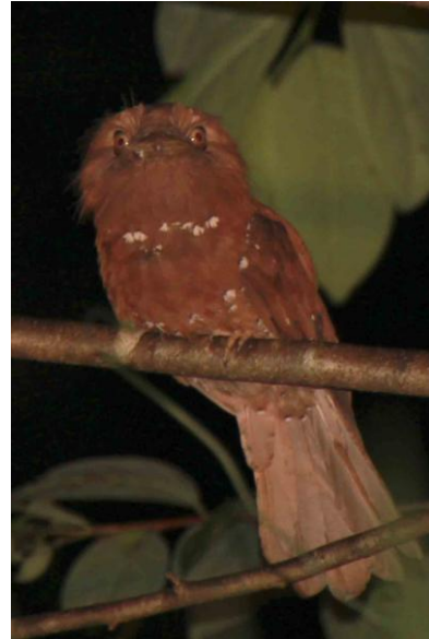
Sri Lanka Frogmouth, female