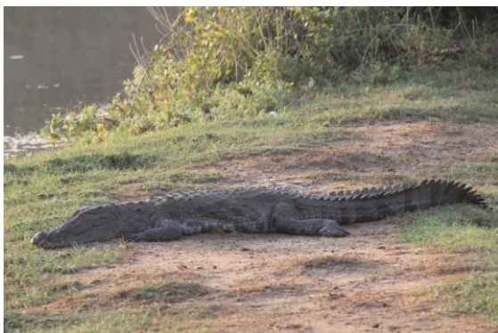
Marsh Crocodile (Mugger), Yala

Vid 14.30 fortsatte vi vår game-drive. Det enda nya i fågelväg blev White-browed Fantail och ett trettioal Spot-billed Pelican.