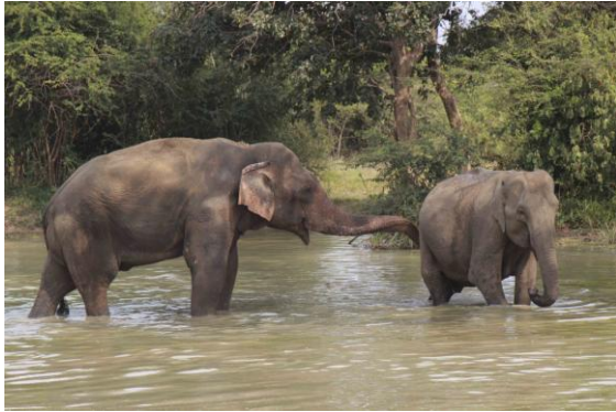
Asian Elephant, Udawalawe

Önskade man få stopp på ekipaget var det bara att knacka på jeepflakets metallram. Arterna droppade in i rask takt; Jerdon´s Bushlark, Indian Peafowl (många), Sri Lanka Green Pigeon (endem), Malabar Pied Hornbill, Crested Tree-swift, Black-backed (Indian) Robin, Sirkeer Malkoha, Brown-headed Barbet, Painted Stork, Orange-breasted Green Pigeon, talrikt med Small (Crimson-fronted) Barbet. Tredje Priniaarten för dagen blev Ashy Prinia. På däggdjursfronten gavs flockar med Spotted Deer, Sri Lanka Grey Langur, Sri Lanka Ruddy Moongoose, Sri Lanka Black-naped Hare, många Water Buffalo och Wild Boar. Vi såg också ett femtiotal Asian Elephant i små grupper. Av de lankesiska elefanthannarna är det endast sex procent som utvecklar betar. Vi såg en sådan 'tusker'.