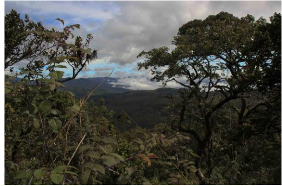
Rhododendron bushes at Horton Plains

Därmed var alla fem bergsendemerna hemma och Sri Lanka clean-up var ett faktum efter åtta dagar. Vi plussade sedan under frukosten på med ytterligare ett par Sri Lanka White-eye och en närobs på Common Hawk-cuckoo.