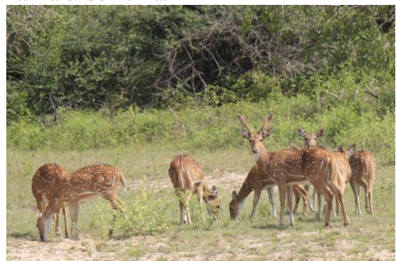
Spotted Deer, Yala