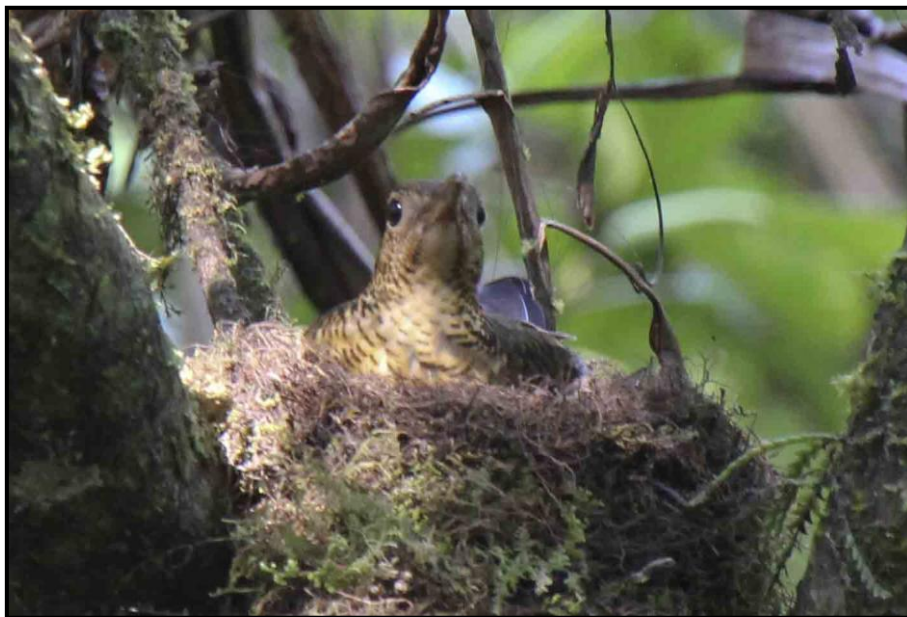
Sri Lanka Scaly Thrush

3 ex + 5 hörda Kithulgala Forest reserve 8/3. Endem.