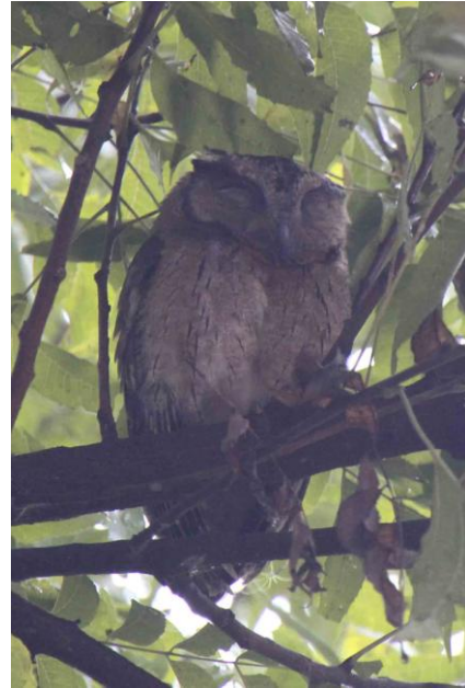
Indian Scops Owl

I träden hängde mängder med flygande rävar, Indian Flying Fox, kanske upp mot tusen individer. Av en mycket ung man, krukmakarens son, blev vi också förevisade en Indian Scops Owl på dagkvist.