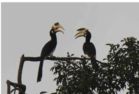
Malabar Pied Hornbill, male(left) and female, Udawalawe

Önskade man få stopp på ekipaget var det bara att knacka på jeepflakets metallram. Arterna droppade in i rask takt; Jerdon´s Bushlark, Indian Peafowl (många), Sri Lanka Green Pigeon (endem), Malabar Pied Hornbill, Crested Tree-swift, Black-backed (Indian) Robin, Sirkeer Malkoha, Brown-headed Barbet, Painted Stork, Orange-breasted Green Pigeon, talrikt med Small (Crimson-fronted) Barbet. Tredje Priniaarten för dagen blev Ashy Prinia. På däggdjursfronten gavs flockar med Spotted Deer, Sri Lanka Grey Langur, Sri Lanka Ruddy Moongoose, Sri Lanka Black-naped Hare, många Water Buffalo och Wild Boar. Vi såg också ett femtiotal Asian Elephant i små grupper. Av de lankesiska elefanthannarna är det endast sex procent som utvecklar betar. Vi såg en sådan 'tusker'.