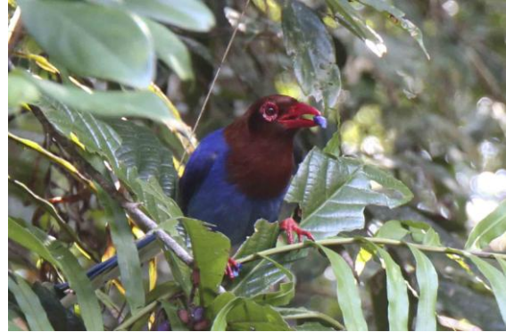
Sri Lanka Blue Magpie, Sinharaja

studenterna kl 10.00 när de är på plats. Av en händelse var vi just där kl 10.00! Vi hade även Dark-fronted Babbler, Large-billed Warbler och Lesser Yellownape av den endemiska rasen wallsi i området. Det cirklade även en Crested Serpent-eagle ovanför oss.