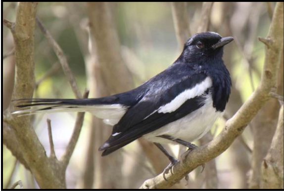
Oriental Magpie Robin