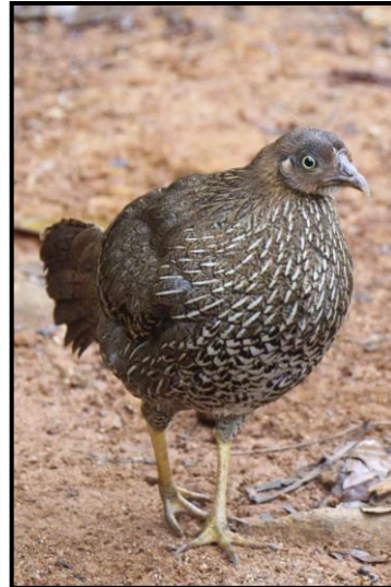
Sri Lanka Junglefowl, female