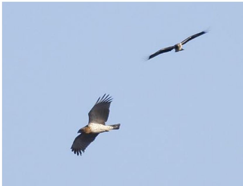
En av dvärgörnarna tillsammans med ormörnen.

På sena eftermiddagen återvände jag till vägen som leder till Pefki. Nästan uppe vid byn stannade jag och spanade rovfågel. Tornfalkar syntes jaga i eftermiddagssolen och helt plötsligt dyker några mindre örnar upp. Det visade sig vara två dvärgörnar i ljus fas och en adult ormörn. Dessa tre låg i samma skruv ett tag innan de försvann västerut nedåt dalen. Även korpar visade sig fint i solen.