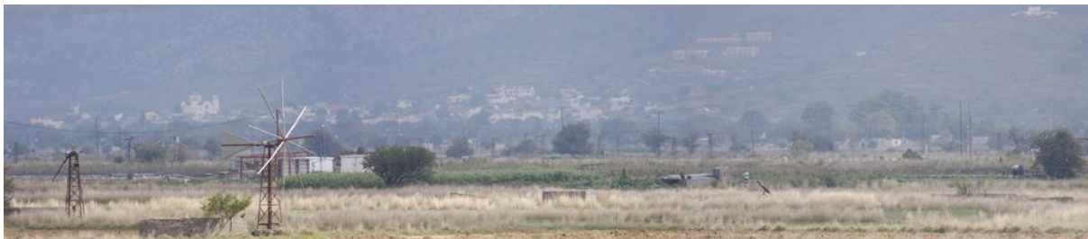
Lassithiplatåns bördiga marker drygt 1500m över havet.

En fantastisk lokal några mil sydost om Heraklion. Ligger relativt centralt på ön. Platån är tillgänglig såväl från öns östra som västra sida. Fantastisk för många arter, såväl rovfågel som tättingar. Det som slår en vid den första anblicken är den bördiga marken som helt plötsligt öppnar upp sig då man når platån. Detta är helt annorlunda jämfört med den lite karja biotopen på väg upp mot platån. Vägen dit är inte något för den som inte gillar höjder men erbjuder även den fina skådmöjlighet.