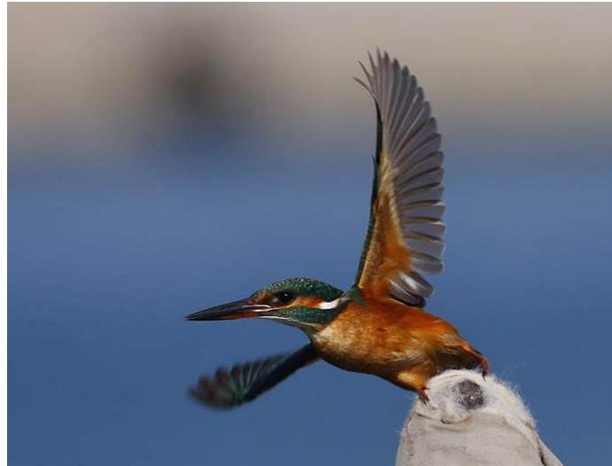
Kungsfiskare i Sitias fiskehamn.

I Sitia siktades de ständigt närvarande gråsparvarna och turkduva. I hamnen intill strandpromenaden sågs kungsfiskare och medelhavstrut. På kvällen sågs från hotellets balkong gråhäger, sädesärta, sammetshatta, gråsparv, talgoxe, medelhavstrut samt två blåstrastar som lockade.