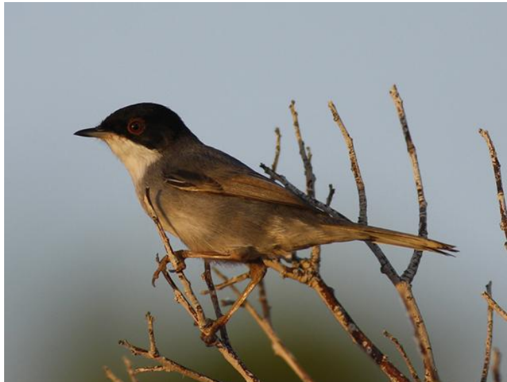
Den allmänna sammetshättan är lite svårgraferad då den gärna "skulkar" i diverse låglänta risbuskar.

Tog en morgonpromenad mot ån som mynnar i havet med ett mindre delta. Tyvärr var flodbanken i stort sett helt uttorkad så här års men de små pölar som fanns gav ändå lite bördighet i närområdet och fåglar samlades här. För att komma hit så följer man vägen ut ur samhället åt öster. Vid första korsningen håller man höger och kommer så ut mot havet. I korsningen hörde jag biätare och vände mig om för att få se nio biätare dra förbi i riktning mot bergen. På plats såg jag bl a turkduva, hussvala, rostgumpssvala (1), ladusvala, ormvråk, sammetshättan, tofslärka, gulärta som letade föda på marken, buskskvätta, gråsparv, turturduva (1), fiskmås. Kvällen ägnades åt en promenad till favoritklippan intill hotellet och blåstrast, sädesärta, sammetshättan, talgoxe, gråsparv och någon enstaka spansk sparv mm siktades.