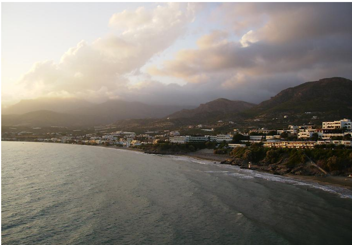
Makrigialos by med det egna Vinghotellet till höger.

Byn Makrigialos kanske inte är optimal att använda som boende om man endast besöker ön för att skåda fågel. Om man däremot är på familjesemester så är byn optimal som badort. Detta trots att restiden från flygplatsen i Heraklion är drygt två timmar inklusive paus. Vägarna är dock relativt bra utbyggda och det verkar som om de kontinuerligt förbättrar de större vägarna på öns östra del. Tillgängligheten till resten av ön är ändå helt ok om man hyr bil ett par dagar. Till Lassithiplatån får man kanske räkna en restid på ca två timmar med en del stop på vägen. Rådet är kanske att ta en övernattningsäven mitt på ön om tid och möjlighet finns för att även hinna med fler lokaler. Vägarna till och från byn ger även goda möjligheter att följa kustremsan på öns södra sida. Man kan tillägga att man som turist kan ha det rätt lugnt och inte jagas av försäljare och inkastare till diverse restauranger. Byn har fortfarande en rätt så cool inställning till oss turister.