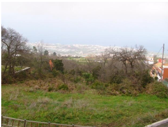
Norra sidan av Tenerife, Orotavadalen med Puerto de la Cruz i bakgrunden.

På vägen ner mot Orotavadalen gjorde vi några stopp i tallskogen, utan att hitta några fåglar. Kanarietallarna var här fulla av hängande lav. Det låg ett litet molntäcke på 1000 m höjd över dalen och innan vi körde in i det såg vi 10 nya enfärgad seglare . Vi körde västerut genom övre delen av Orotavadalen och hade klar och fin utsikt ner mot bebyggelse, odlingar och haltomma vattenmagasin. Vi fick en snabb titt på en rödhake innan den flög in i en mur. Vi fortsatte ner till dammen Embalse Cruz Santa. Vi satt strax ovanför den stora, plasttätade dammen i ca en timme och hittade 2 gråhäger , 1 silkeshäger , 2 vigg , 35 medelhavstrut, 10 sothöna, 4 svarthätta samt kanariesiskor och kanariegransångare. Vi fortsatte mot öster och via Tegueste kom vi in till La Lagunas norra infart där finkarna ska finnas. Det var exakt 1,6 km från korsningen Tejna/Mercedes, helt enligt boken. Vi gick runt i 1,5 timme och det var gott om fågel, de nya blev 2 gulhämling och 3 hämling .