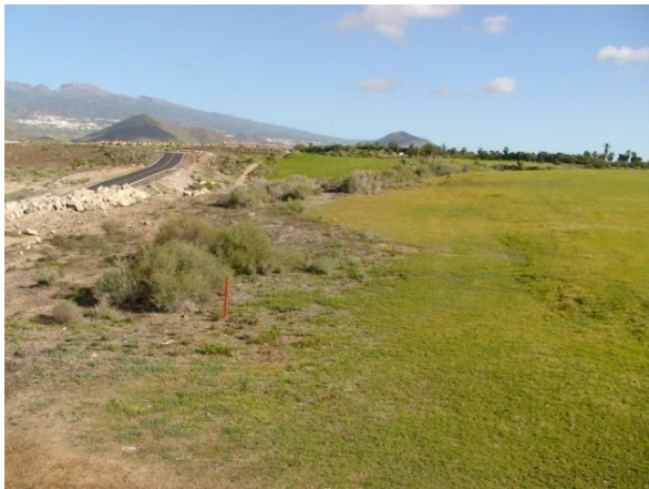
Vid sydkusten finns några konstbevattnade golfbanor som drar till sig en del fågel.

23 januari: Denna vackra dag hade vi tänkt åka till de omskrivna golfbanorna i söder. Vi började med den västliga Amarillo Golf. Det var krångligt att hitta dit, vi irrade länge i ett industriområde innan vi hittade en pytteliten skylt från fel håll. Vi stannade vid ett vattenmagasin längs infarten och fick se 2 skedstork , 1 silkeshäger, 1 gluttsnäppa , 3 drillsnäppa , 3 mindre strandpipare , 1 forsärla , 10 spansk sparv och 1 myskanka . Vi fortsatte ner till klubbhuset och spanade av euphorbia-ravinerna norr om detta. Här fanns det en hel del fågel i värmen och oväsendet från flygplanen som landade var 3:e minut. Vi hörde en härfågel , såg spansk sparv, kanariepiplärkor, kanariegransångare och Ann noterade snabbt en glasögonsångare . Eftersom Sten också ville se den, så satte vi oss i ravinkanten en timme och väntade. Det resulterade i en grupp på 3 fåglar som hoppade runt i buskarna och sjöng och visade upp sig under korta ögonblick.