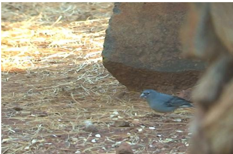
Blåfink vid rastplatsen Las Lajas, en av resans målarter.

17 januari: Efter incheckning så tog vi en första biltur norrut uppför bergen. Redan i hotellträdgården hördes spansk sparv och turkduva . Före Arona hittade vi de efterlängtrade kanariesiskorna samt tamduva och tornfalk . Vid rastplatsen Las Lajas på 2165 meters höjd fanns det gott om kanariesiskor. Vidare hittade vi 1 koboltmes , 1 kungsfågel , 3 corp , 5 större hackspett och 5 blåfink . Blåfinkarna åt bland utspillda solrosfrön och sågs fint på nära håll. Lite högre upp i bergen hörde vi den första kanariegransångaren . I skymningen åkte vi tillbaks mot kusten och tillbringade kvällen på en strandrestaurang där vi åt god fisk med kanarisk potatis.