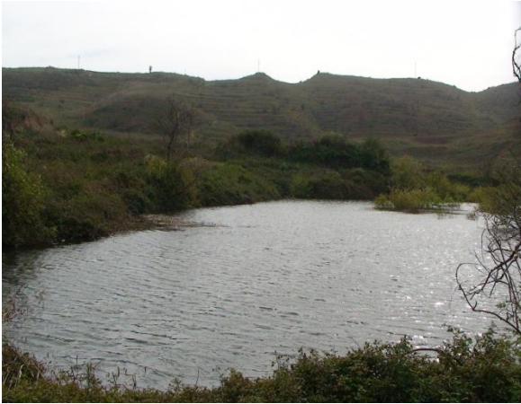
Erjos Ponds, en av de sällsynta dammarna med sötvatten. Lokal för sothöna, rörhöna, kanariegransångare, Wood Duck, klipphöna mm