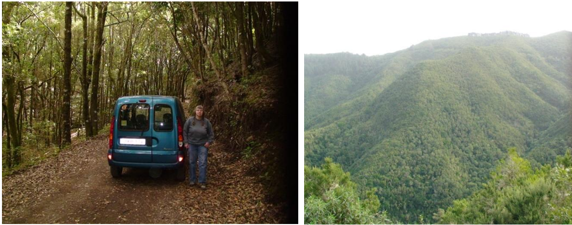
Lagerskogarna på nordvästra Tenerife med chans på duvor. Vi hittade dock de endemiska duvorna på La Gomera i motsvarande biotop.

18 januari: Vår redan bokade och betalda hotellfrukost började inte förrän kl 8.30. Det verkade inte bra för fågelskådare! Dock var den ypperlig med ägg, bacon, bönor och allt annat som hör till, så det skulle gå bra att hoppa över lunchen. Vi körde mot nordväst genom Guia De Isora och Santiago del Teide mot Erjos. Längs vägen hittades 2 koltrast, 1 tornfalk och 2 klipphöna. Den första hönan stod ett engelskt par och tittade på med tub, så vi stannade och pratade med dem. Vid södra Erjos-skylden gick vägen in till lagerskogen mot Las Portelas. Efter 1 km vid en telemast fick man inte köra längre enligt en liten spanskspråkig skylt. Vi började gå, men eftersom vägen var så bra och Ann gick på kryckor efter ett höftbyte så låtsades Sten inte kunna spanska och hämtade bilen. Vi körde 4 km till utsiktsplatsen och satte oss beredda att spana duvor resten av dagen. Men efter en halvtimme dök det upp en bil med 3 parkvakter, som talade om för oss det olämpliga att köra i nationalparken. De var vänliga och pekade ut en plats närmare förbudsskylden, där man kunde klättra upp lite och få en utsikt över dalen och de flygande duvorna, helst tidig morgon eller sen eftermiddag.