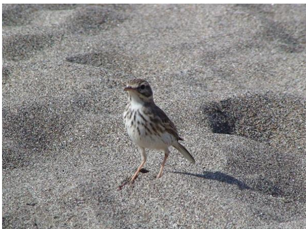
Kanarisk piplärka vid Playa de la Tejita söder om flygplatsen.