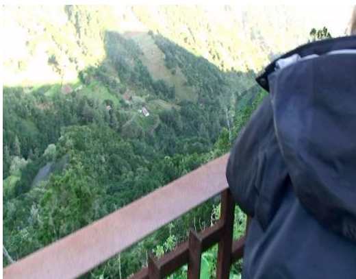
La Gomera. Vid rastplatsen 200 meter efter Mirador El Rejo, intill järnräcket, kunde vi se 10-talet duvor flyga och sitta i lagerskogen.