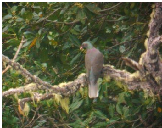
Lagerduva sedd genom tubkikaren, La Gomera.

21 januari: Vi åkte tillbaka till gårdagens duvställe till kl 9. Mellan kl 9.30 och 10 flög det in minst 10 lagerduvor och satte sig i 3 närliggande träd. De verkade äta av lagerträdens frukter denna halvtimme innan alla försvann igen. Eftersom de satt både still och öppet så fick vi kanonobsar på dem! 3 kanarieduvor flög snabbt förbi lagerduvorna och försvann. Vi körde vidare in mot öns centrum och hittade 1 bofink , 2 sjungande rödhake , 2 kungsfågel, koltrastar och massor av kanariegransångare. Vi fortsatte uppe i öns ljungskog först västerut och sedan