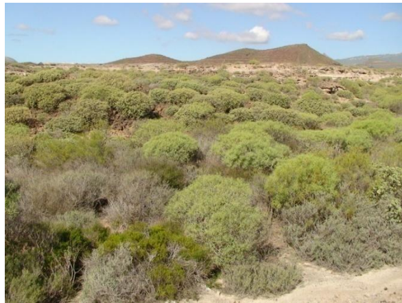
Mellan golfbanorna finns orörd natur med euphorbiabuskar där vi såg glasögonsångare.

Vi for vidare mot Golfo del Sur, som verkade helt avstängd för icke golfare. Vid en vägbom på högersidan kunde man parkera och titta över stängslet åt vänster precis vid en liten damm med vattenfall. Här finns ett antal vattenfåglar, som mest kändes som parkfåglar, men i alla fall noterades: 4 rörhöna, 1 sothöna, 1 kohäger , 1 stripgås , 20 rostand och 2 myskanka . Alla fåglar var flygkunniga och flög hela tiden upp och ner i dammen och höll sig undan från golfbilarna.