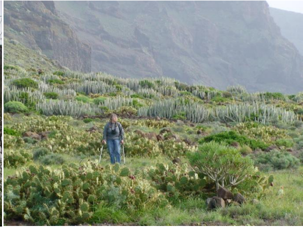
Det vackra kustlandskapet i nordvästra hörnet av Tenerife med tornfalk, stensparv, klippduva och chans på berberfalk.

19 januari: Ännu en vacker, varm och solig dag startar. Vi körde österut och spanade av stranden vi Las Galletas, men hittade bara medelhavstrutar. Vi åkte till Ten Bel, där vi bodde 1983, och tog en promenad i parken. Där hittade vi 20-tal halsbandsparakit , 2 munkparakit och 3 steglits . Utanför hotellets badpool gick 1 större strandpipare på stranden tillsammans med en större vadare. Sten var tvungen att hämta tuben i bilen innan vi lyckades få den till småspov .