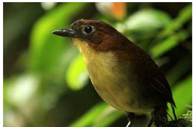
Yellow-breasted Antpitta - Grallaria flavotincta

6 januari Under natten regnade det kraftigt, men det upphörde efter frukost strax före sex. På en stolpe utanför satt en Strongbilled Woodcreeper. Vi åkte upp mot Paz de la Avez där en herre vid namn Angel Paz har blivit kompis med ett gäng antpittor. Vi gick ner till ån i botten av dalgången och där kunde vi se när Angel visslade fram Cariña (Giant Antpitta) och en Yellow-breasted Antpitta som dock var lite tjurig. Antpittorna hoppade fram helt öppet och åt de maskar Angel lagt fram. Makalöst. Lite skådning i den fina ravinen gav Wedge-billed Hummingbird, Purple-bibbed Whitetip, Crimson-rumped Toucanet, Andean Cock-of-the-rock sedan fikade vi uppe vid husen och tittade bl.a. på Broad-winged Hawk och White-rumped Hawk.