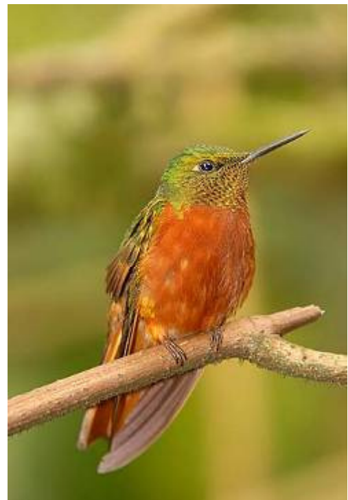
Chestnut-breasted Coronet - Boissonneaua matthewsii

Vi återvände mycket trötta till Orchids Paradise och åt middag.