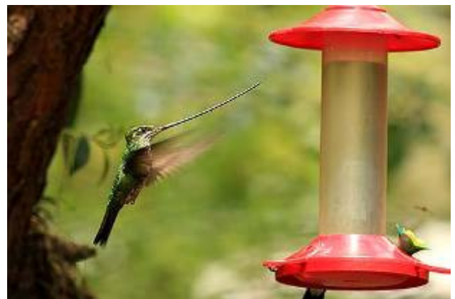
Sword-billed Hummingbird - Ensifera ensifera

Reselistan efter en vecka på östra sluttningen och en vecka i Amazonas innehöll 556 arter.