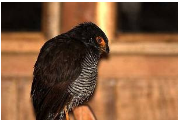
Barred Forest Falcon - Micrastur ruficollis