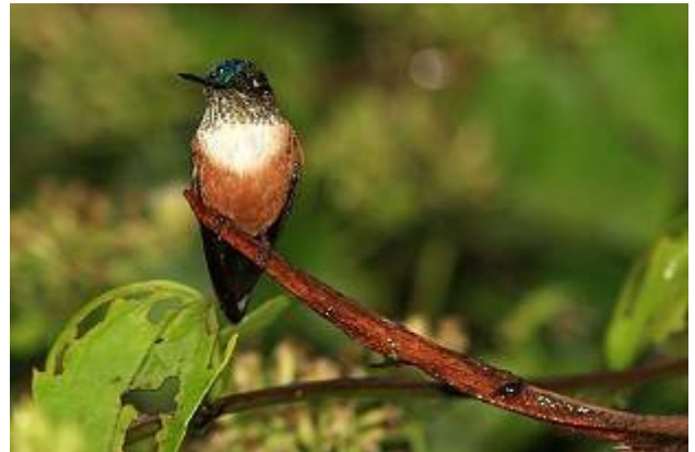
Violet-tailed Sylph - Agelaiocercus coelestis . Female

skogen. Regnet som fallit hela natten slutade precis när vi kom fram och vi hade en fin skådning, Gray-headed Kite, spelande Rufous-fronted Wood Quail, Rose-faced Parrot, bra obs av den svåra Western Woodhaunter, Plain Xenops, Spotted Woodcreeper, Checker-throated Antwren, Ochre-breasted Tanager och hörde Spotted-crowned Antwren. Tiden mellan nio och lunch tillbringade vi i ett högt fågeltorn "canopy tower", och hade stundtals bra flockar och annat, t.ex., Zone-tailed Hawk, Brown-capped Tyrannulet, Scarlet-breasted Dacnis, Scarlet-thighed Dacnis, Golden-hooded Tanager, Rufous-winged Tanager, samt hörde Slaty-capped Shrike-Vireo.