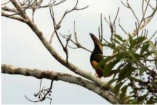
Golden-collared Toucanet - Selenidera reinwardtii

Piha, Blue-rumped Manakin, White-fronted Tyrannulet, Equadorian Tyrannulet, Collared Trogon och en cool och nästan klotrund Amazon Bamboo Rat som satt i ett träd ovanför stigen och trodde den var osynlig. En Cook-of-the-Rock, eller rättare sagt en Hen-of-the-Den, låg och ruvade i en ravin vid ett vattenfall.