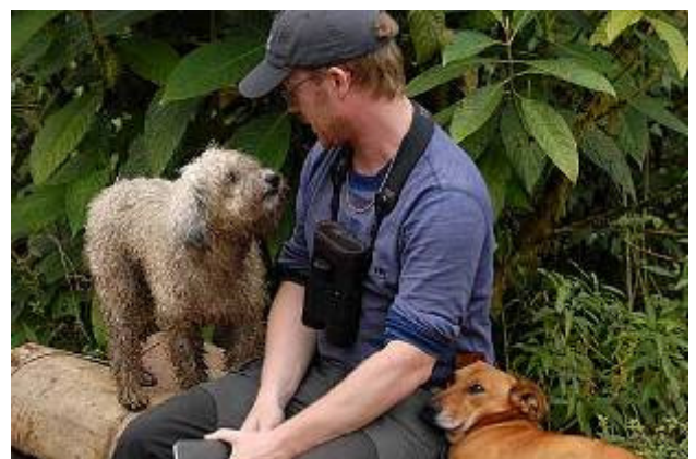
Kärlek vid första ögonkastet!

Vi bodde i ett hus ovanför floden Rio Baba inne på området där parkförvaltningen hade sitt kontor, tillsynes var vi de enda gästerna. Vid skymningen tog vi en öl på terrassen och hade Short-tailed Nighthawk överflygande.