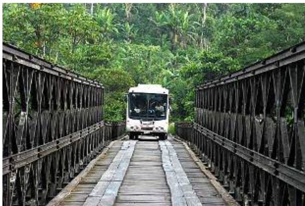
Bussen. Innan stötdämparna pajade.