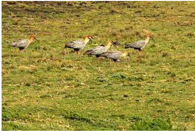
Andean (Black-faced) Ibis - Theristicus branickii

I en bäckravin halvvägs ner satt en Band-winged Nightjar på en klippshylla, på samma plats även Ecuadorian Hillstar, Andean Siskin, Hooded Siskin, Black-billed Shrike-Tyrant.