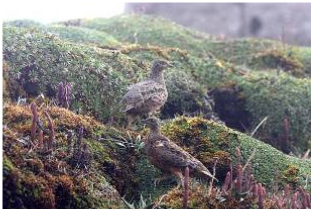
Rufous-bellied Seedsnipe - Attagis gayi

20 december Vi skulle upp på hög höjd och skåda ovanför trädgränsen. Därför var det inte lika viktigt att vara igång i gryningen och vi kunde faktiskt sova till 07, lika bra att ta ut resans enda sovmorgon på en gång. Från balkongen kunde vi direkt hänga in de första arterna Rufous-collared Sparrow och Great Thrush. Efter en frukost med fin frukt och toast åkte vi upp mot Papallacta. På väg ut ur Quito hade vi Black Vulture, Blue and White swallow, American Kestrel, och på högre höjd White-collared Swift och Carunculated Caracara.