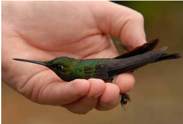
Green-crowned Brilliant - Heliodoxa jacula

området kring Milpe Road. Bra skådning ner till Cloude Forest Reserve, Buff-fronted Foliage-gleaner, Silver-throated Tanager, Yellow-green Bush-Tanager, Black-striped Sparrow sedan blev det ösregn i en timme, lyckligtvis kunde vi sitta under tak. Därefter promenad på stigar i området, hade White-whiskered Hermit, Green Thorntail, Green-crowned Brilliant, Guayaquil Woodpecker, Slaty Becard, Moss-backed Tanager innan vi i skymningen återvände upp till Mindo Loma.