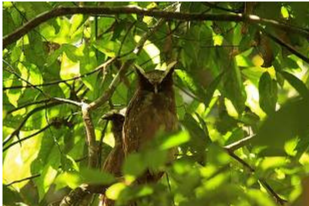
Crested Owl - Lophotrix cristata

Black Caracara, Great Potoo på en trädstam med en unge, White-flanked Antwren, Mottled-backed Elaenia, Drab Water-Tyrant och Umbrellabird.