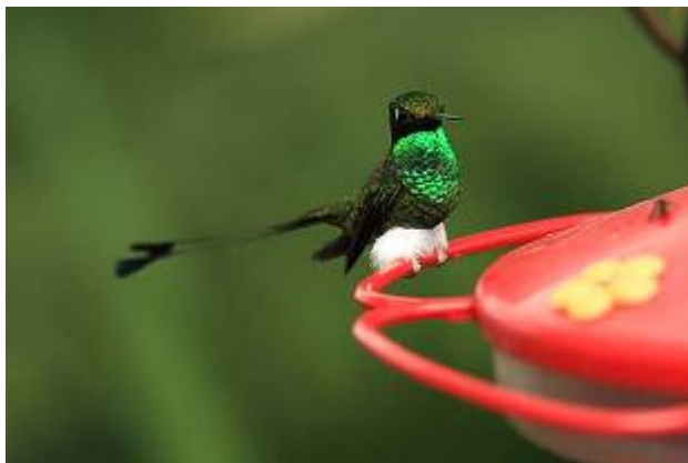
Booted Racket-tail - Ocreatus underwoodii

4 januari Tidigt i gryningen vid klockan 06 kunde vi från lodgen höra Giant Antpitta och Rufous-bellied Nighthawk. Därefter letade vi den sällsynta och vackra Tanager Finch och fick väldigt fina obsar på några stycken invid Mindo Road. En hel del fina blandflockar rörde sig också uppe i trädkronorna och som vanligt när man är 4 skådare som ropar ut arter blev det ganska rörigt. Hade bl.a. Sepia-brown Wren och hörde Grass-green Tanager. Sedan gick vi i typiskt väder med dimma och stundtals duggregn Bellavista Research Station Road som gick i fin miljö med en del ängar inne i skogen. Vi såg ovanligt många Plate-billed Mountain Toucan hörde Dark-backed Wood Quail, den svåra Spot-fronted Swift och en mycket fin obs på Cliff Swallow som var kryss för Boris.