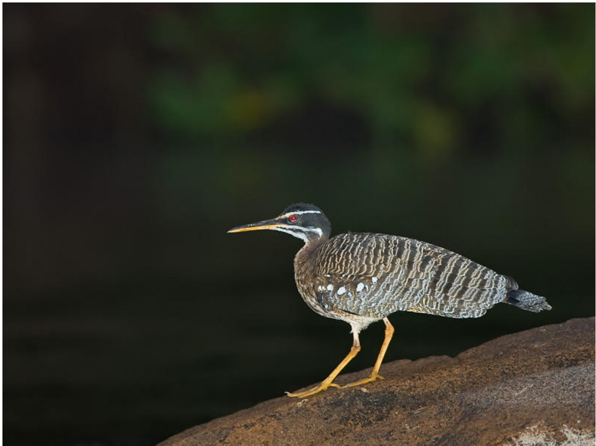
Sunbittern vid Río Cristalino.

Vår första djungelmorgon började med frukost 05.00 och vid 05.30 gick båten uppströms med Jorge vid rodet. Målet var Kawall's trail , en stig som går genom igapó (várzea) nära floden. Längs med färden hördes den år 2003 beskrivna Cryptic Forest-Falcon och plötsligt upptäcktes en stor rovfågel i toppen på ett jätteträd. Artbestämningen var inte självklar eftersom den satt i perfekt motljus men snart stod det ändå klart att det var en juvenil Harpy Eagle. Snacka om flyt! I samma veva flög två smågojor över floden och satte sig i ett träd ovanför oss. De visade sig vara Scarlet-shouldered Parrotlets (också i motljus), en art som alltid är svårsedd och sällan ses sittande. Vilken start! Innan vi gick i land fick vi också se Sungrebe, flera Sunbitterns och en hona Silvered Antbird. Kawall's trail gjorde oss inte det minsta besvikna. Vi fick fina obsar på Flame-crested Manakin, Striped Woodcreeper, White-bellied Tody-Tyrant och Razor-billed Curassow medan Long-billed Woodcreepers och Cream-colored Woodpeckers svarade på playback men höll sig högt uppe i kronorna. En hel varietet av antbirds sjöng men de flesta var allmänt svårsedda: Amazonian och Glossy Antshrikes, Dot-backed Antbird, Amazonian Streaked och Rufous-winged Antwrens samt Band-tailed Antbird. Senare än beräknat