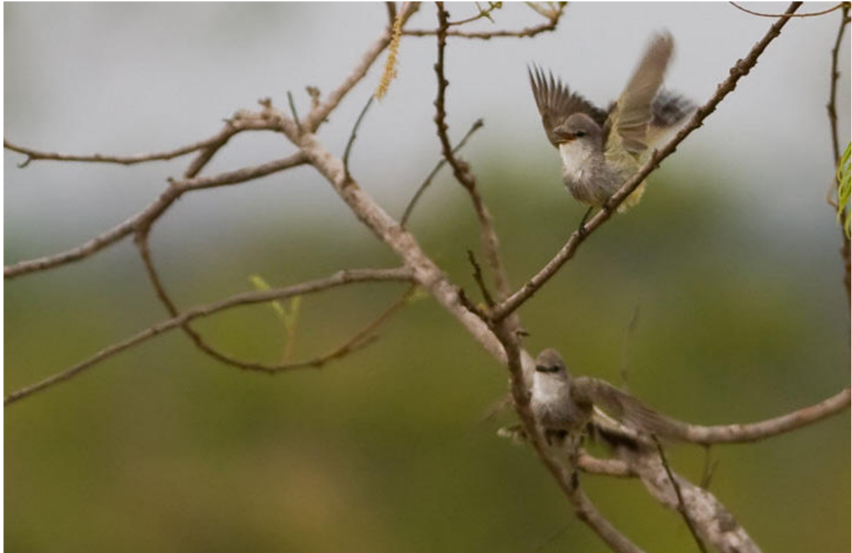
Spelsjungande Chapada Flycatchers (i svårt fotoljus), Chapada dos Guimarães.