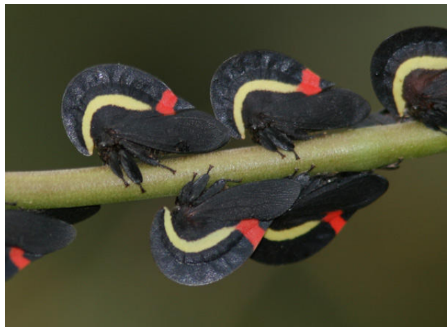
Märkligare typer får man verkligen leta efter – stritar!