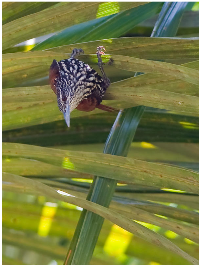
Point-tailed Palmcreeper.

Bland de fåglar vi hann se bör nämnas Chestnut-fronted och Blue-winged (jag lät mig till slut övertalas) Macaws, Mealy Amazon, Bare-necked Fruitcrow och Short-tailed Hawk. Snart var vi på väg längs den något skumpiga vägen till Río Teles Pires i sällskap av lodgens duktige fågelkännare Jorge och några fler. Vi stannade vid ett enda tillfälle för att i ett bestånd av Mauritiapalmer leta upp den läckra Point-tailed Palmcreeper och Sulphury Flycatcher. Det hela gick tämligen problemfritt och över våra huvuden flög två Black Hawk-Eagles som bonus. Klockan var nu så pass mycket att vi tyvärr inte hann skåda i några skogsmiljöer på denna sidan Teles Pires. Väl framme hoppade vi istället direkt i båten, korsade floden och körde sakta uppför den vackra Río Cristalino . Våra första fågelmöten inkluderade Pied Lapwing, Short-tailed Swift, Paradise Jacamar, Swallow-wing, Drab Water-Tyrant, Spangled Cotinga och flera välbekanta våtmarksfåglar från Pantanal. Vi anlände till Cristalino Lodge mitt på dagen, inkvarterades i enkla rum och bjöds snart på en första utmärkt god och riklig lunch.