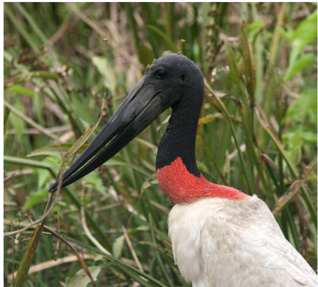
Jabiru – en väldig stork med en enorm näbb!

Yellow-billed Terns sågs fint medan en flock vadare (troligen vitgumpsnäppor) tyvärr försvann innan vi fått tuben på dem. Det var lite svårt att slita sig från dessa fågelrika vidder men solen sjönk obönhörligt allt lägre. Ett sista stopp på vägen mot Porto Jofre gav White-tailed Hawk och Yellow-browed Tyrant. I skymningen nådde vi den lilla byn vid Cuiabáflodens strand. Över floden flög Black Skimmers, mängder med fladdermöss och några Band-tailed Nighthawks, bredvid floden en och annan mygga. Aini försökte förgäves skaffa fram en spotlight men vi fick som sagt klara oss ändå. Någon Pauraque satt på vägen då och då men däggdjur var det tomt på tills vi efter en dryg halvtimme plötsligt såg något stort komma gående på vägen. Katt!?! JA! Men vilken art? Ozelot trodde Samuel, jaguar hoppades andra. När katten kommit skapligt nära vände den sig mot det högra diket varefter det utbrasts PUMA! i kör. Några sekunder senare var den sällsynta uppenbarelsen borta. Detta var sannerligen tursamt, det går 5–10 jaguarobservationer på en puma i Pantanal! Vi var tillbaka vid lodgen vid 20.30, fick åter en utmärkt middag och kunde efter den långgrandiga artgenomgången summera 173 arter för dagen. Fantastiskt fint!