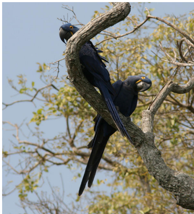
Härliga Hyacinth Macaws vid Jaguar Lodge.