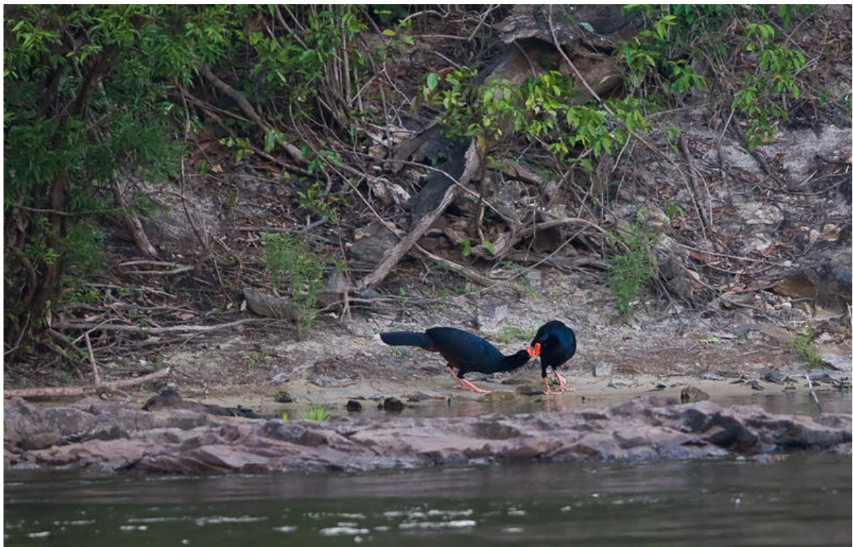
Razor-billed Curassows.