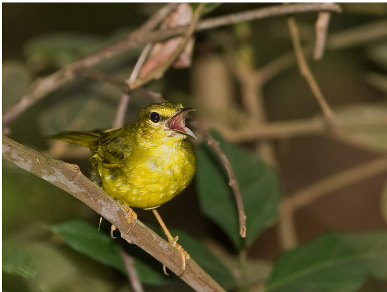
Flavescent Warbler, Emas.