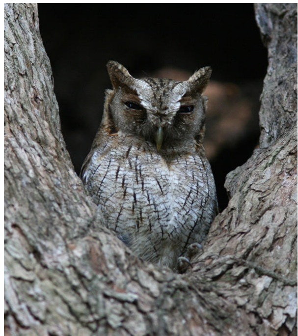
Tropical Screech-Owl, Arancuã Lodge.

Vi åt fukost vid 05.30 och redan då var fågelkören i full gång! I trädgården observerades bland andra Hyacinth Macaw på närhåll, Blue-fronted Amazon, Canary-winged Parakeet, Rufous Hornero, Purplish Jay och Sayaca Tanager innan vi gav oss ut på morgonens promenad i omgivningarna. Snart hade vi fullt upp med att beskåda Whistling Heron, Chaco Chachalacas en masse , Chestnut-bellied Guan, Long-tailed Ground-Dove, Blue-crowned Parakeet, Ash-colored och Guira Cuckoos, Rufous-tailed Jacamar, Toco Toucan, Chestnut-eared Aracari, Great Rufous och Narrow-billed Woodcreepers, White-rumped Monjita, Rufous Casiornis, Masked Gnatcatcher och många fler. Vid 8-tiden gav vi oss in i galleriskogen där vi sakta skred fram och spanade efter minsta rörelse. Med hjälp av playback gavs utmärkta obsar av White-lore Spinetail, Planalto Woodcreeper, Red-billed Scythebill och Mato Grosso Antbird medan några Rusty-fronted Tody-Flycatchers vållade allmän huvudbry. En Tropical Screech-Owl var ett särskilt trevligt och oväntat fynd och ett par mer rörliga Pale-crested Woodpeckers sågs bra av de flesta. Vid 11-tiden var vi åter på lodgen och tog nu siesta eftersom temperaturen redan var uppemot 35 grader. Det spanades och fotograferades i trädgården, åts lunch, badades i poolen och vilades i rummen. Först halv fyra hoppade vi in i minibussen för en kilometers transport till Ríó Clarinho där två små båtar stod