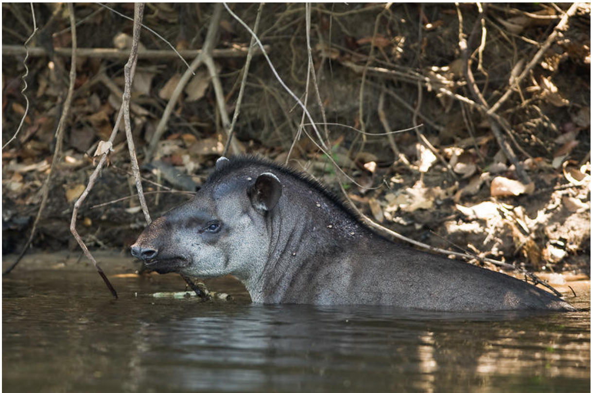
Ovanligt orädd tapir!