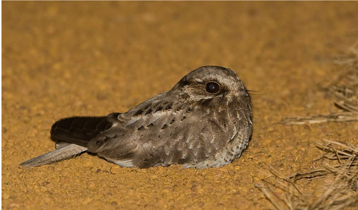
Suverän hane av White-winged Nightjar!