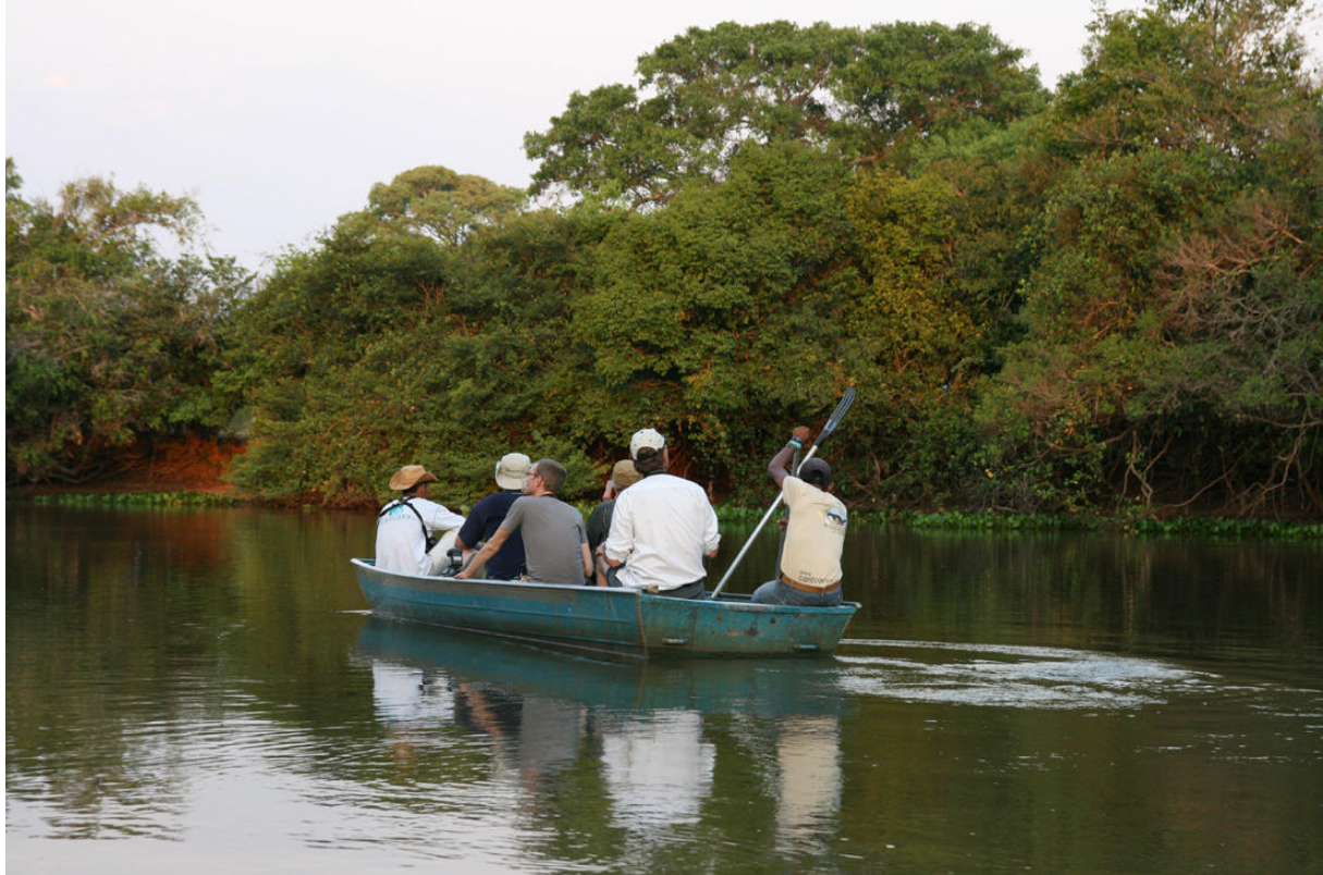
En mycket givande båttur på Río Clarinho.

till vårt förfogande. Det blev en rofylld och synnerligen lyckad kvällstur på floden, i stort sett alla tänkbara specialarter hängdes in: Agami och Boat-billed Herons, Sungrebe, Sunbittern, Green-and-rufous (kanonobsar!) och Pygmy Kingfishers, Band-tailed Nighthawk, Pale-legged Hornero, Rusty-backed Spinetail, Band-tailed Antbird och jätteutter! Dessutom fick vi fina studier av vanligare fåglar som Striated Heron, Anhinga, Black-collared Hawk, Great Antshrike och Yellow-billed Cardinal. Vi vandrade tillbaks till lodgen under månens sken och lyssnade in Rufous, Spot-tailed och Little Nightjars samt en Common Potoo på långt avstånd. 148 arter noterades under dagen – vilken fin start!