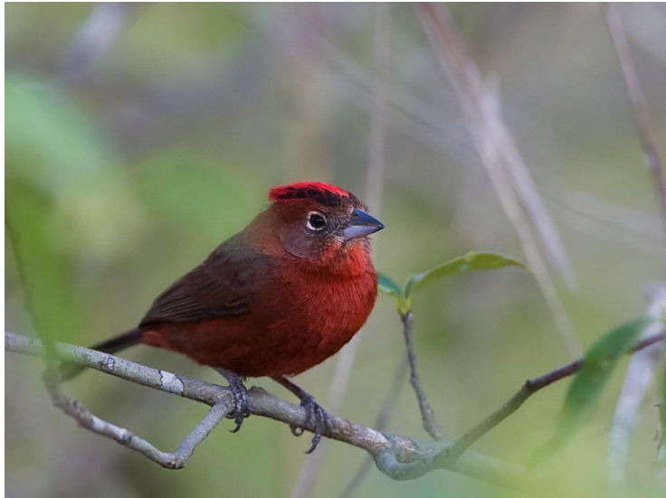
Red Pileated-Finch, Pantanal.