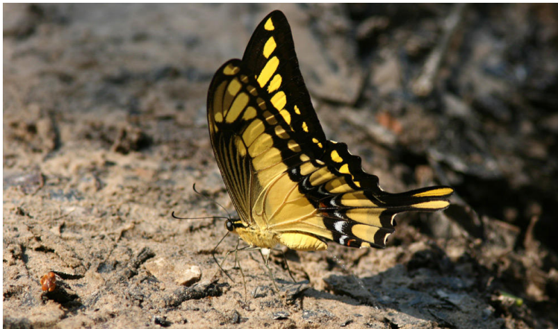
Thoas Swallowtail, en av många vackra fjärilar vid Cristalino.