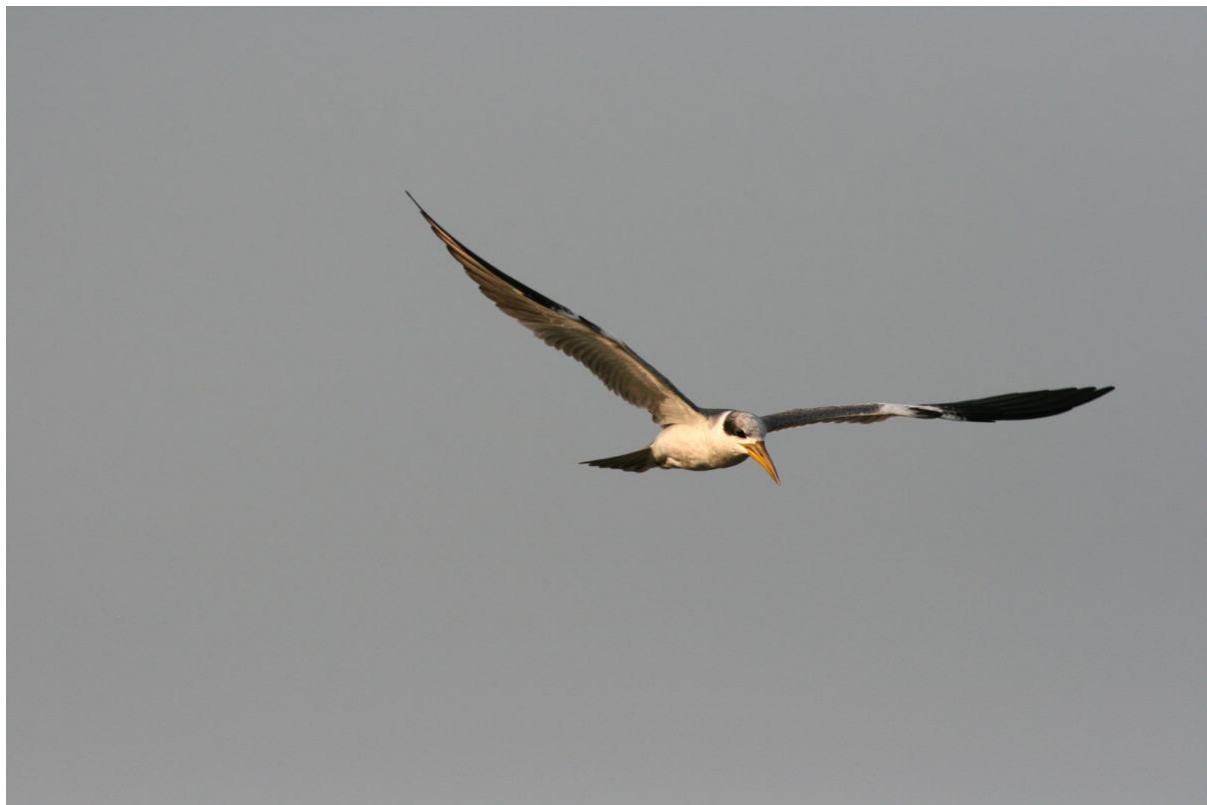
Large-billed Tern, Campo Jofre.