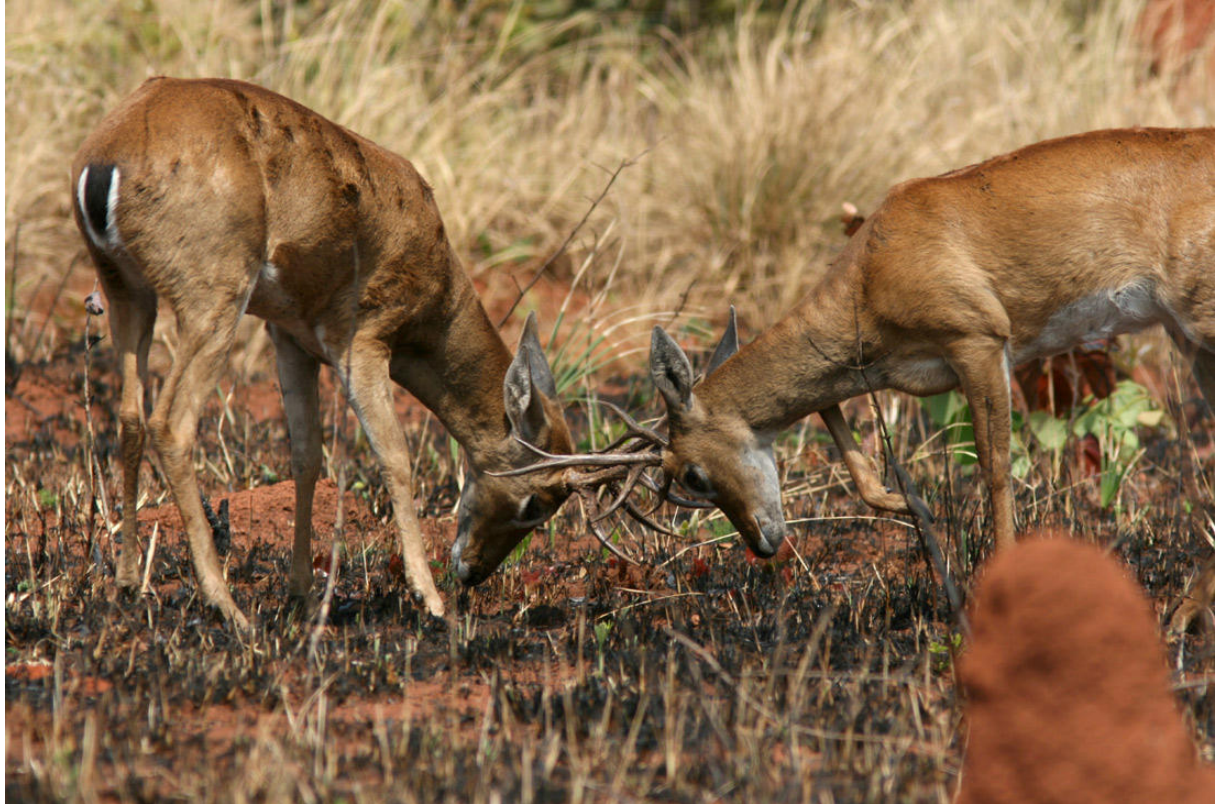
Två bockar av Pampas Deer i en något dämpad styrkemätning, Emas.