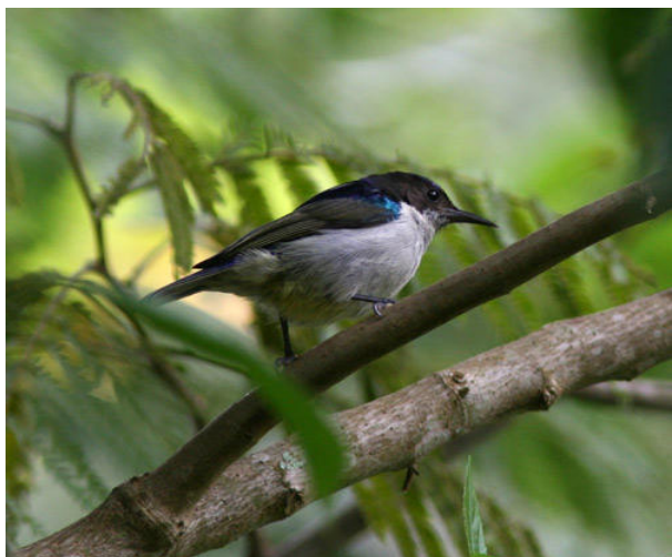
Uluguru Violet-backed Sunbird, Amani.

Vi gav oss ut på vår första skådarrunda vid 06.30 och rörde oss i byns utkanter. Silvery-cheeked Hornbills visade sig vara mycket vanlig, Green Barbets sjöng sin enformigt stötiga sång, en African Goshawk flög lockande förbi och ett blomligt snår visade sig vara utmärkt för solfåglar; Banded (hona), Uluguru Violet-backed, Collared och Eastern Olive Sunbirds kunde snabbt adderas till listan! Green-headed Oriole stod sedan på menyn liksom Brown-hooded Kingfisher, African Green-Pigeon och White-browed Robin-Chat. Frukost fick vi vid 9-tiden. Sedan gav vi oss ut på en skogsväg för att leta upp nya trevligheter. Till en början var det väldigt tyst, mörka moln hotade och släppte även ifrån sig lite regn, men sedan stötte vi på ett par