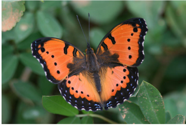
En av många vackra fjärilar vid Amani.

läckra Fischer's Turacos och en blandflock innehållande Yellow-streaked och Stripe-cheeked Greenbuls, Yellow-throated Woodland-Warbler, Square-tailed Drongo, Forest Weaver och mer Uluguru Violet-backed Sunbirds. Ett par läckra Crowned Hawk-Eagles avrundade förmiddagens skådarinsats. På eftermiddagen fick vi hjälp av den lokale fågelguiden Martin Joho som visade sig vara mycket duktig, och vi kunde bland annat addera Black-and-white Shrike-Flycatcher, Southern Black Flycatcher, Purple-banded Sunbird och Cabanis's Bunting till listan. Våra försök att hitta den mycket sällsynta Long-billed Tailorbird misslyckades dock, så Martin anlätades