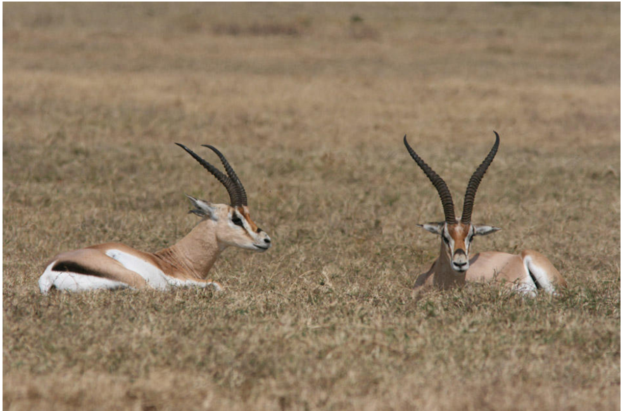
Grant's Gazelles, Ngorongoro Crater.

Banded Martins som en översomrande ladasvala. Innan vi lämnade kratern fick vi se flera lejon på ganska nära håll samt en grupp med Hartebeests. Det spanades efter Secretarybird in i det sista, dessvärre med negativt resultat. Ngorongoro Crater var en annars en synnerligen positiv och fin upplevelse! På tillbakavägen till Manyara stannade vi till vid Rift Valleys förkastningsbrant för att fotografera utsikten och njuta en sista gång av de ofantliga mängderna Lesser Flamingo. Gissningsvis kan det ha rört sig om 200 000 individer, kanske fler! Den östafrikanska populationens numerär minskar men torde ändå kunna ligga i trakten av 1,5 miljoner fåglar. Efter kvällens artgenomgång kunde dagslistan summeras till 109 fågelarter, den näst högsta siffran under resan.