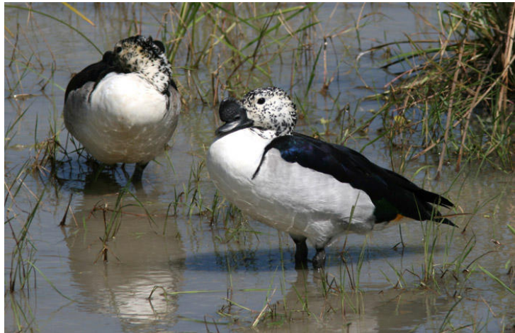
Comb Ducks, Mikumi NP.

Vi åkte ut tidigare än normalt för att snart efter gryningen vara på plats i miomboskogen strax utanför parken. Området har på senare år ockuperats av militären, och för att undvika trubbel var vi tvungna att lämna området redan 08.30. Lite panikartad skådning med andra ord, himla synd att vi inte kunde stanna längre eftersom aktiviteten var god och många trevliga arter fick lämnas osedda. Vi lyckades under två timmar hitta Brown-headed Parrot, härfågel, Crested Barbet, Red-throated Wryneck, White-breasted Cuckoo-shrike, Kurrichane Thrush, White-headed Black-Chat, Green-capped