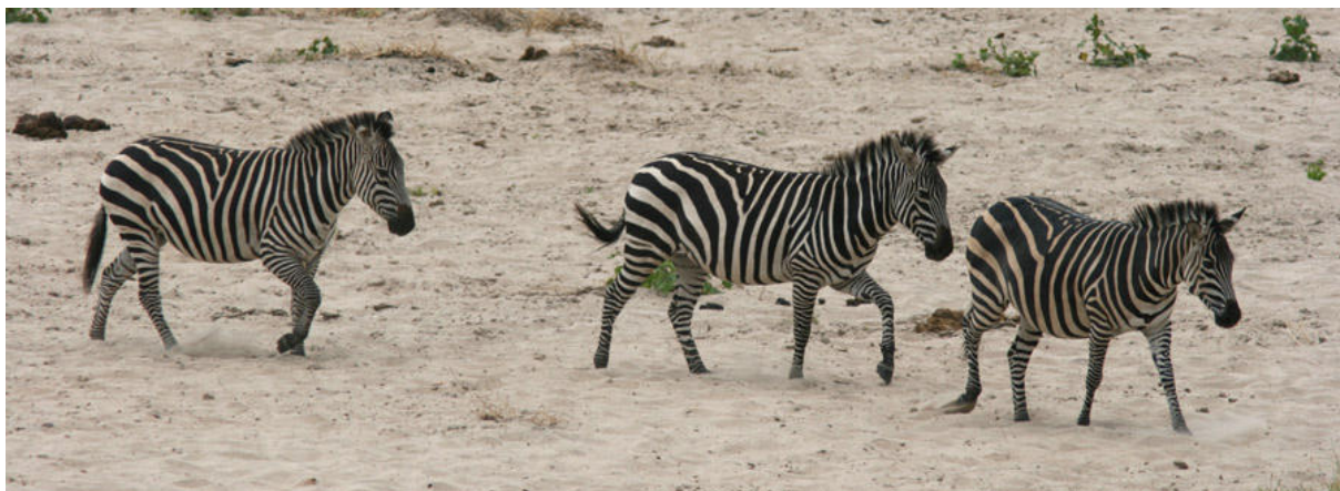
Zebror på väg till floden i Tarangire NP. Nedan: Ashy Starling, endemisk för Tanzania.

började det hända saker. En familj med giraffer underhöll oss på nära håll medan flygande vänner inkluderade Black Sparrowhawk, svartvingad glada, Rufous-naped Lark, White-eyed Slaty-Flycatcher, Trilling Cisticola, Moustached Grass-Warbler, Zebra Waxbill och Black Bishop. Gräsmarkerna vara gröna och frodiga. Vid den första av Momellasjöarna var det i stort sett tomt undantaget fem smådoppingar och 100-tals svalor, medan ett par Bronze Sunbirds var ett fint tillskott i buskarna intill sjön. Sedan blev det dock andra bullar. Bland våtmarksfåglarna noterades 150 Lesser Flamingos, 160 Southern Pochards, 70 Cape och 4 Hottentot Teals, 26 Maccoa Ducks, över 100 smådoppingar, en svarthalsad dopping, Kittlitz's och Three-banded Plovers och, bäst av allt, en hane Greater Painted-Snipe som hittades av Göran. I övrigt kan nämnas Hildebrandt's Francolin och Spot-flanked Barbet. När det var dags för lunch började solen äntligen bryta igenom och värma lite. Eftermiddagen gav Narina Trogon, African Marsh-Harrier, Red-knobbed Coot, rörhöna och smygpunka. Medan Emmanuel ännu en gång bytte däck hade vi chansen att hitta något "utanför bilen", men skogen var tyst. Åtminstone kunde den som ville fotografera flera olika fjärilar. Vid 16.30 lämnade vi parken och återvände till Arusha. Efter att ha växlat pengar och besökt en riktig supermarket (det var verkligen på tiden!) var klockan redan 18.30, och snart var även denna dag till ända.