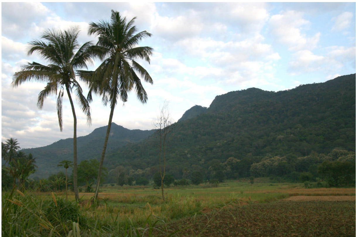
Udzungwa Mountains från Mang'ula.

Det var verkligen skönt med mellandagen vid Ifakara med tanke på att vi skulle upp och streta i bergen igen. Idag gick allt betydligt fortare. Vi kom iväg i ganska hyfsad tid i sällskap av både guide och beväpnad ranger. Stigen mot Campsite 3 visade sig vara betydligt trevligare än den förra stigen. Först gick den genom imponerande men tyst Brachystegia -skog, sedan genom ett öppnare område som uppenbarligen avverkats för att slutligen via ett brant parti nå väldigt fina och högstammiga skogar på 900 meters (?) höjd. På vägen upp såg vi bland annat Narina Trogon, Green-backed Woodpecker, Green-headed Oriole och Uluguru Violet-backed Sunbird men de orörda skogarna var tämligen tysta. Vi korsade en bäck tre gånger under äventyrliga former innan vi åt lunch. Meningen var att vi skulle försöka fullborda en loop på 13 km, men vi insåg att det skulle kräva oavbruten vandring för att hinna ner innan det blev mörkt. Alltså vände vi istället på klacken, trixade oss över de tre bäckpassagerna igen och gick sedan tillbaks nerför bergssidan i maktig takt. Höjdpunkter under eftermiddagen var Livingstone's Turaco, Golden-tailed Woodpecker, Waller's Starling, African Yellow Warbler samt mängder med vackra fjärilar. Trötta men ganska så nöjda var vi åter på hotellet någon gång framåt 17.30. Många fåglar fick lämnas osedda, men vi fick ändå se en del trevliga saker i Udzungwabergen.