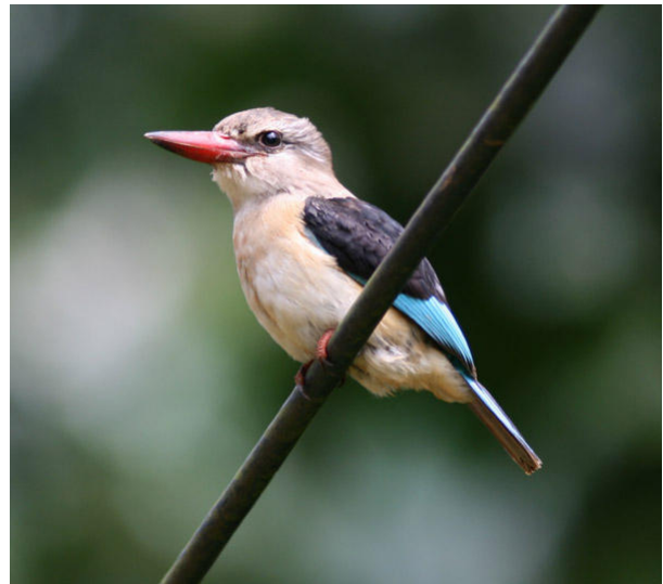
Brown-hooded Kingfisher, Amani.