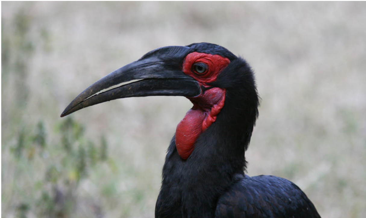
Närkontakt med Southern Ground-Hornbill, Lake Manyara. Kolla in ögonfransarna!

morgonen, men det var väldigt trevligt ändå. Bästa nytillskottet var ett par Greater Painted-Snipes! Det sågs även Black Egret, purpurhäger och 250 vadarsvalor. Vi lämnade parken vid 18.05 med en dagslista på 125 arter = bästa dagen på hela resan!