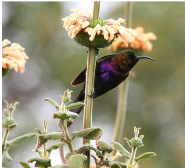
Den suveräna Tacazze Sunbird i skapligt ljus.