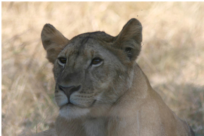
Lejonhona i Mikumi NP.

Eremomela, Cinnamon-breasted Tit, Miombo Blue-eared Starling och Yellow-throated Petronia. Längs med vägen tillbaka till Mikumi fick vi även se en grupp Pale-billed Hornbills. Martial Eagle, flera Bateleurs och en Flappet Lark sågs också innan vi gav oss in i nationalparken. Resten av dagen körde vi runt i öppnare områden i jakt på trevliga fåglar och däggdjur. Bland höjdpunkterna bör nämnas Saddle-billed Stork, Comb Duck, White-headed Vulture, ett hundratal White-backed Vultures vid ett stinkande flodhästkadaver, Dickinson's Kestrel, Red-necked Francolin, Collared Pratincoles och Water Thick-knees i goda antal, Southern Ground-Hornbill, Purple-crested Turaco, Hippo, elefant, giraff, gnu, zebra, impala och vårtsvin. Sammantaget en mycket trevlig dag!