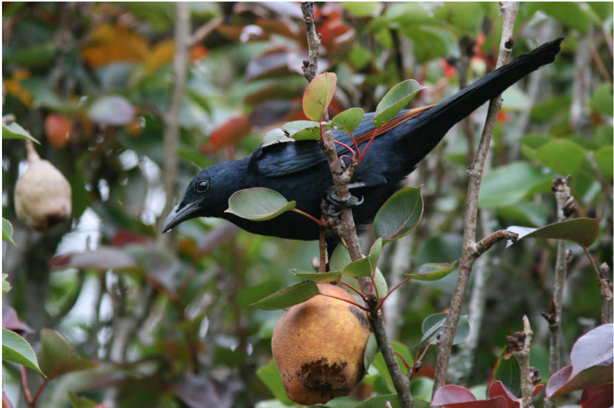
Red-winged Blackbird vid Muller's Mountain Lodge, West Usambaras.