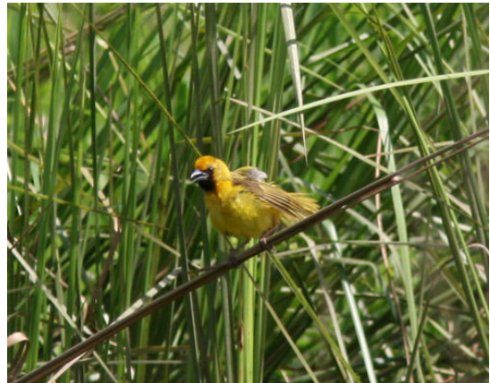
Kilombero Weaver. Nedan: Kilombero Plains.