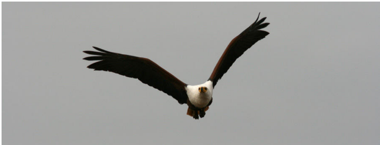
African Fish-Eagle vid Lake Manyara.

Idag skulle vi besöka närbelägna Lake Manyara NP , och vi var på plats vid grindarna klockan 07.00. Som på flera lokaler tidigare under resan var det rätt dålig fart så här tidigt, men efter hand blev aktiviteten bättre. Pallid Honeyguide och African Green-Pigeon sågs i anslutning till den berömda grundvattenskogen. I akaciasavannen sågs sedan åter elefanter, vårtsvin och impalas. Nere vid sjön fanns det mängder med fågel och ett rätt stort gäng flodhästar. Synd bara att vi inte fick gå ut ur bilen! Yellow-billed och Marabou Storks fanns i mängder, och bland många översomrande fåglar såg vi hela 200 gluttnäppor, 18 dammsnäppor, 30 ex. vardera av små- och spovsnäppa samt 300 vitvingade tärnor i en härlig flock! African Fish-Eagles rörde om i grytan regelbundet. Bland de lokala våtmarksfåglarna sågs även arter som Long-toed Lapwing, Collared Pratincole och Three-banded Plover.