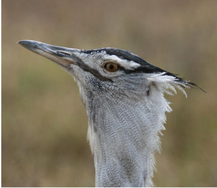
Kori Bustard, Ngorongoro Crater.