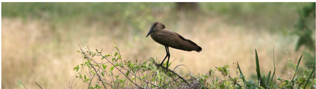
Hamerkop vid Umba River.