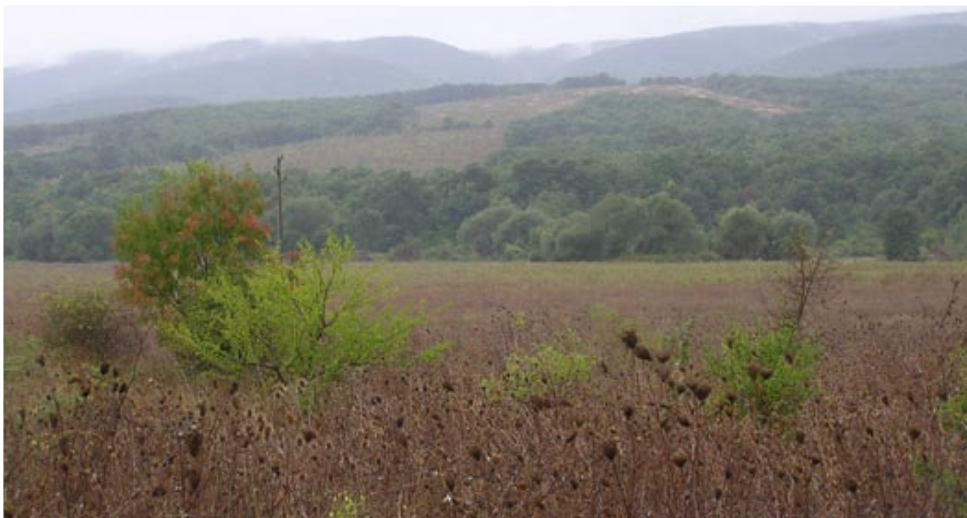
Naturresevatet Iracl bjergene nordøst for Burgas.

Musvåge: 1, Aftenfalk: 1, Lærkefalk: 1, Engsnarre: 1, Lille flagspætte: 1, Ringdue: 2, Rødhals: 1, Rødstjert: 5, Bynkefugl: 10, Sangdrossel: 15, Solsort: 6, Havesanger: 1, Munk: 25, Gærdesanger: 1, Gransanger: 1, Løvsanger: 5, Lille fluesnapper: 2, Blåmejse: 5, Musvit: 3, Rødrygget tornskade: 6, Skovskade: 5, Bogfinke: 25, Kernebider: 5, Gulspurv: 1