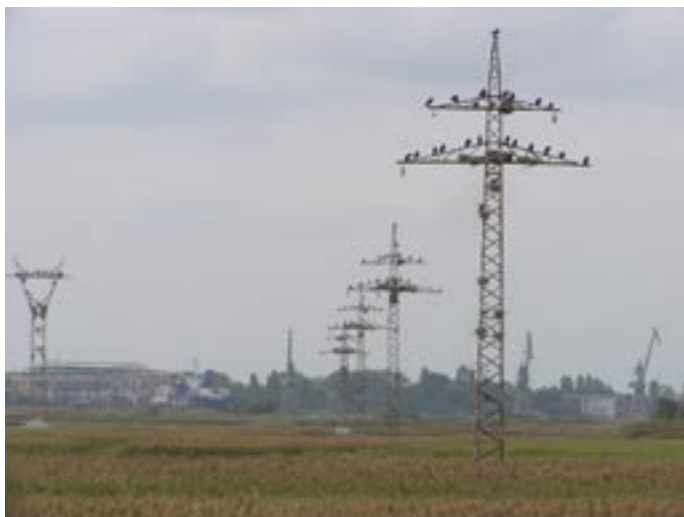
Poda. Fuglereservat lidt uden for Burgas.