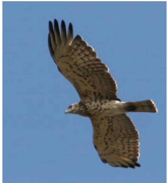
Slangeørn. Så dagligt i pæne antal. I alt sås 184 trækkende forbi i løbet af ugen.