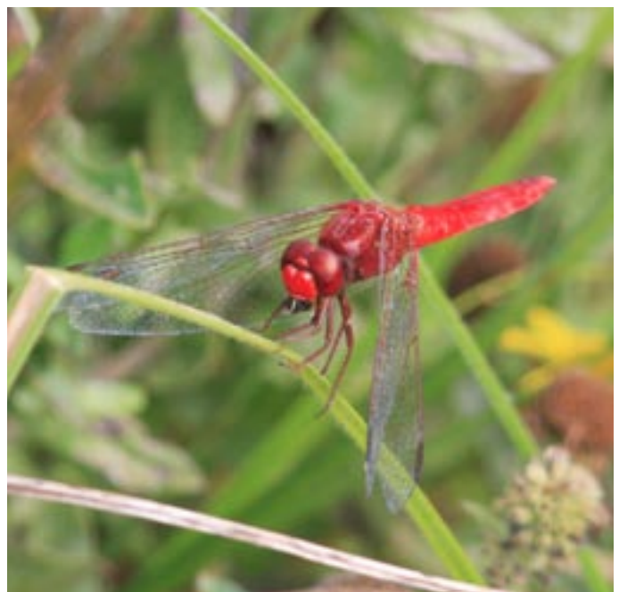
Smuk rød guldsmed