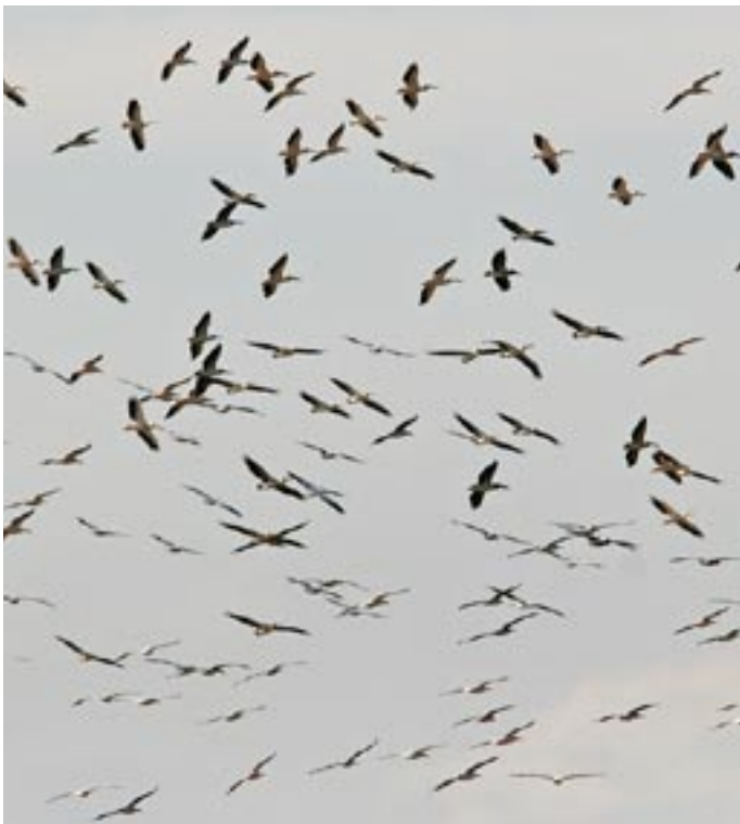
Almindelige pelikaner - op til 5.000 sås rastende fra obs pladsen.

Træk: Hvid stork: 10, Sort stork: 319, Ådselsgrib: 1 imm., Fiskeørn: 3, Lille skrigeørn: 1.398, Slangeørn 53, Dværgørn: 24, Sort glente: 2, Rørhøg: 48, Hedehøg: 2, Steppehøg: 2 han og 3 1k, Hede/steppehøg: 6, Musvåge: 137, Hvepsevåge: 1 ad og 11 1k, Spurvehøg: 3, Balkanhøg: 45, Tårnfalk: 7, Aftenfalk: 12, Lærkefalk: 11, Storfalk sp: 1, Biæder: 50, Klippesvale: 1 (Jens Kristian Kjærgård og Bjarne Nielsen), Rødstrubet piber: 5,