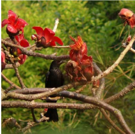
Kapocktree och en drongo

När vi hämtat våra väskor var det dags att äntra färjan och åka till HongKong för vidare transport till Mai Po. Överfarten gav inte så mycket mer än några simsnäppor. Strax utanför HongKong finns en ö där vanligtvis white bellied seaeagle brukar vistas. Även nu fanns den där men sågs inte av alla tyvärr. Dock fanns det istället massor av brunglador.