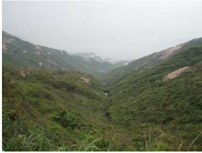
natur vid cape d Agiullar