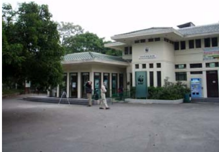
WWF centrat i Mai Po och 2 Kåsebergaskådare

Rörhöns ( Gallinula chloropus ) fanns i varje damm och här hördes och sågs prinior hela tiden. Överflygande blackfaced spoonbill ( Platalea minor ) och en vanlig spoonbill ( Platalea leucorodia ). Här fanns också den stora white breasted waterhen. ( Amaurornis phoenicurus ) Fina obsar av longtailed shrike.