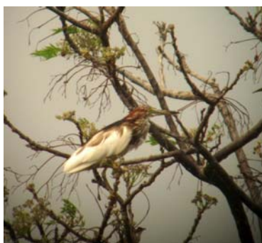
Chinese pond heron