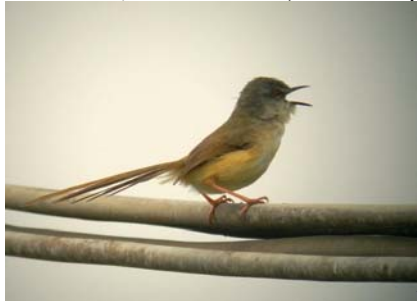
yellow bellied prinia

Längre bort över en damm svävade minst 150 orientalvadarvalor (Oriental pratincole, Glareola maldivarum ) (räknades av andra till 183 rastande). En fantastisk syn. Överallt fanns rödstrupiga piplärkor ( Anthus cervinus ) i olika dräkter alltifrån vinter till full sommardräkt. en eastern marsh herrier ( Circus splinonotus ) cirklade över dammarna, collared crow ( Corvus torquatus ) visade upp sig. Var man vände sig fanns det fåglar.