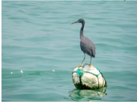
Pacific reef egret

Väl ute på ön var det dax att hitta någonstans att sova. Detta var inte speciellt svårt. Nere vid färjeläget finns ett antal små stånd där man hyr ut rum. Man kan bläddra i en pärm och få en bild av hur rummet ser ut. Rummen ser trevliga ut och är billiga 150-200 HK$/natt. I verkligheten är rummen inte fullt så trevliga. Men det fanns dusch och toalett. Däremot saknades lakan. Men vi skulle ju bara sova där så det fick duga.