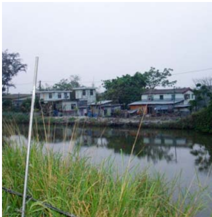
Bakom husen börjar mangroveskogen i Mai Po

Idag var det dax att lämna Mai Po för att studera urban miljö i Hong Kong. Vi tog in på KFUM:s hotell ( 600HK$ /person och natt) i centrala och moderna Hong Kong. Staden är värd ett besök och den moderna arkitekturen är spännande men väldigt ovanlig för oss.. Efter att ha installerat oss åkte vi ,äter med taxi, till sydvästra delen av HongKong ön Udden heter Cape d'Agiullar. Vid sydvästliga eller sydliga stormar kommer mycket sjöfågel in . Denna dag var tyvärr inte väderläget sådant så vi fick nöja oss med småfåglar som whamei ( Garrulax canorus ), ashy drongo ( Dircurus leucophaeus ), och så fick SSV resans kryss när han som hastigast fick se en rubinnäktergal (Siberian rubythroat Luscinia calliope ) poppa upp från buskarna, Tyvärr hann inte de andra med innan fågeln åter var borta. Efter detta besökte vi turistorten Stanley som låg i närheten. Här finns en marknad där man kan köpa de souvenirer och presenter som skall tas hem. Priserna är lägre än i HongKong. Huruvida grejorna är märkesäkta eller inte kan diskuteras.