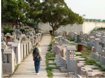
Gustav letar rarrisar ipå kyrkogården

laughing trush ( Garrulax sannio ) visade fint upp sig och även en stor blue whistling trush ( Myophonus caeruleus ) bjöd på show. I en vik längs med den cementerade gångstigen kom så en av dagens fullträffar. En daurian redstart ( Phoenicurus aureus ) hane satte sig på fint fotoavstånd och lät sig väl beskådas och fotograferas. Nästa knallob var en narcissus flycatcher ( Ficedula narcissina ) som satt på en gravsten. På ena höjden på ön finns en stor begravningsplats och sådana är naturligtvis alltid intressanta både som kultur- och naturplats. Här såg vi en hel del starar bl.a. red-billed starling ( Sturnus sericeus ), white-shouldered starling ( Sturnus sinensis ). En longtailed shrike ( Lanius schach ) skymtade till, en art som vi skulle få se mer av senare på resan. Ytterligare arter var black drongo ( Dicrurus macrocercus ), sprangeled drongo ( Dicrurus hottentottus ), stubbstjärtseglare ( Apus affinis ), plain prinia ( Prinia inornata ) och yellow-bellied prinia ( Prinia flavivetris ), blue and white flycatcher ( Cyanoptila cyanomelana ).