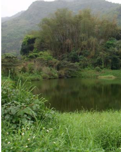
som ur en asiatisk saga

På den Hong Kongska östkusten ligger Starling Inlet som är mest känt för sina hägerkolonier. Vi bad taxin stanna vid ett tempel som låg vackert vid den spegelblanka viken med utsikt över en ö full med alla sorters hägrar. Landskapet är kuperat med ganska höga berg och crested serpent eagle ( Spinornis cheela ) svävade längs bergssluttningarna. Dalarna är till stor del odlingslandskap och här trivs munia, både scaly-breasted och whiterumped munia ( Lonchura striata ), liksom svarthakad buskskvätta och longtailed shrike