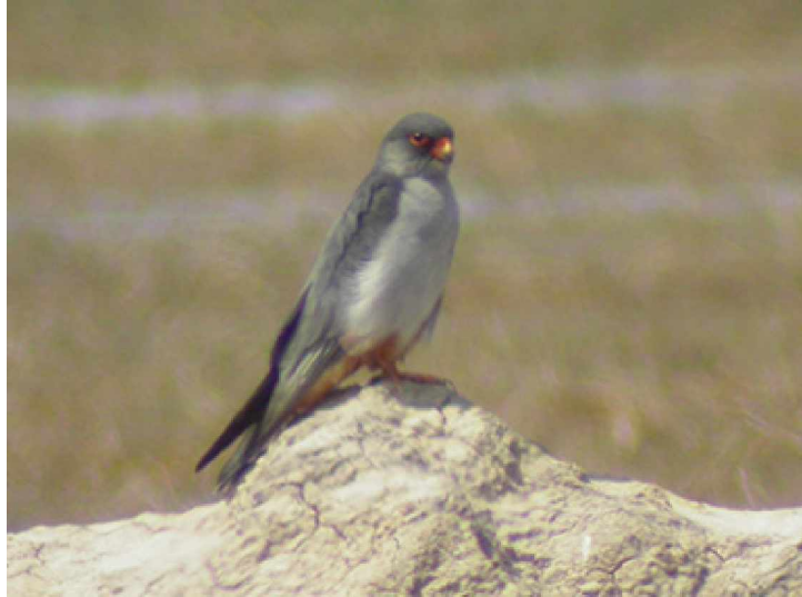
Amurfalk Falco amurensis