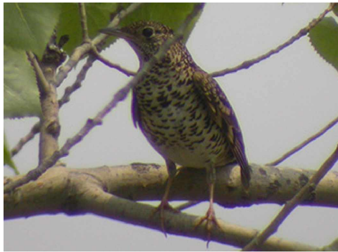
Guldtrast Zosterops dauma

13 maj Tidig morgon anlände vi till Qinhuangdao för att direkt ge oss iväg söderut för en vecka på Happy Island. Innan hann vi dock med ett besök vid Magic wood för ett par timmars skådning. En drillnäktergal hittades och kunde beskådas helt öppet på bara några meters håll. Några rubinnäktergalor och blånäktergalor sågs i dungarna. En sibirisk trast sågs lite flyktigt och även några guldtrastar. Liksom vid vårt besök en vecka tidigare var det kungsfågelsångare som dominerade bland sångarna. Några träksångare stöttes och ett par tjocknäbbade sångare kunde även ses. Några upptäckte en kinatrast, men tyvärr drog ett regnväder in och skådningen fick tyvärr läggas ner. Vi for vidare till hamnen varifrån båtarna utgår till Happy Island, där lunch intogs medan regnet vräkte ner. Regnskuren upphörde efter en stund och båten äntrades för färd ut till ön. Vi hann bara ombord innan nästa oväder drog över oss och nu var det ett rejält åskväder som hade kommit in. Ovädret fortsatte resten av kvällen och någon skådning blev ej av denna första dag på Happy Island.