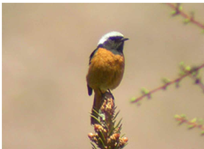
Svartryggad rödstjärt Phoenicurus auroreus

24 maj Tidig uppstigning denna morgon, strax innan gryningen för att leta efter mingtrastar, några sjungande fåglar observerades kring hotellet, senare under dagen sågs även en del individer väl i området, bl.a hittades ett bo. I dalen bakom hotellet hördes åtminstone två koklassfasaner ropa, några större hökgökar likaså. I övrigt samma fåglar som under gårdagen. Avfärd från Wulingshan kring lunchtid för transport till Beijing och hotellet vid flygplatsen. Lite skådning på kvällen utanför hotellet gav en del fina observationer på blåskator. Några indiska gökar hördes och sågs likaså.