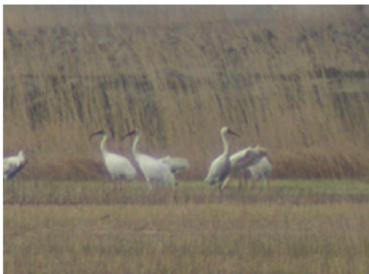
Snötrana Grus leucogeranus

9 maj Dagens färd gick till Momoge reserve i nordvästra delen av Jilin provinsen, dagens målart var snötrana som det fanns goda chanser på i området. Längs vägen till reservatet sågs några klippkajor, bl.a. ett bo. Väl på plats vid en av våtmarkerna och en del tubande hittades en grupp fåglar som misstänktes kunna vara tranor men på mycket långt håll i andra änden av våtmarken. Då vägarna runt ej var farbara fanns bara att börja traska runt för att kolla upp fåglarna. Det var säkert ca fem kilometer enkel väg att avverka, tyvärr blev det bottennapp när vi nådde andra sidan, det var nämligen tamankor som gick och betade. Halvvägs tillbaka fick vi dock napp när snötrana ropades ut, inflygande mot våtmarken. Inte bara en fågel utan en hel flock kom inglidande till allas förtjusning. Ett par minuter senare kom ett annat larm, en flock amurstorkar kom inflygande från samma håll och drog över våra huvud, fantastiska observationer av båda arterna. Lite senare vid en annan våtmark hittades en flock snötrator rastande längs vägen, totalt sågs hela 27 ex under dagen och antalet amurstorkar hamnade på 13. Under dagen observerades även ett 40-tal rastande dvärgspovar, en mindre flock gulkindade krickor och en praktand. En hane svartvit kärnhök visade upp sig fint i kvällssolen och en jätteflock på ett 1000-tal bläsgäss rastade. Då vi blev sena tillbaka till hotellet blev det en övernattnig ytterligare i Baicheng, vi skulle enligt planeringen ha åkt till Xianghai reserve redan denna dag.