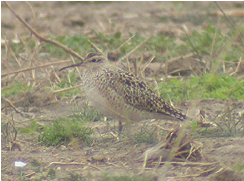
Dvärgspov Numenius minutus