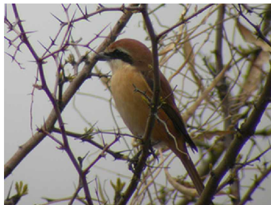
Brun törnskata Lanius cristatus