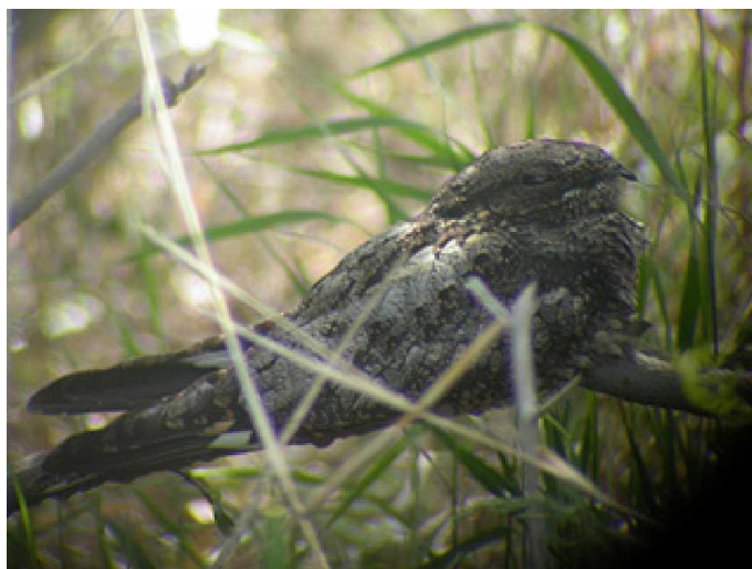
Orientnattskärra Caprimulgus indicus

21 maj Tidig avfärd från hotellet för en halvdag vid kinesiska muren en kortare bilfärd norr om Beidaihe. Längs muren observerades bl.a. rosenpapegojnäbb, nordlig fnittertrast, mongolsparv och ängssparv. En rödnäbbad blåkråka och en lyrdrongo noterades också. I närheten av entre'n till muren sågs rödnäbbade blåskator och en hel del svartnackade gyllingar höll till i samma område. Tillbaka i Beidaihe tidig eftermiddag och ett sista besök vid Reservoiren. I stort sett samma arter som föregående dag. På kvällen middag med Jesper Hornskov med fru tillsammans med några av de övriga skådarna vi lärt känna under vistelsen i Manchuriet och på Happy Island.