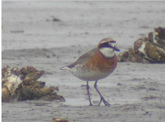
Mongolpipare Charadrius mongolus

och den lilla dungen något söder om templet sågs en tundrapiplärka lite hastigt. I dungen även denna dag en mindre maskstenknäck och båda arterna glasögonfåglar, japansk och brunsidig. Längs vägen till restaurangen upptäckte några holländska skådare en grå drongo. Längs samma väg sågs en svartryggad rödstjärt, vilken blev den enda vi såg på ön. Vi skulle dock få mer av denna art i bergen senare under vår resa. Under dagen hördes och sågs den första taigagöken. Efter lunch drog ett rejält oväder in över ön med kraftigt regn och blåst vilket omöjliggjorde mer skådning denna dag.