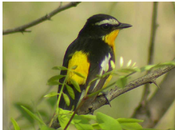
Vitbrynad narcissflugsnappare Ficedula zanthopygia

20 maj Vår sista dag på Happy Island och skådning fram till lunch innan avfärd till fastlandet. En lugn dag vad gäller antalet fåglar, dock en del tjocknäbbade sångare i tempeldungen. En hona elisa flugsnappare upptäcktes på förmiddagen och sågs väl och som numera ska kunna räknas som egen art. Även en hel del videsångare noterades. Några orientnattskärror även denna dag, liksom rödnäbbade blåkråkor. En mongolpiplärka sträckte förbi. På väg till restaurangen vid lunchtid sträckte en tofsbivråk förbi på fint avstånd, en art vi väntat länge på under resans gång. En fläckig smygsångare observerades av en del och en gråkronad bambusångare sågs återigen. Avfärd från Happy Island efter lunch mot fastlandet och direkt norrut mot Beidaihe. Ett stopp vid Yang He gav tre sibiriska gråsnäppor, tre spetsstjärtade snäppor och två sidenhägrar. Väl framme i Beidaihe besökte vi Reservoiren på kvällen och observerade bl.a. en schrencks dvärgrördrom och en del kinesiska dvärgrördromar. Dessutom gott om kinesiska trastsångare samt några svartbrynade rörsångare i vassarna.