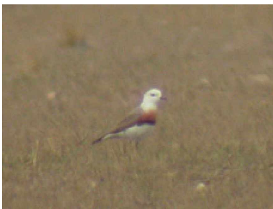
Orientpipare Charadrius veredus

8 maj Tåget anländer kring sju på morgonen till Baicheng där vi kommer att vistas ett par dagar. Vi installerar oss snabbt på hotellet och gör oss i ordning för en heldag ute på stäppen nordöst om staden. En buss ska ta oss en bra bit ut på landsbygden och målartern för dagen är jankowskisparv, en art som alla deltagare saknar på sina listor. Vägarna vi färdades på denna dag var minst sagt av den sämre sorten och både buss och besättning sattes på prov, med andra ord det blev en rejält ”skumpig” färd. Det tycktes vara oändliga områden med stäppliknande biotop vi åkte igenom eller nästan ingen vegetation alls, men en del fågel sågs dock. Vid ett stopp upptäckte några skarpsynta en fågel på långt håll som visade sig vara en orientpipare. Efter en stunds skådande i området kunde ytterligare sex fåglar ses, både hannar och honor som förmodligen rastade i området. Arten var ny för många och bl.a. nytt kinakryss för vår guide Jesper. Vilken start på dagen och det var bara början. Vid samma stopp sågs några amurfalkar, mongolpiplärkor och kinesiska varfåglar. Färden fortsatte till lokalen där jankowskisparv skulle finnas, innan vi var framme hade vi även fått se en del mongollärkor, uppseendeväckande stora lärkor. Väl framme tog vi lite lunch ute i det fria innan vi spred ut