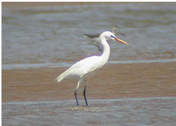
Sidenhäger Egretta eulophotes

7 maj Tidig avfärd ihop med våra danska kollegor och färd söderut för besök på ett par lokaler där dvärgspov brukar kunna ses. Vid första lokalen noterades bara småsparvar, på lokalen dock resans första rubinnäktergal i några träddungar, dessutom tristramparv, gulbrynad sparv, gråhalsad trast och några vittryggiga hackspettar. Vid andra lokalen fick vi efter en kort stunds letande dock träff på spovarna och på lokalen såg vi minst 80 dvärgsparvar, våra danska kollegor såg en bra bit över 100, en fantastisk siffra. En mindre flock sibiriska tundrapipare observerades, en taigabeckasin stöttes liksom några japanska vaktlar. Då det fortfarande fanns tid kvar för skådande innan återfärden åkte vi ned mot det som kallas "Magic wood" inte långt från hamnen där utfärden till Happy Island görs. Längs vägen dit sågs de första amurfalkarna. I de små dungarna vid Magic wood sågs fler rubinnäktergalar, de första blånäktergalarna sågs och en guldtrast visade upp sig fint. Två orientaliska dvärgsparvar sågs. Väldigt gott om kungsfågelsångare som var klart dominerande över taigasångare som var tämligen fåtaliga. En amurstare sågs och det var gott om svarta drongos i omgivningarna, samt en del svartnackade gyllingar. Tidig eftermiddag vände vi åter mot Beidaihe för att direkt färdas vidare till grannstaden Qinhuangdao där vi skulle ta nattåget