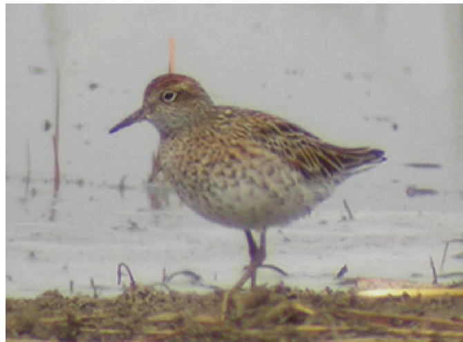
Spetsstjärtad snäppa Calidris acuminata

11 maj Denna dag blev det färd med fem jeepar då vi skulle ta oss lite längre ut i reservatet än dagen innan. Ett första stopp vid en våtmark gav en hel del fågel, mycket var samma som dagen innan men en del nya arter plockades in. Resans första asiatiska beckasinsnäppor observerades, en orietseglare drog över och spetsstjärtad snäppa sågs på närhåll. Likt gårdagen gott om svangäss, några långtåsnäppor, en hona svartvit kärnhök och en praktand. Vid en annan lokal sågs gulkindad kricka, vitögad dykand samt gråhakedopping som enligt Jesper var mycket ovanligt förekommande i området, eventuellt ett förstafynd. Dessutom sågs en hona rallbeckasin väldigt fint och denna gång fick alla se fågeln. Fram på kvällen vid ett sista stopp sågs en mongolpipare och fem fjällgäss som rastade. Andra arter som sågs var salskrake, strandskata och småskrake, välbekanta arter från Sverige men lite udda i Xianghai.