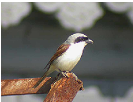
Tigertörnskata Lanius tigrinus

17 maj Ovädret från gårdagen fortsatte hela natten och en bit in på morgonen, sov morgon denna dag med andra ord. På förmiddagen blev det dock äntligen lite skådning och nu var det orderntlig fart på fåglarna i dungen. Mycket trast hade tryckts ned och stöttes överallt, och intressant nog väldigt gott om sibirisk trast, totalt under dagen sågs en bit över 30 stycken, vilket måste vara ett oerhört bra antal av denna skulkare. Även en del guldrastar och gråhalsade trastar observerades, men sibirisk trast var den talrikaste trasten. En hel del mugimakiflugsnappare sågs, även blånäktergalar och drillsångare i goda antal. En hane tigertörnskata sågs bakom templet. En minivett upptäcktes av några skådare, som först troddes vara en långstjärtad minivett, men som efter en stunds observerande bestämdes till en gråkindad minivett. En del smågökar upptäcktes bland alla vanligare gökar som blev allt fler i antal dag för dag. Utanför templet sträckskådades en del under dagen och det var sträckrörelser igång. En del orientseglare räknades in, bland dessa åtta taggstjärtseglare. Omkring 50 rödnäbbade blåkråkor sträckte in, en del av dessa gick ned i dungen och rastade. En tundrapiplärka kom insträckande, och även en reliktmås drog förbi på mycket bra avstånd. En starrsångare sågs i ett dike. Dagen avslutades med ett 100-tal vitvingade tärnor som sträckte över våra huvuden vid stugorna, fantastiskt.