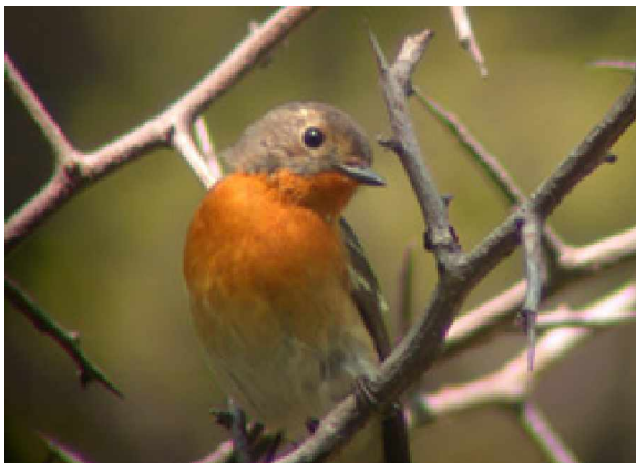
Mugimakiflugsnappare Ficedula mugimaki

19 maj Denna dag blev den riktiga toppdagen under vår vistelse på Happy Island, oerhört mycket rastande fågel överallt i dungarna, gott om trastar men kanske framförallt väldigt mycket flugsnappare. En hel del phylloscopus arter likaså. I tempeldungen gott om sibirisk trast, guldtrast och vitstrupiga stentrastar. I lilla dungen sågs en mingtrast och en amurtrast. Gott om näkergalar, framförallt blånäktergal där säkerligen ett 150-tal räknades in, jämfört med rubinnäktergal där enbart tre noterades. I lilla dungen upptäcktes en blåstjärt, den enda observationen av arten under vår resa. Vid lilla dungen som var riktigt het denna dag sågs även en hane blåvit flugsnappare, en riktig juvel. En hel del mugimakiflusnappare och kinesiska narcissflugsnappare sågs. Träksångare sågs i dungen, några helt öppet på bara ett par meters håll. Några större hökgökar observerades under dagen, även indiska gökar och en del taigagökar. Två orientnattskärror hittades och sågs väl, tre tigertörnsikator och enormt mycket bruna törnsikator. Ingen vadarskådning denna dag, vi hann helt enkelt inte med då det var så mycket fågel i dungarna.