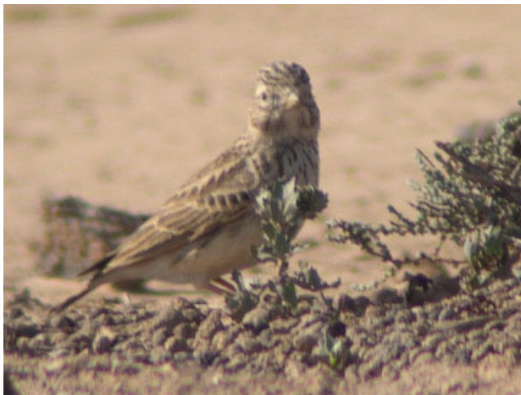
Dvärglärka och ökenstrumpetare.

1 ex hane vid Los Gorriones Hotel vid norra delen av Playa de Sotavento.