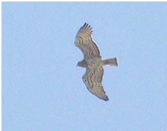
Ormörn vid Tembidalen.

Förmiddagen ägnades åt rovfågelspaning i Tembidalen, en dalgång söder om Olympus längs huvudvägen mellan Tessaloniki och Athen. Intensiv sträckled för bl a aftonfalk. I dalgången sågs 500 aftonfalkar sträckande mot NO i timmen, d v s under våra 3 timmar sågs 1 500 aftonfalkar (bl a en skruv med 100 aftonfalkar). Här sågs även gåsgam, ormörn, dvärgörn och sträckande ängshökar.