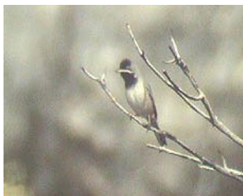
Svarthakad sångare på Parnossos sluttningar.

I sluttningarna intill Apollontemplet rödstrupig sångare, balkanmes, klippnötväcka och häcksparv. I sluttningarna längs Parnossos dalgång svarthakad sångare. Längs vägen upp mot alpina skidcentret på Parnossosberget brandkronad kungsfågel och trädgårdsträdkrypar. Uppe vid skidcentret alpkaja, alpjärnsparv, berglärka, stentrast och klippsparv.