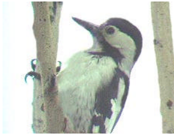
Balkanspett vid Prespasjön.

Vid kustbyn Makrigialos, en kustby söder om Tessaloniki, sågs från hotellbalkongen flockar med svarthuvade måsar och ett antal långnäbbade måsar på väg till sina kolonier i närheten.