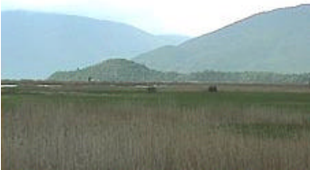
Fågelsjön Mikri Prespa vid Albanska gränsen.

Morgon- och förmiddagstur vid Prespasjön. Komplettering med rallhäger, natthäger, dvärgrördrom, skedstork, skäggtärna och vitvingad tärna. På åkrarna öster om sjön gott om aftonfalk (bl a 30 ex i olika åldrar sittande på en åker). I ett buskparti en balkanspett.