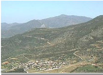
Tembidalen söder om Olympusmassivet.

Förmiddagen ägnades åt rovfågelspaning i Tembidalen, en dalgång söder om Olympus längs huvudvägen mellan Tessaloniki och Athen. Intensiv sträckled för bl a aftonfalk. I dalgången sågs 500 aftonfalkar sträckande mot NO i timmen, d v s under våra 3 timmar sågs 1 500 aftonfalkar (bl a en skruv med 100 aftonfalkar). Här sågs även gåsgam, ormörn, dvärgörn och sträckande ängshökar.