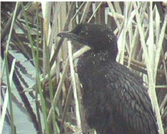
Dvärgskarv vid Prespasjön

Morgon- och förmiddagstur vid Prespasjön. Komplettering med rallhäger, natthäger, dvärgrördrom, skedstork, skäggtärna och vitvingad tärna. På åkrarna öster om sjön gott om aftonfalk (bl a 30 ex i olika åldrar sittande på en åker). I ett buskparti en balkanspett.