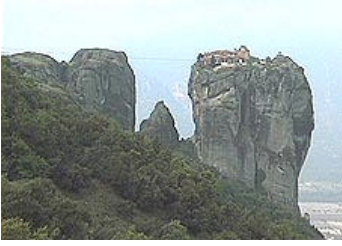
Klippformationerna vid Meteora.

Storslaget landskap vid Meteora med branta klippformationer och frodiga dalgångar. Stenhöna, blåtrast, medelhavsstenskvätta, rödfalk, klippduva, svart stork och smutsgam.