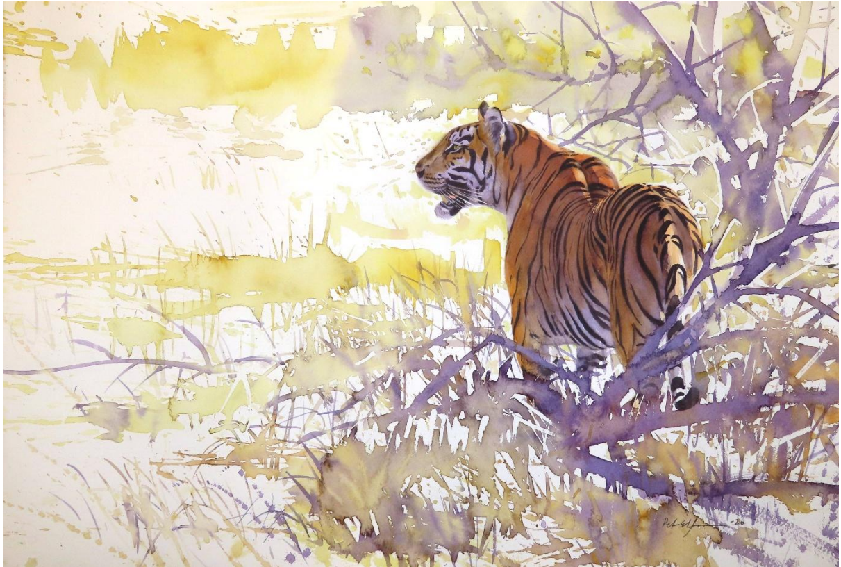
"Beyond the horizon" 58*38cm