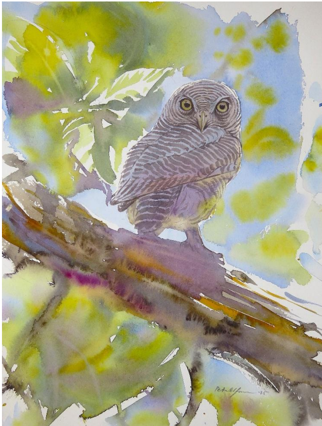
Jungle owlet (akvarell 38*28cm)