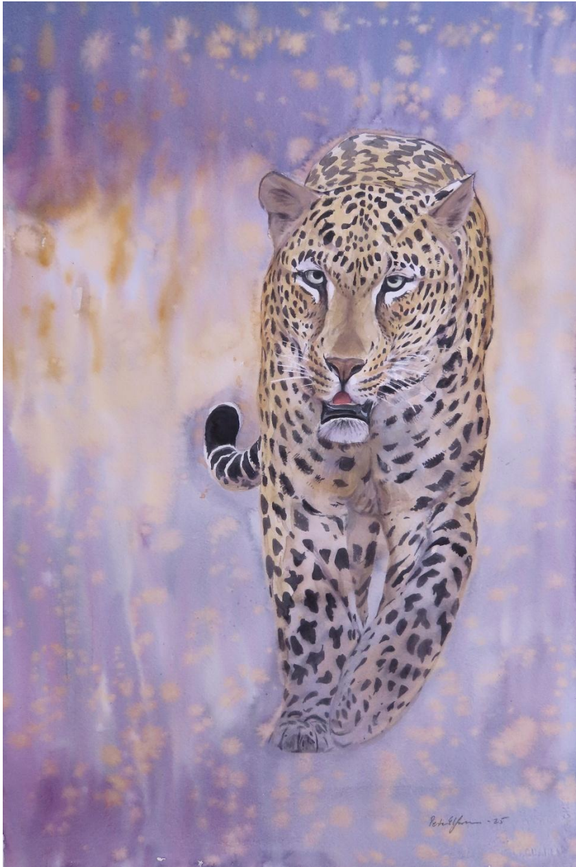
“I walk the line” (akvarell 38*58cm)