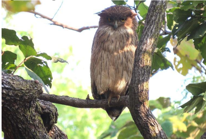
Brown fish-owl, Tadoba