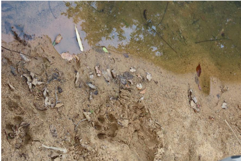
Tigerspår i Tadoba buffer zone