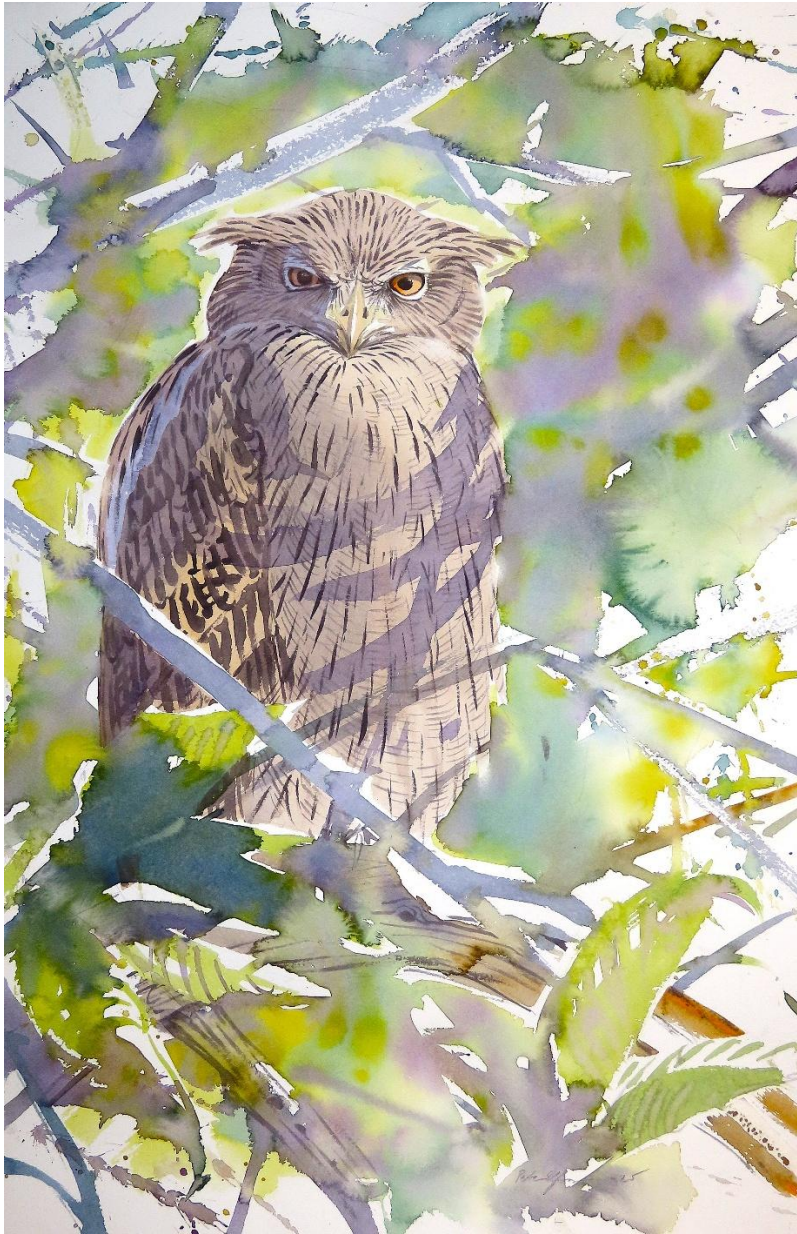
Brown-fish owl (akvarell 38*58cm)