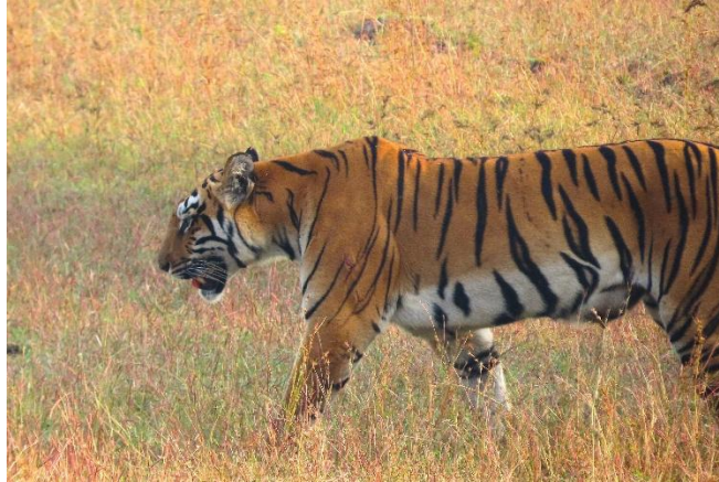
Tigerhonan i gräsmarkerna, Tadoba

Eftermiddagen tillbringas i buffertzonen. Här finns det inte så mycket hjort vilket gör att det är svårt att leta tiger, det saknas varningsrop. Vid en damm ser vi en familj Bronze-winged Jacana och några Gaur helt nära vägen.