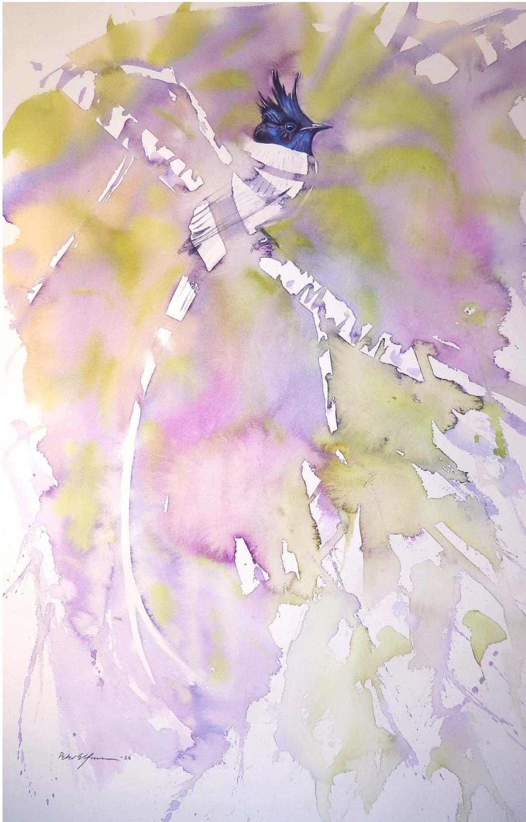
Indisk paradisflugsnaver 38*58cm.