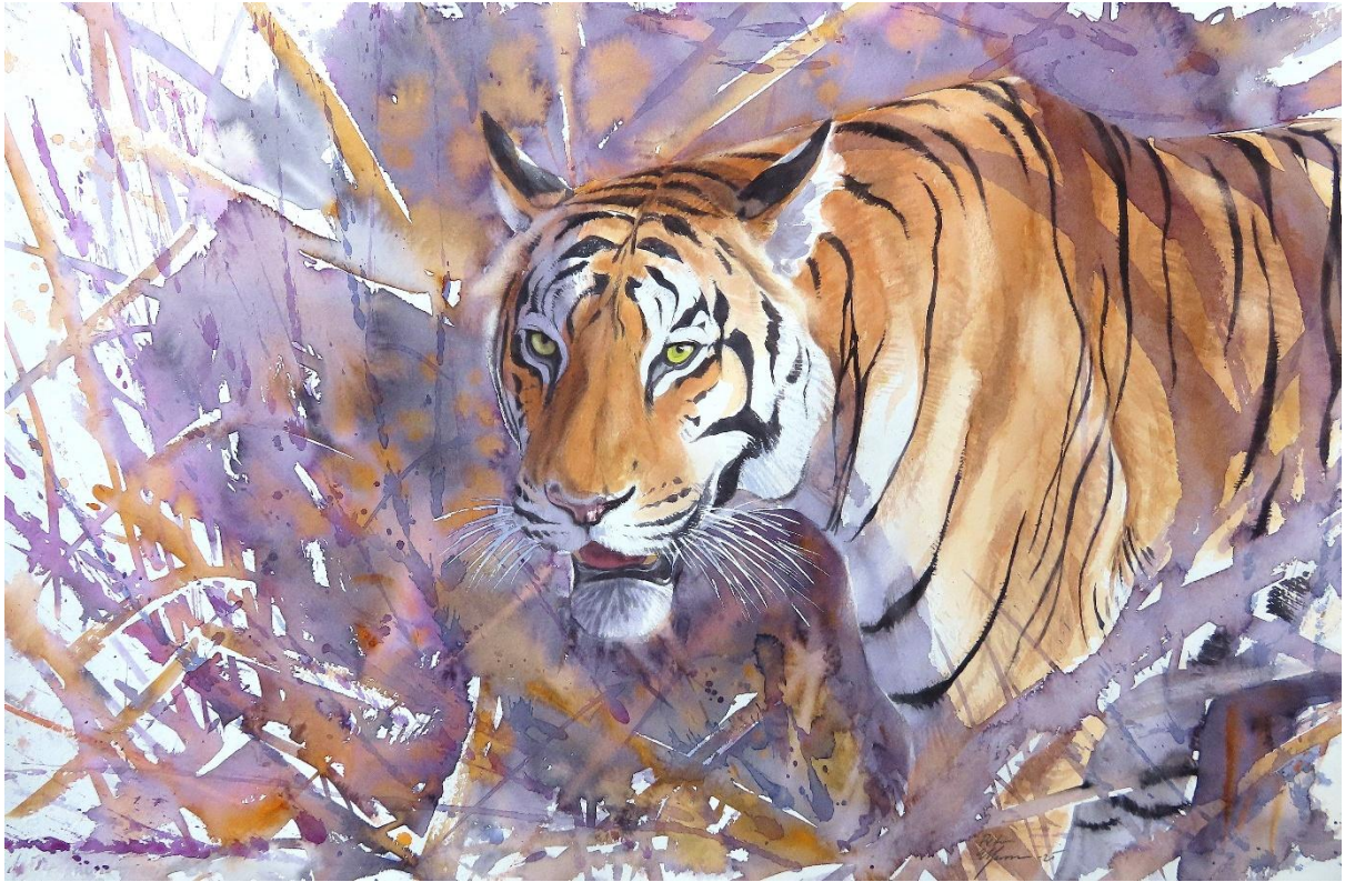
“In the grasslands of Tadoba” (akvarell 58*38cm)