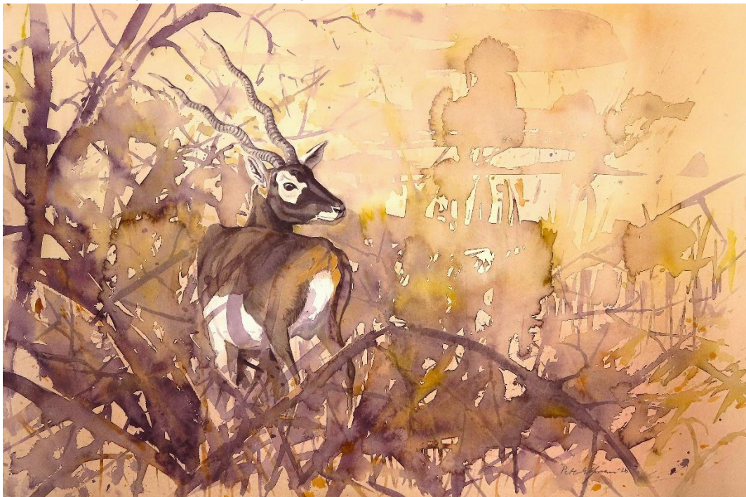
Blackbuck (akvarell 58*38cm)