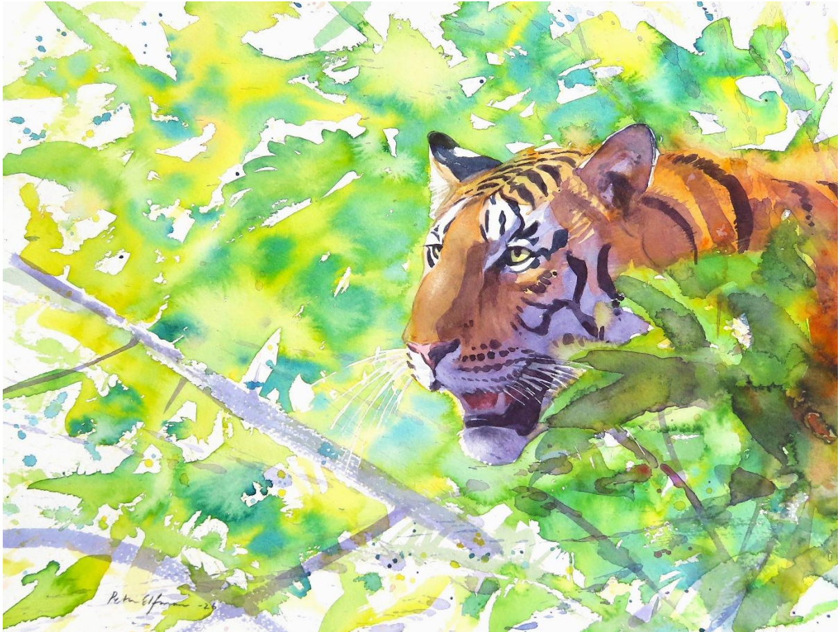
"Greenroom" (akvarell 38*28cm)