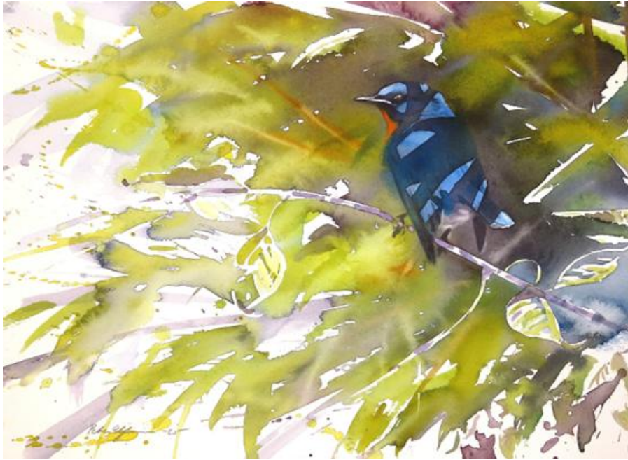
Tickells blue flycatcher (akvarell 38*28cm)