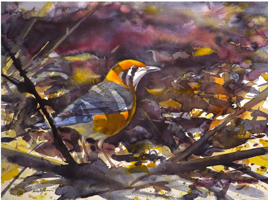
Orange-headed thrush (akvarell 38*28cm)