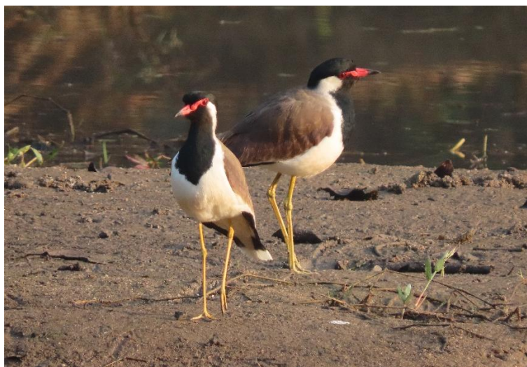
Red-wattled lapwings, Kanha

Eftermiddagen tillbringas inne i nationalparken igen. Nästan direkt ser vi en stor Gaur nära vägen. En Crested Hawk-eagle ses fint samtidigt som en Taiga Flycatcher sitter invid jeepen. Vi hittar en flock med 5 Gaur innan skymningen kommer och det är dags att åka ut ur parken.