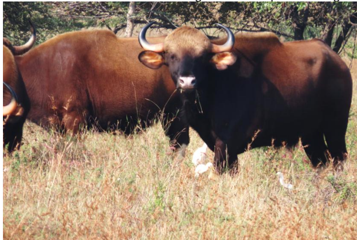
Gaur i Tadoba

I skymningen på väg hem blir det stopp på jeepar då en leopardhane går emot oss på vägen, under några minuter sitter vi som förstenade när den går förbi oss på bara några meters håll.