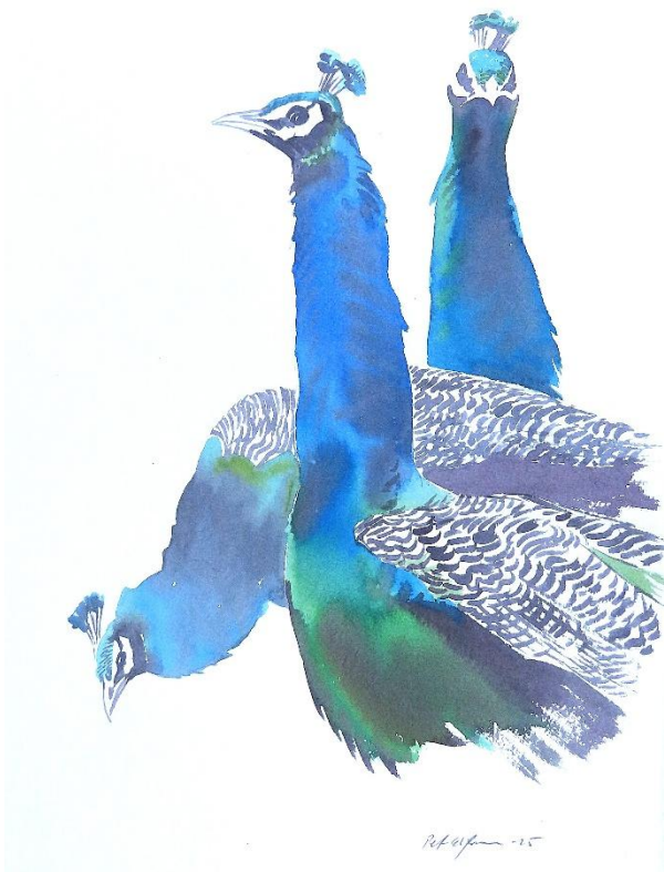
Påfåglar (akvarell 28*38cm)