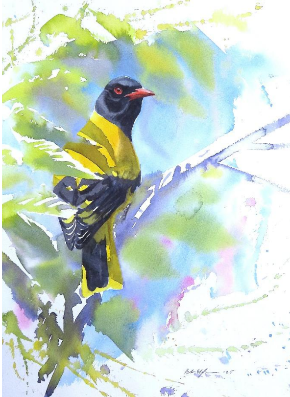
Black-hooded oriole (akvarell 28*38cm)