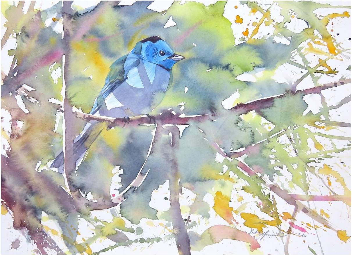
Black-naped monarch (akvarell 38*28cm)