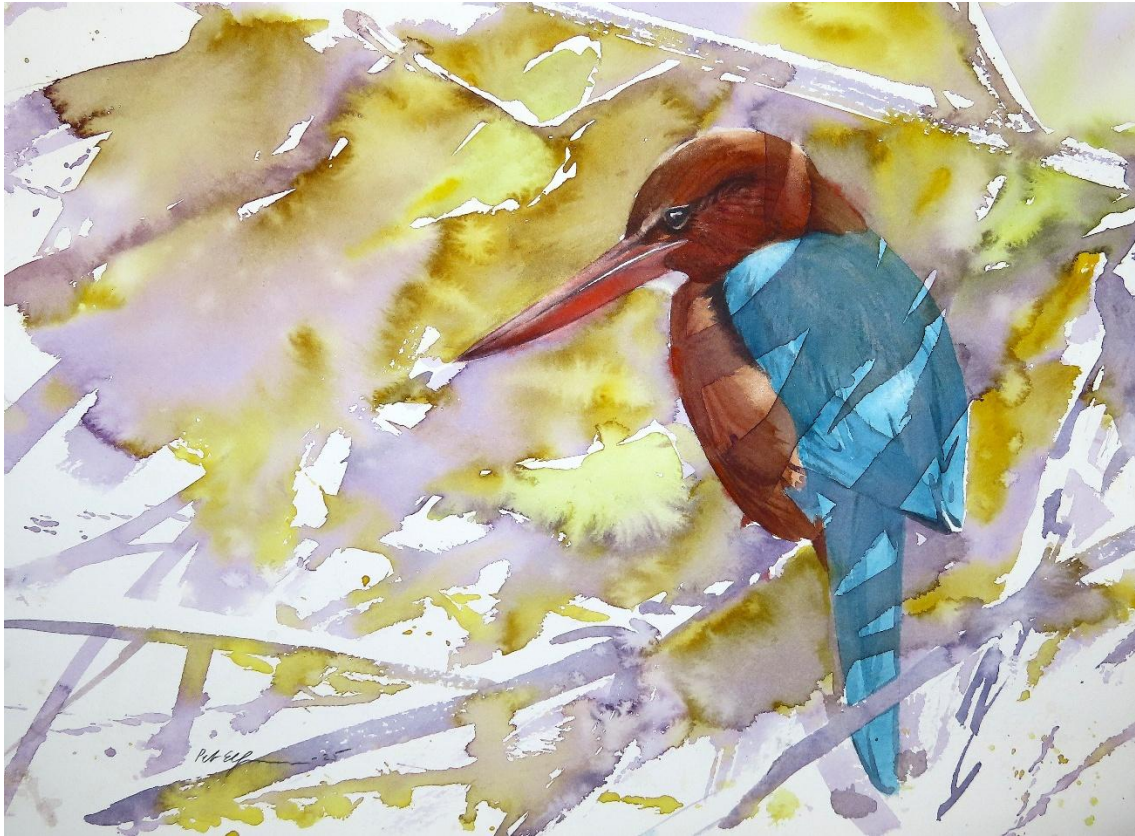
White-breasted kingfisher (akvarell 38*28cm)