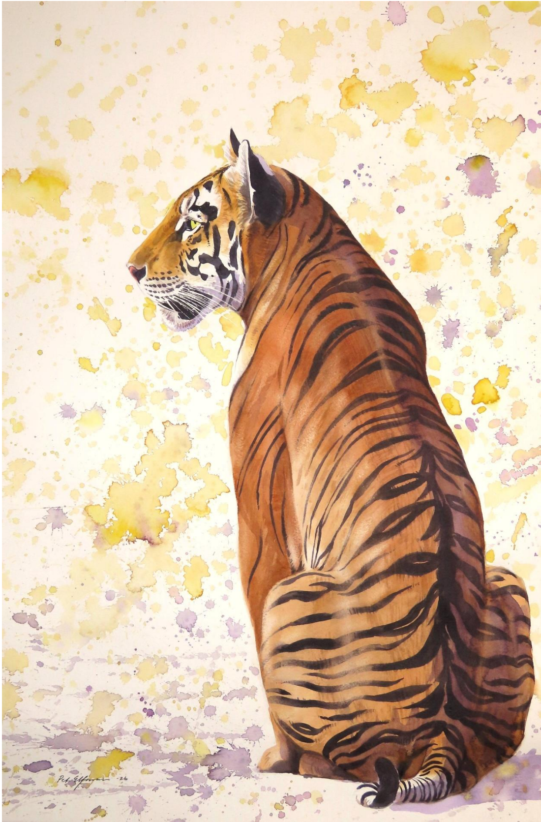
“Sad eyed lady of the lowlands” 38*58cm.