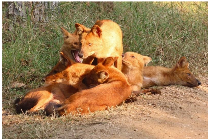
Dhole i Pench

Plötsligt sitter 8 Dhole (Vildhundar) på vägen. Vi kan följa dem i deras sociala samspel en lång stund, vi är då den enda jeepen där. Fantastiskt!