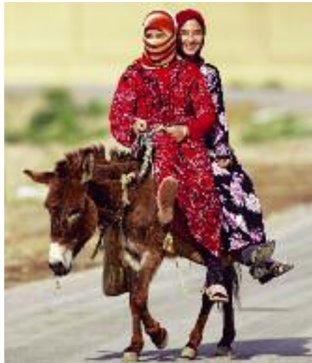
Fnittriga flickor på lokalt transportmedel i Eufratdalen. En i vårt gäng höll på att bli bortgift i denna by i april 2009

Ett annan läcker dagsetapp från huvudstaden är att ta sig upp i bergen vid den libanesiska gränsen. Här ligger byn Bloudan, en populär resort för arabiska turister som söker svalka under den heta sommaren, vilken är en