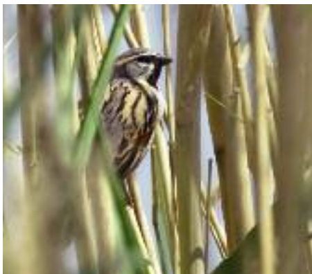
Vassarna vid Sabkhat al-Jabbul ger närkontakt med arter som mindre sumphöna, kaveldunsångare och, som här, tamarisksparr.

Många unga och välutbildade lämnar det kvävande samhällsklimatet för västvärldens större möjligheter till ett fritt liv och arbete.