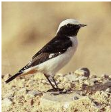
En karaktärsart runt ruinerna i Palmyra är sorgstenskivtän som under framför allt vinterhalvåret får sällskap av ett gäng kusiner som finsch- och cypernstenskivtän.

Syrien är ett mestadels glesbefolkat land med cirka 20 miljoner invånare som ligger vid skärningspunkten mellan den tidigare så grekiskdominerade Medelhavskulturen och den