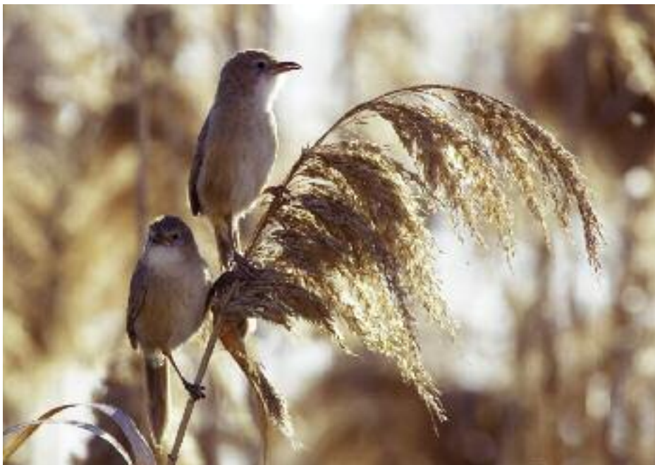
Sociala, livliga och ljudliga – mötet med irakskriktrastarna, som här vid hängbron över Euftrat i Deir ez-Zor, är häftigt!

Det är egentligen rätt otroligt att en sådan spektakulär och stor våtmark som Sabkhat al-