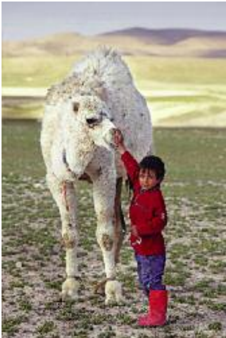
Två ur det yngre gardet bland stäppernas boskapssköttande befolkning.

Alexander den Store dundrade förbi med sin här på 330-talet f.Kr. och passade på att anlägga staden Nikeforion, dagens ar-Raqqqa, längre norrut i floddalen. De steniga branter-