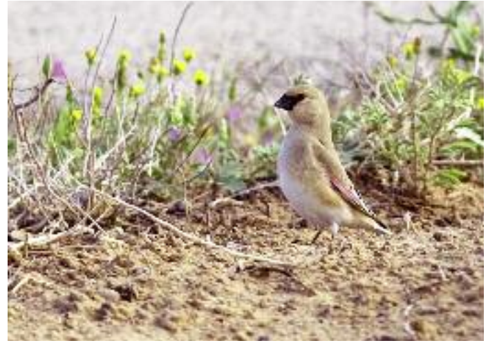
Inte fullt så ökenbunden som namnet antyder, ökenfinkarna vill gärna ha lite torra odlingar, ogräs i vägkanten och en viss nederbörd.

närproducerad måltid medan man njuter av gråfiskare och vitvingande tärnor från hängbron.