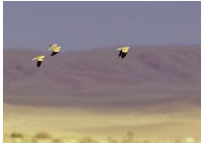
Runt Palmyra är den läckra ökenlöparen ganska vanlig och ses ofta i småflockar, distinkt svartteknade i flykten.

Under sträckperioderna är odlingar och små oaser fulla av rastande småfåglar, inklusive regelbundet balkanflugsnappare, cyprenstenskivatta och olivsångare, och de få vattensamlingarna som finns drar till sig änder, vadare, hägrar och en del rovfåglar som går ner för att dricka.