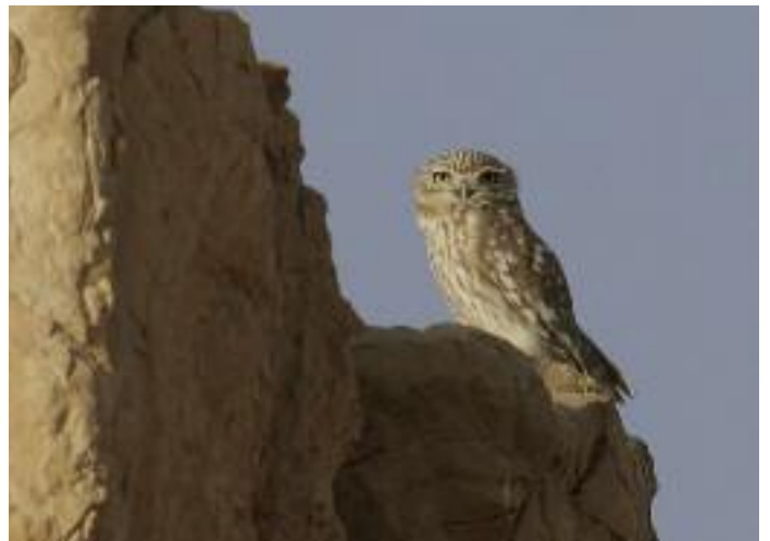
Minervaugglan är rätt spridd och ses ibland vid ruiner och kolonnader som Palmyra och Aphamea, spanandes från avsatser och pelartoppar.