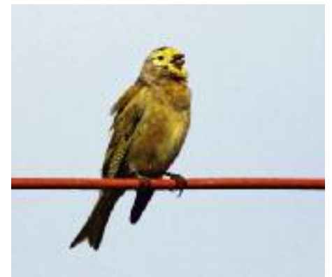
Syrien står med ett antal svåråtkomliga specialare som till exempel levantsiska. Bergsbyn Bloudan strax väster om Damaskus är en säker lokal.