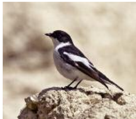
Under sträcket ses regelbundet spännande arter som denna balkanflugsnappare i halvökens oaser och odlingar.

Idag är Palmyra, Tadmur på arabiska, en av landets mest berömda sevärdheter men de mängder av besökare som platsen gör skäl för har ännu inte nått hit. Detta är ett traditionellt beduinsamhälle som sett en mindre turistboom med en del hotell, restauranger och små butiker, men det är fortsatt rätt litet och stillsamt. Cirka 60 000 invånare är dock en mångdubbling från den tidigare lilla bosättningen. En grupp naturvårdare och fågelgui-