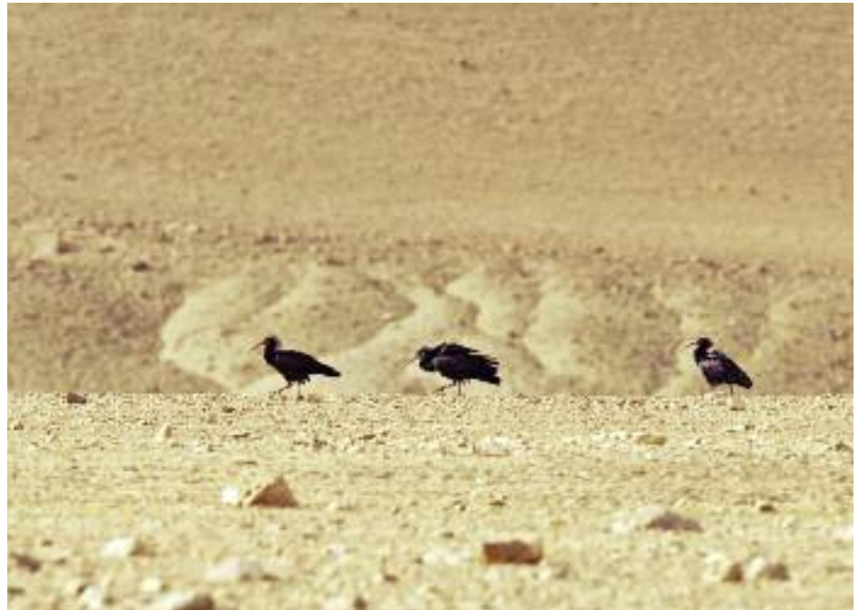
Sensationellt upptäckta år 2002 blev "Abu Mingal", eremitibisarnas arabiska namn, vid Palmyra säkerligen landets mest berömda fåglar.