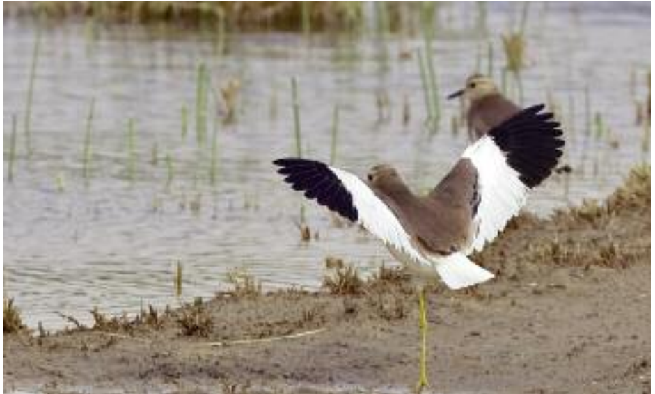
Vi är så långt österut så vi finner häckande sumpvipor! Flera lokaler i Euftratdalen hyser dessa sanslöst dekorativa djur.

Jabbul, 25 km söder om storstaden Aleppo, förblivit i praktiken okänd för västerländska skådare. Ytan av jätteområdet uppskattades 2003 till hela 260 km 2 och har påverkats av vatten som kanaliseras hit från Euftrat. Det har resulterat i en uppdelning av både salt, bräckt och färskvatten i ett ständigt evolve-rande vattensystem.