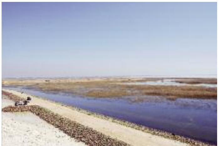
Sabkhat al-Jabbul är ett jätteområde strax söder om Aleppo i norra Syrien. Här övervintrar tiotusentals fåglar men det krävs tid, jeepar och vägvisare för att täcka in det hela. Men även ett dagsbesök är en häftig skådarupplevelse!