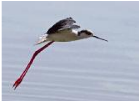
Stylltöparen är vanlig i de syriska våtmarkerna.

En typisk "Syrienhändelse" inträffade när fem rödhalsade gäss sköts i februari 2007,