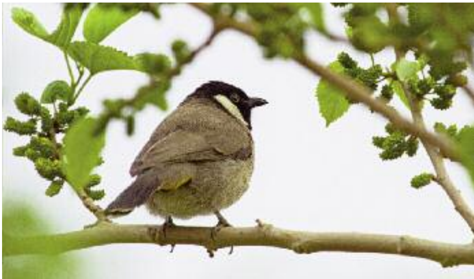
Från häckplatser i Irak och runt Persiska viken har den snygga vitkindade bulbylen expanderat mot nordväst och finns nu runt Deir ez-Zor vid Euftrat. Tidigare fanns arten även vid Palmyra, så kanske finns de vid fler outforskade oaser längst i sydost.