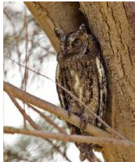
Utmattade flyttfåglar som dimper ner i isolerade dungar är ett bekant fenomen. Denna dvärguv satt vid entrén till Tallilareservatet utanför Palmyra.

na bakom borgen är en känd lokal för visselhöna men det kan krävas en del slit innan man hittar dem. Lyssna efter deras visslande läte, aningen likt småfläckig sump. I ett vassparti vid floden här hittades sensationellt en basrasångare i april 2006, första fyndet för landet. Artikel finns i Sandgrouse 2/2007.