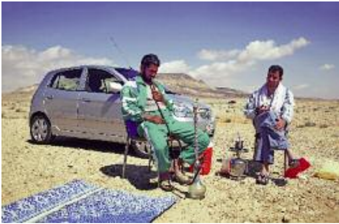
Paus längs vägen på syriskt vis: vattenpipa och té, scarf runt halsen och sandalen på sned. Får det vara ett bloss?