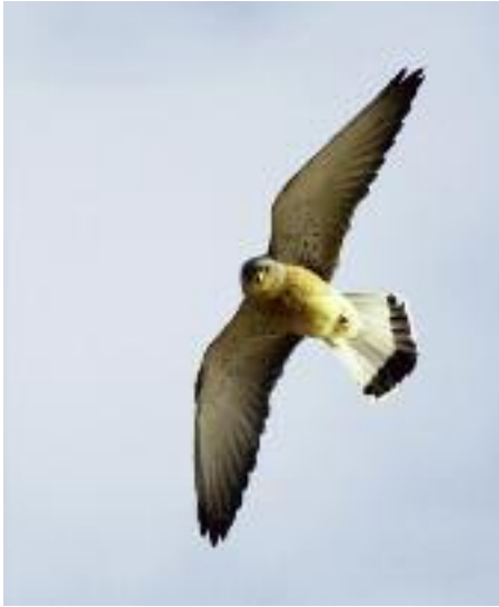
Längs vägen norr om Halabiyya i Euftratdalen finns en rödfalkskoloni vid klipporna, med spelande svart frankolin i bakgrunden.