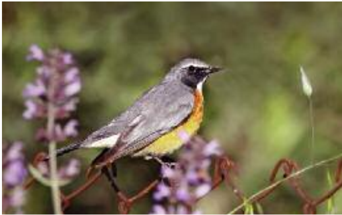
Vissa fåglar ger mer puls än andra, och mötet med en hane vitstrupig näktergal minns man länge. Häckfågel i bergssluttningar i nordväst och sträckgäst i halvökens isolerade trädgårdar.