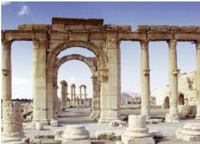
Under antiken var Palmyra, "palmernas stad" som romarna kallade den, en handelsmetropol mellan Medelhavet och Mesopotamien.

En sevärighet är den gamla hängbron, byggd av fransmännen på 1930-talet, och från denna kan man ta in den imponerande Eufrat som tyst glider söderut mot Irak, 15 mil bort. Samhällslivet här är annars präglad av jordbrukarkultur och de lokala produkter som säljs på marknader i staden. Det är med andra ord inga problem att få tag i en purfärsch och