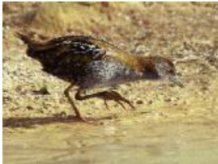
Dvärgsumphöna – man vet aldrig när den kan spankulera förbi. Ytterst svårsedd och sällan rapporterad, men de finns där. Syrien, april 2010.

Åk till Syrien och skåda fågel! Det är inte riskabelt, inte särskilt svårt, väldigt givande och