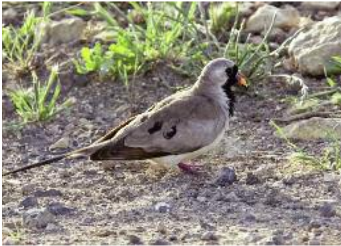
"Oj hörro, stanna! En långstjärtsduva!" Vid väggkanten i Deraa, sydligaste Syrien, i april 2009. Första obsen utanför Palmyra där en handfull ex finns.