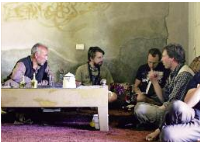
Svenska och syriska (!) skådare över en kopp té i byns samlingshus i Jabbul. Ivern och engagemanget hos lokala intresserade är inte att ta fel på!

Svenska skådare känner igen tjingande talgoxar och svirrande grönfinkar men kan också glädjas åt balkan- och mellanspett, berghöna, vitstrupig näktergal, mäster-, oliv- och svarthakad sångare, klippspärv och klipp-nötväcka. Byn Slenfeh, mycket vackert belägen nära bergsryggens topp med utsikt över Medelhavet, och borgen Qalaa't Salah ad-Din en bit norrut är två bra platser för nämnda