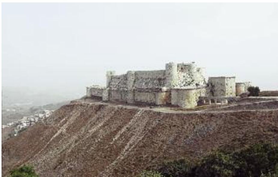
Krak des Chevaliers från 1100-talet är en världens bäst bevarade korsriddarborgar och ett måste för de flesta Syrienbesökare. För skådaren blir det sen inte sämre av att ett rikt rovfågelsträck passerar här under vår och höst!

De vidsträckta lämningarna från den romerska handelsstaden dominerar Palmyra och samhällets centrum med hotell och restauranger ligger allt inom gångavstånd. Runt ruiner, glesa buskmarker och stenskravel kan arter som minervauggla, långstjärtsduva, sorgstenskvvätta, oriensångare, östlig sammetshätta, trädnäktergal och ökenfink noteras medan man begäpar antikens legender.