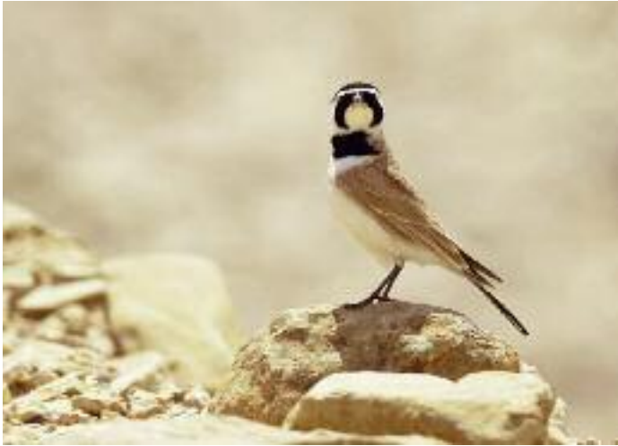
Något av en karaktärsart för de steniga och glest bevuxna halvöknarna i centrala Syrien, ökenberglärka.