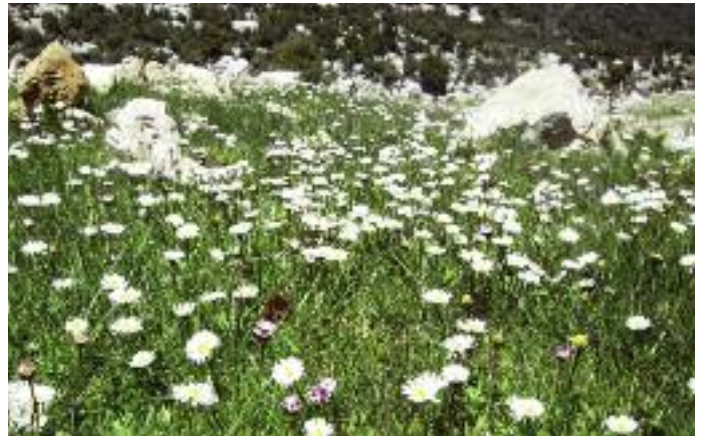
Den som trodde att Mellanöstern är lika med öken får tänka om. I bergsmassiven längs Medelhavskusten faller mycket snö under vintern. Biotop för vitstrupig näktergal och olivsångare.

arter. Den syriska Medelhavskusten är i princip utforskad av skådare och har några spännande lokaler i norr mot den turkiska gränsen. En av de nordligaste uddarna, Ras al-Bassit, besöktes i september 2007 och detta genererade två förstafynd för landet, gulnäbbad lira och toppskarv, vilket är exempel på hur underskådat landet är.