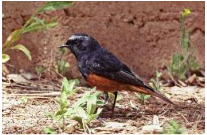
Sydostliga raser av en del arter ska man plugga in före resan, för att undvika hjärnsläpp i fält. Svart rödstjärt av rasen semirufus är en grann uppenbarelse.

När Hafiz al-Assad, president sedan 30 år tillbaka, dog år 2000 och hans son Bashar tog över ämbetet lättades atmosfären en aning men ingen reell skillnad har kunnat märkas.