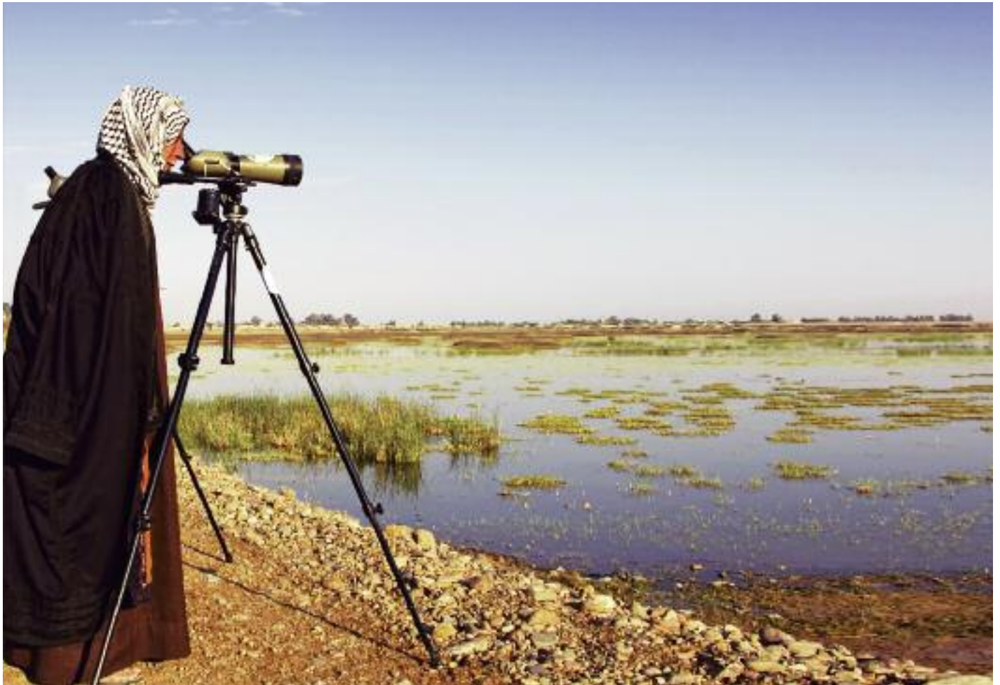
Fågelskådning och fågelskådare är något fullständigt främmande i Syrien – men också välkommet och uppskattat. Möten med den varma lokalbefolkningen lever kvar lika länge som minnena av alla kul arter man sett.