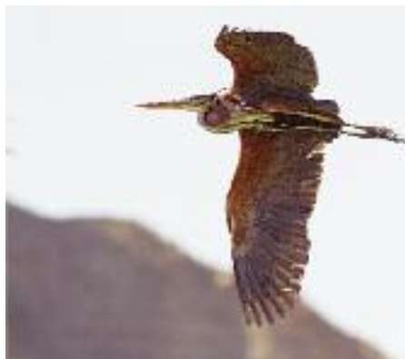
Under sträcket kan en del purpurhägrar ses även vid små dammar i den karga halvöknen, som här vid Wadi Abied.