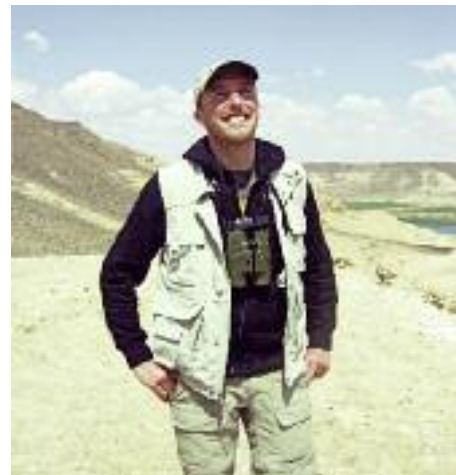
Artikelförfattaren pustar ut under sökandet efter visselhöna i Halabiyyas steniga branter med magnifik vy över Eufratdalen.