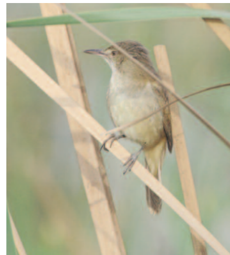
Om du tror att du ser en korsning mellan rörsångare och långnäbbad mås så är det en papyrussångare som hoppar fram. Finns i hela Nildalen och är rätt så lättsedd.

På 1960-talet pågick omtumlande händelser i Egypten och dess närhet. President Nasser, som ledde utkastandet av det brittiska styret