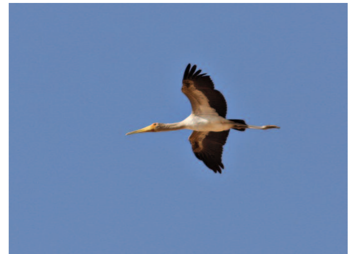
Pulsen stiger så fort man kliver ur bilen vid Nassersjöns strand i Abu Simbel. Vad som helst kan hända. Här drar en ung afrikansk ibisstork förbi. April 2008.

sedd. Nämda hotell har regelbundet skåda-re som gäster och dess trädgård torde vara en av de läckrare, med ett myller av rastande fågel framför allt på våren. Årsskiftet 2006/2007 fanns där grå hypokolius, svart trädnäktergal och isabellatörnskata – samtidigt!