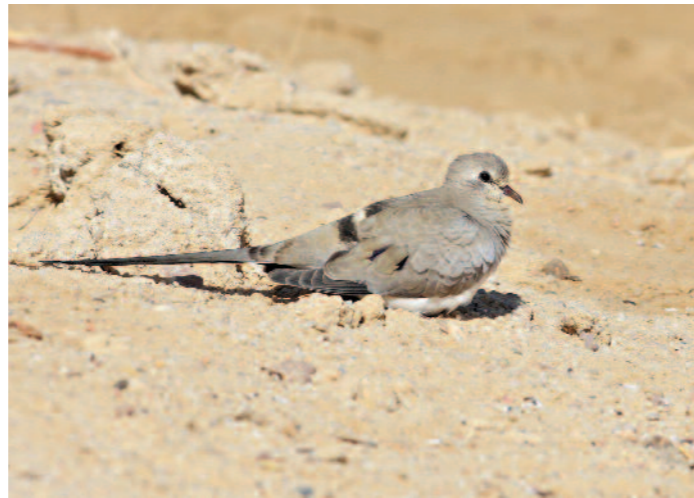
En rätt svårsedd och fåtalig art inom VP är långstjärtduvan som i Egypten dock verkar öka och nu kan ses på flera platser. Hurhadass soptipp i april 2008.