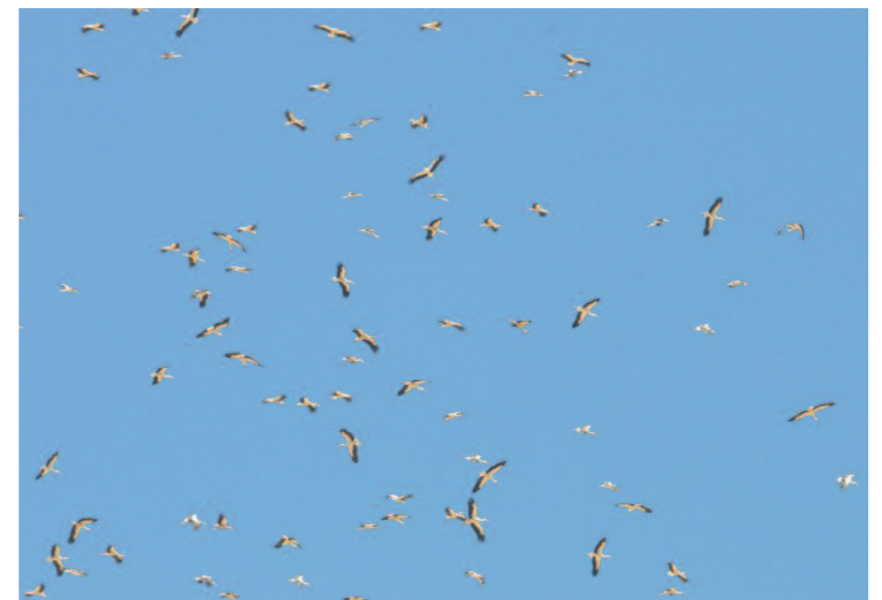
Vita storkar på flyttning över Ain Sukhna, april 2008.

För att hänga in dessa och mer därtill så bör man ha gjort sin hemläxa angående skådning i Egypten. Besök vid allt från Kairos sumpiga utkanter, avlägsna mangroveträsk, gudsförgätna ökenbyar och oändliga kuststräckor, och det vid rätt tid på året och med en god