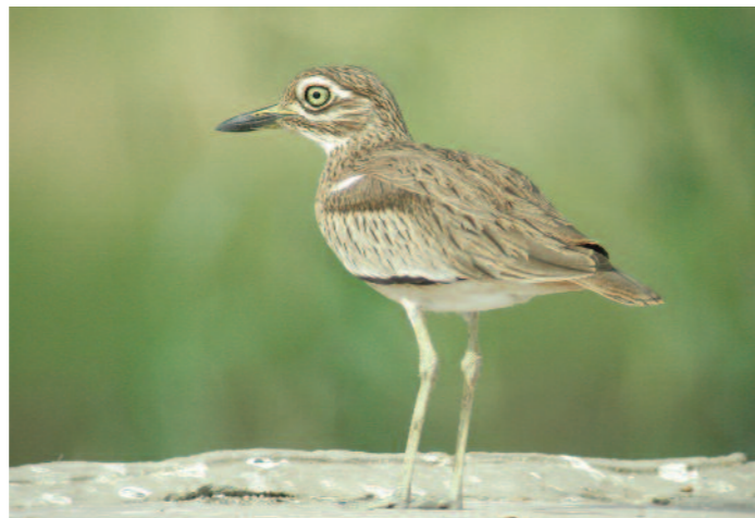
I Egypten behöver du inte vänta på att komma ut i fält för att se kul arter. Hustak, di-keskanter och bakgårdar duger fint tycker bl.a. senegaltjockfoten.

Ungefär en och en halv timmes körning mot nordost från Kairo finner du fiskdamarna vid Abu Hamad. Det här är en känd lokal för bland annat rallbeckasin, kittlitzpipare och streckad vävare. Piparnas biotop grävs ibland upp, så dessa har jag missat flera gånger här, men i Wadi Natrun (samma körtid fast åt nordväst) finns de allmänt. Runt damarna finns även hägerkolonier, bronsibis, sjungande papyrussångare, gröna biätare (från april) och allmänt trevlig skådning. Vin-