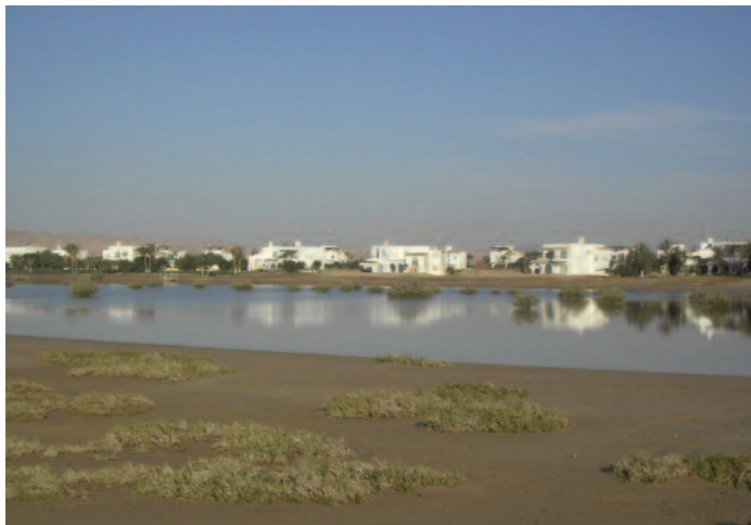
Lagunerna precis söder om golfbanan i El Gouna. Anlagt men rätt så ostört område, fint morgonljus.

Den uttorkade flodravinen tillika nationalparken Wadi El Gemal hyser ökenarter som härfågellärka, sorgstenskivetta, ökenlöpare och slagfalk. Längst in bland klipporna har också en klippuggla hävdad revir de senaste åren. Ut mot wadins mynning, nära hotellet Shams Alam, har afrikansk turkduva häckat och ses regelbundet (men turkduvor finns också, var aktsam!) och ökennattskärna är