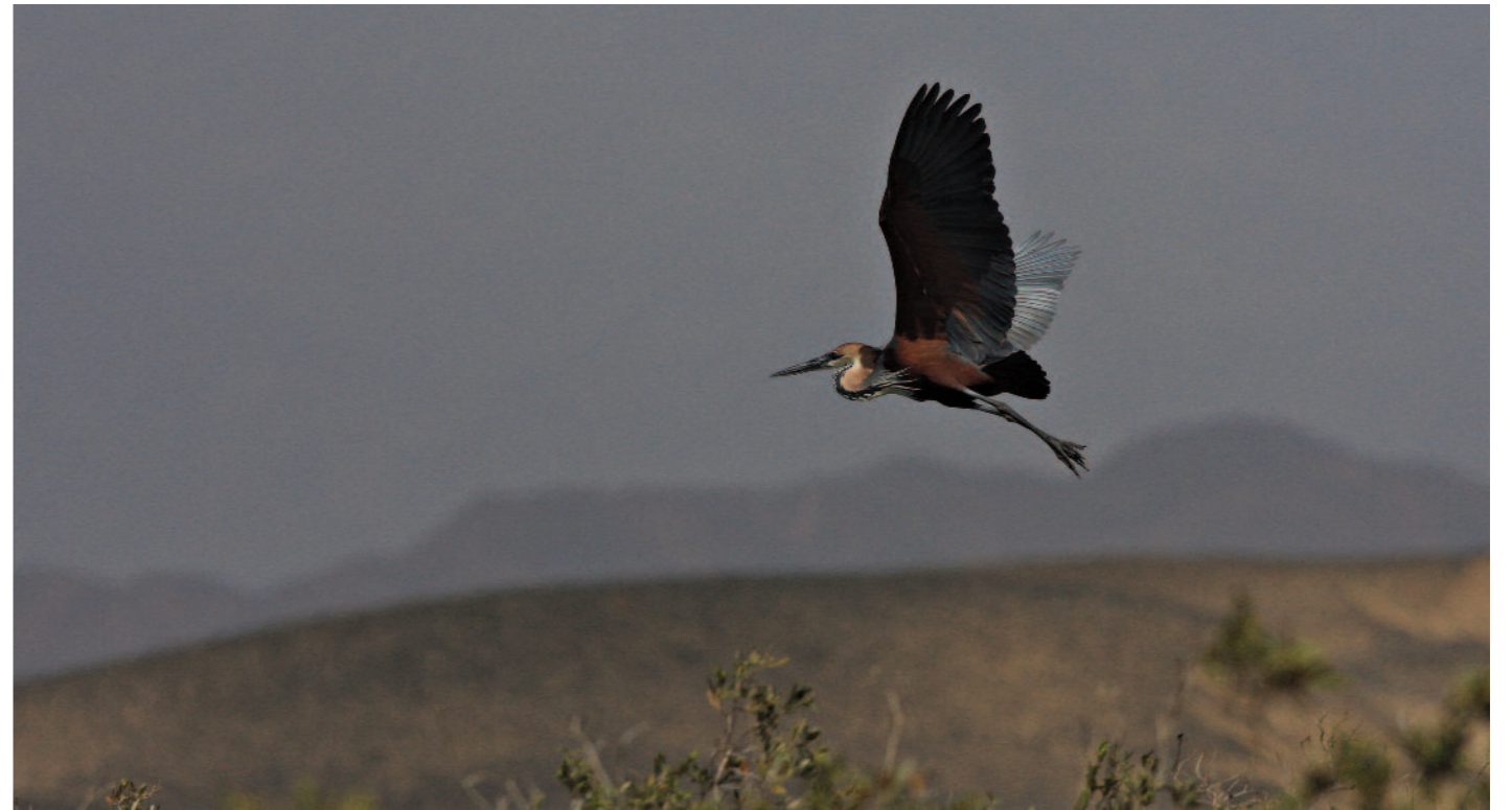
En av de absoluta höjdpunkterna, för den som har lite tur, är ett möte med jätten Goliath! Vissa försöker med en purpurhäger på håll i värmedallret, men när väl goliathägern visar sig är det ingen tvekan längre.

En bit in i april är artutbudet än bättre och kanske som mest händelserikt runt mitten av månaden med fantastiska dagar där ingen är den andra lik. Golfbanan i El Gouna är nedludd av ärlor, pipelärkor, skvättor, törnskator och vadarsvalor, sydnäktergalar och sångare i snåren och med gröna biätare, vitvingade tär-