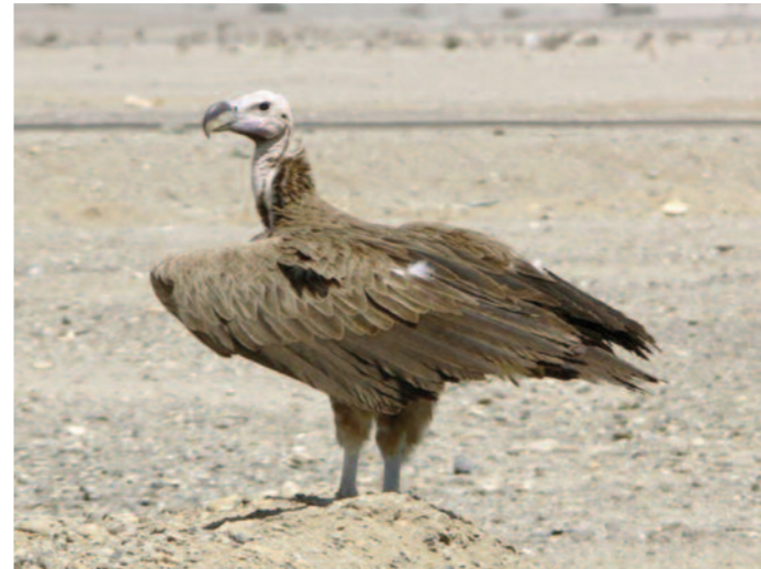
Man måste ta sig hela vägen ner till Sudangränsen där det vid dromedarstationen och byn Bir Shalatein finns några tiotal örongamar.