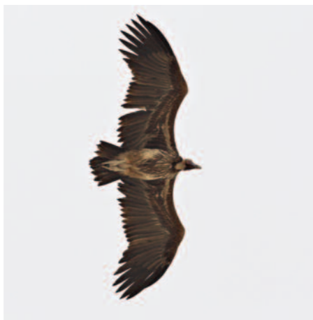
Örongam – en tung VP-art. Här plådad rakt ovanför ben-sinstationen i Bir Shalatein.

Egypten är ett av de folkrikaste länderna i Mellanöstern och är beläget vid Afrikas nordöstra hörn, där folkgrupper, kulturer, handels-