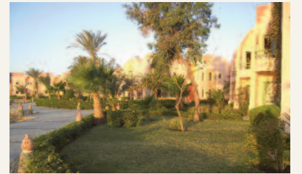
Trädgården vid hotellet Shams Alam. Mycket spännande rastlokal för tättingar, framför allt under vårsträcket. Bra span över havet (svarhuvad trut och brun sula om du har tur!) och Wadi El Gemal på promenadavstånd.