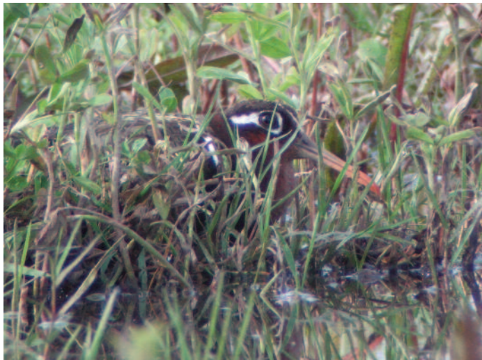
Diskret och exklusiv, rallbeckasinen står högt på önskelistan. Leta i enkelbeck-biotop längs Nilen som här vid Crocodile Island. April 2006.