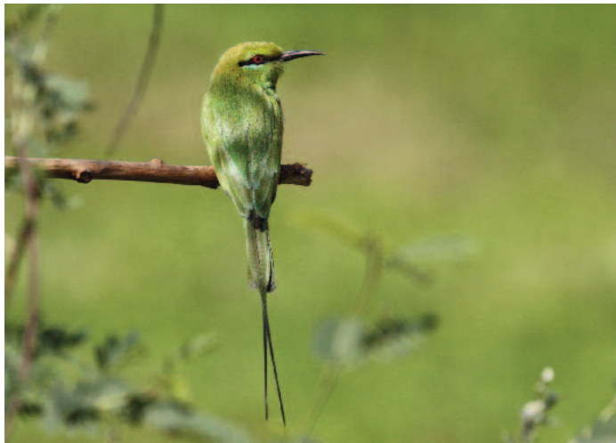
Skådningen i Egypten kan bli en färggrann upplevelse med tre arter biätare och tre arter kungsfiskare på samma lokal. Här en grön dvärgbiätare.