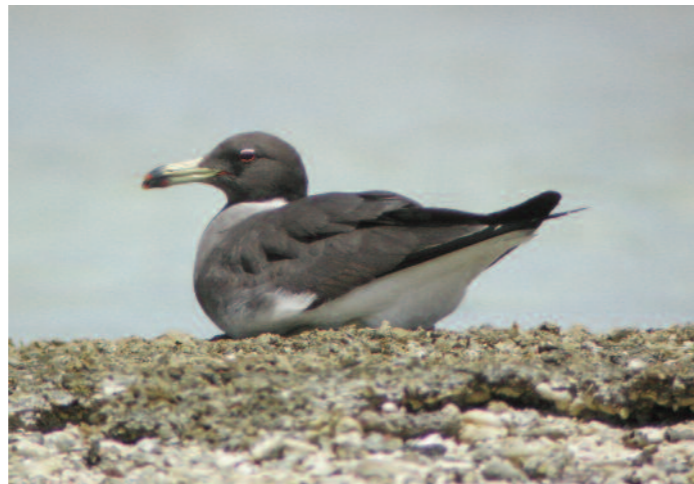
Röda havet hyser en begärlig kollektion av måsar och tärnor. Hamnspar från t.ex. Hurghada funkar för arter som denna sotmåsa.