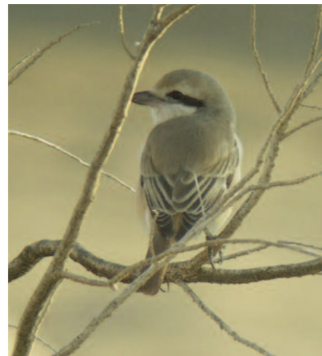
Ett läckert inslag är de asiatiska arterna som kan ses i små antal under vinterhalvåret. Tex svarthuvad trut, större piplärka, sumpvipa och som här i en hotellträdgård, isabellatörnskata.

Från november till februari råder lågvatten i Nilen och de många slambankar och stränder som blottläggs hyser då mängder av fågel. Denna lättillgängliga lokal är utmärkt för att hänga in både specialare som nilsolfågel och papyrussångare men framför allt vintermängderna av våtmarksfågel. Isabellatörnskata har övervintrat och jag har själv stött större piplärka här. I maj 2009 fotades till och med en African Openbill, gapnäbbsstork, på lokalen, vilket torde vara första fyndet i VP!?