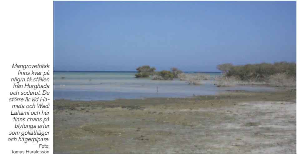
Mangroveträsk finns kvar på några få ställen från Hurghada och söderut. De större är vid Hamata och Wadi Lahami och här finns chans på blytungta arter som goliathäger och hägerpipare.