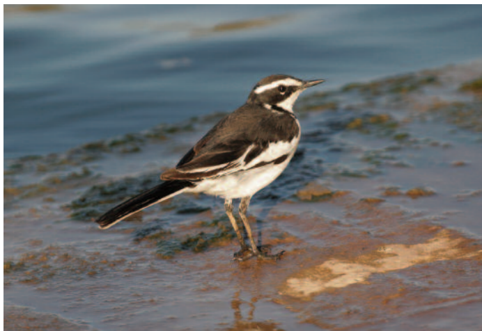
Om du i sydligaste Egypten hör en ärla som låter som en tofslärka kan det vara en brokäräl! Finns i Abu Simbel, men ibland även runt Aswan.

Afrikansk saxnäbb har häckat med några par på en liten sandbank ute i sjön och ses ibland från byn. Brokärla hävdar revir likaså och ökennattskärna finns på ett par ställen. Afrikansk turkduva och långstjärtsduva har hittats i byns trädgårdar, kittlitzpipare och rallbeckasin är sedda där biotopen passar. Sträckperioderna bidrar med överraskande arter och ett aprilbesök kan ge allt från stentrast till dvärgsumphöna. Berberfalk och kronflyghöna finns i omgivningarna.