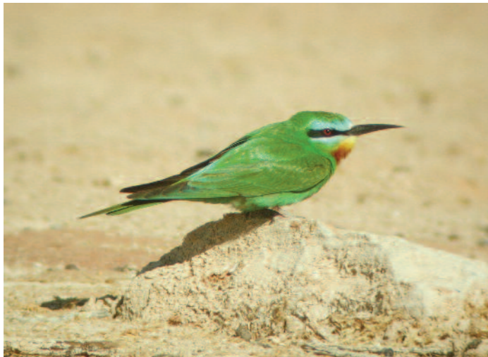
En grön biätare slår till på den torra marken i Abu Simbel på sin flyttning norrut. April 2006.