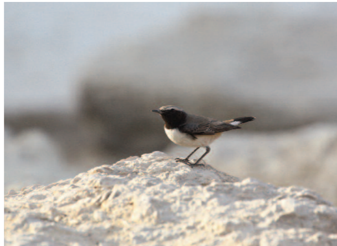
En del udda vintergäster från västra Asien kan krydda besöket vid t.ex. Gizapyramiderna där denna hane kurdstenskvätta fanns i januari 2009.

portion tur, måste till för att få njuta av dessa arter.