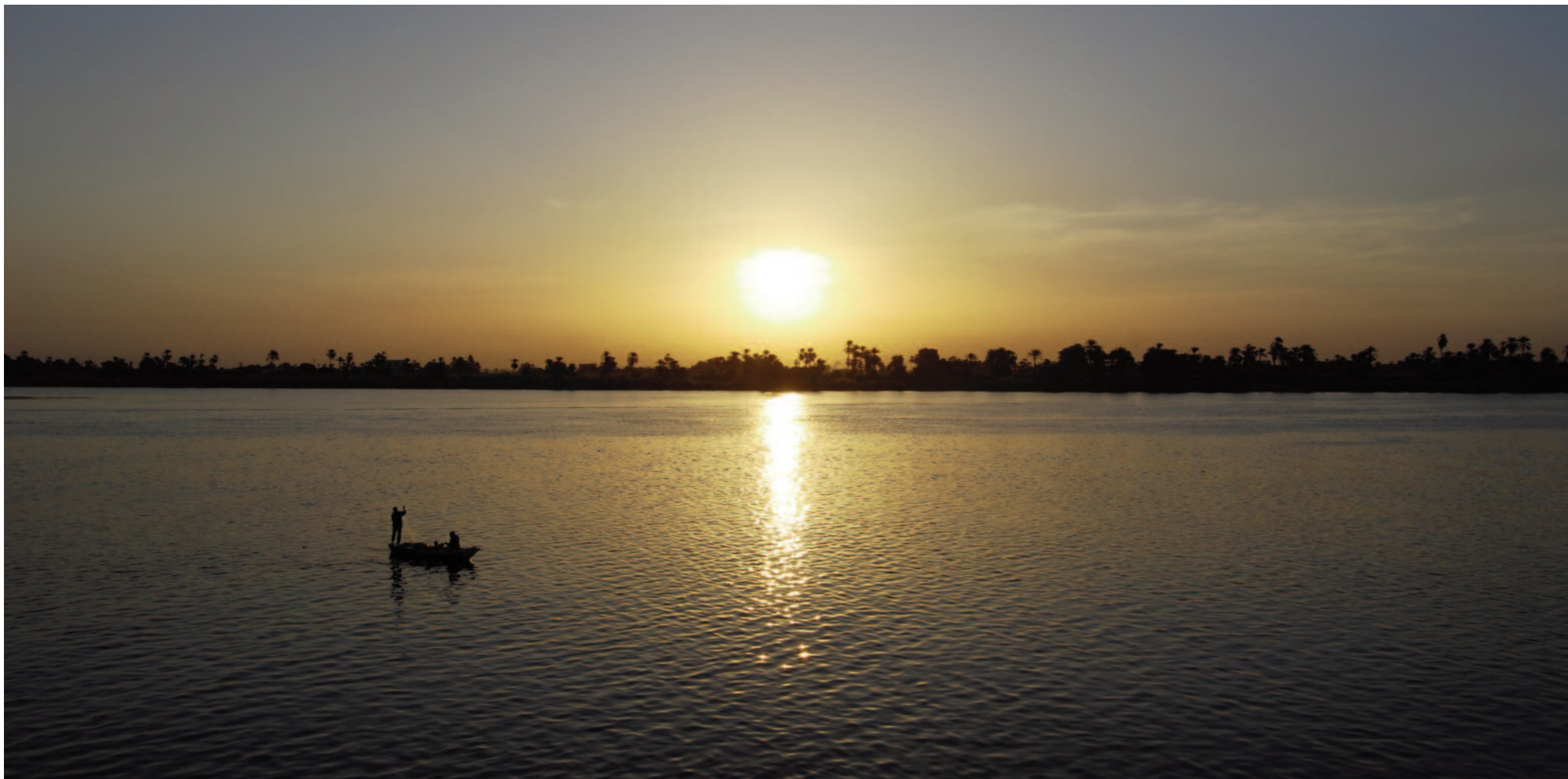
Efter en lång skåddag i Egypten med spännande arter så är känslan total när solen sänker sig över den mytomspunna Nilen.