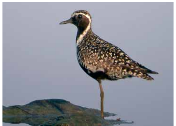
Högräst och elegant stod den här sibiriska tundrapiparen på Morups tånge i juli.

Den hane svartbent strandpipare ( Charadrius alexandrinus ) som sågs under våren och sommaren vid Ottenby fick sällan vara i fred mer än några få minuter åt gången. De större kusinerna var snabbt på och hackade på den lille, som dock inte vek ned sig i första taget!