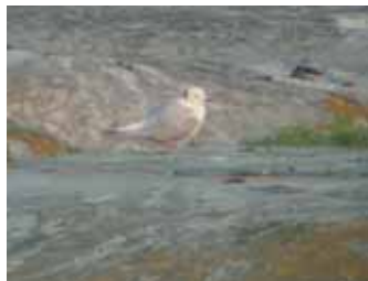
Matti Åhlund lyckades ta en kortare serie bilder av rosenmåsen på Mörholmen.