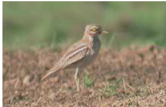
Bonden i Tulunda upptäckte tjockfoten när den följde efter traktorn.