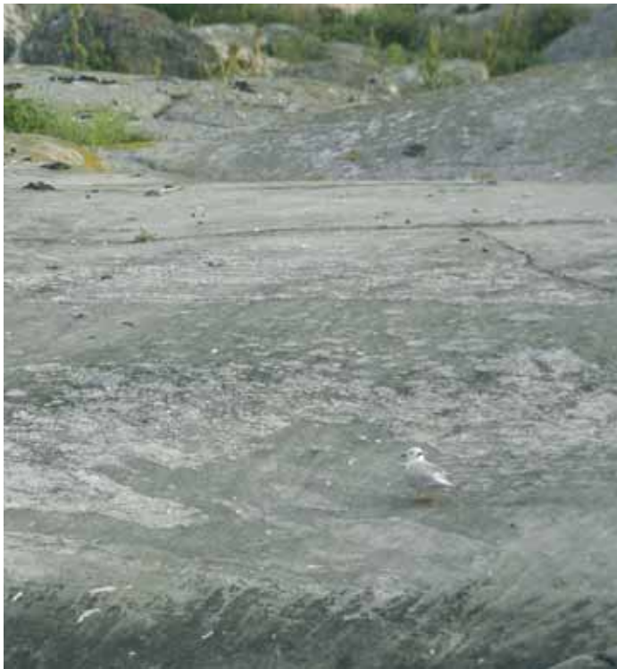
Det var när Matti Åhlund inventerade ett naturskyddsområde i Bohuslän som han plötsligt stod öga mot öga med en rosenmås.