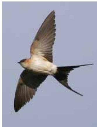
Läcker rostgump vid Södra Lunden på Öland.