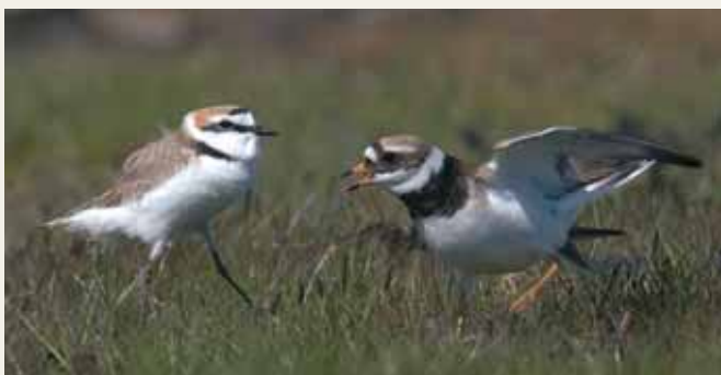
Tungviktsmöte vid Ottenby på Öland. Tyngd mot näbbighet.