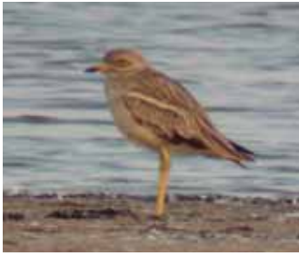
Tjockfot utan gula blommor.