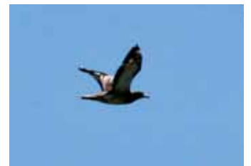
Tjockfoten på Vinga, påpassligt plådad i flykten.

Ännu en tjockfot dök upp före halvårsskiftet. Tidpunkten var väl vald för att ställa till det för midsommarslit-