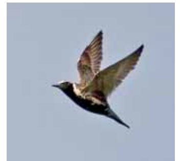
Sibirisk tundrapipare drar mot nya mål.

Kommentar: Fram till 2006 har det observerats 52 fynd av 53 fåglar i landet. Två eller tre fynd i år, beroende på hur man räknar Blekinge-fågeln, är ett normalt utprä- dande för arten. Däremot tycks antalet juvenila fåglar minska, ingen sedd sedan 1999, hur blir det i år?