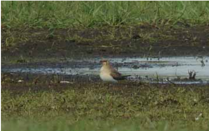
Större delen av eftermiddagen stod den rödvingade vadarsvalan vid Ingelstorps ångar still, men några flyguppvisningar hann den ändå med.