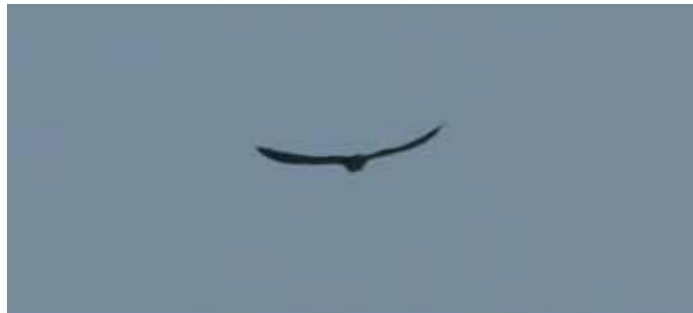
Eleonorafalken vid Knösen den 3 maj 2006.

Bevakningen på lokalen de kommande veckorna resulterade i obs av röd- och brunglada. Den senare är inte årlig i Värmland. – CORELL