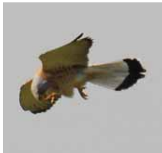
...och om han hade insett vad det var han fotade är det möjligt att han inte hade varit lika stadig på handen.