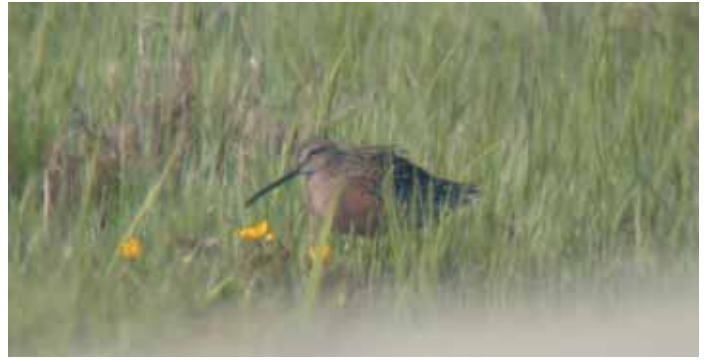
De flesta svenska fynden av större beckasinsnäppa är höstfynd. Den vackert röda fågeln vid Håslöv var blott det femte vårfyndet av arten.