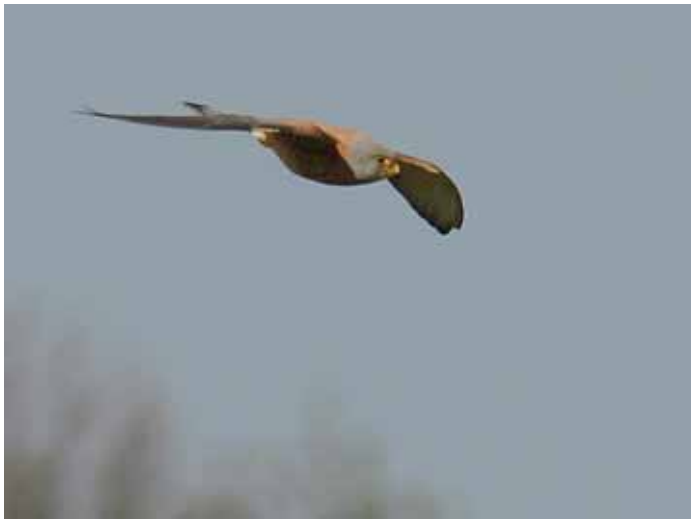
Lite av en mardröm – att i efterhand inse att man haft värsta rariteten mitt framför näsan, men ändå inte sett den liksom.