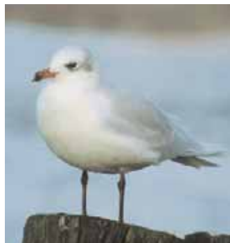
Uttittad mäs ( Larus melanocephalus ) i Göteborg.

Den 29 november 2005 kunde Stefan Svanberg konstatera att den svarthuvade måsen Larus melanocephalus , som vintern 2004-2005 höll till vid Klippan i Göteborg, hade hittat tillbaka för en ny vintersejour. Nytt för denna säsong var att fjäderdräkten nu var helt adult. Borta var de svarta teckningarna på handpenorna. Mer uttittad mäs får man leta efter. – CORELL