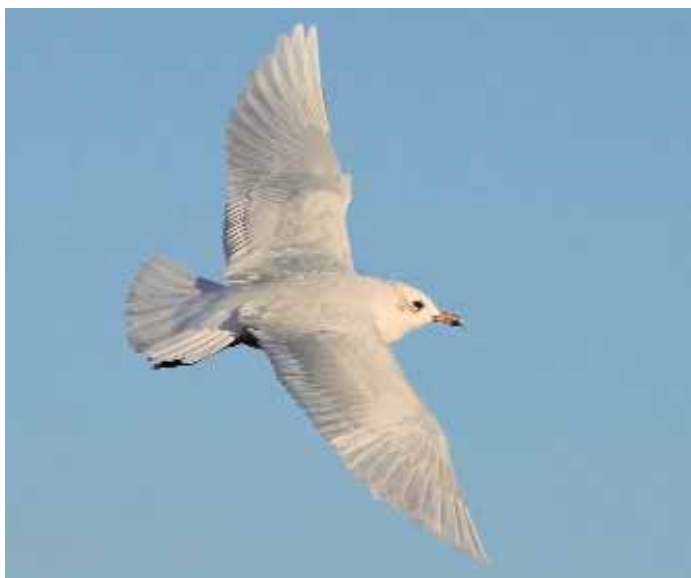
Borta är nu de svarta teckningarna på vingpenorna.

Hökugglor på löpande band. Landet upplevde en mindre invasion av hökuggla Surnia ulula under slutet av 2005 och början av 2006. Det gav en hel del schysta fotolägen, bland annat på den här fågeln som fanns kring Norra Vissjön utanför Ljungby i Småland.