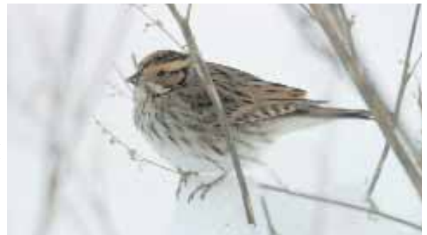
Det finns bara några få tidigare fynd av dvärgsparv ( Emberiza pusilla) i Bohuslän.