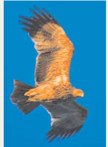
Precis som alla vi andra blir kejsarörnen ( Aquila heliaca ) bara äldre. En koll i Dick Forsmans rovfågelsbibel ger vid handen att örnen nu ser ut som en 4K-fågel.