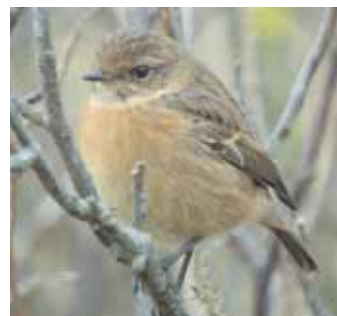
Den övervintrande svarthakade buskskvättan ( Saxicola torquatus ) i Trelleborg.

Båda övervintrarna fanns fortfarande kvar vid pressläggningen av denna tidning. — CORELL