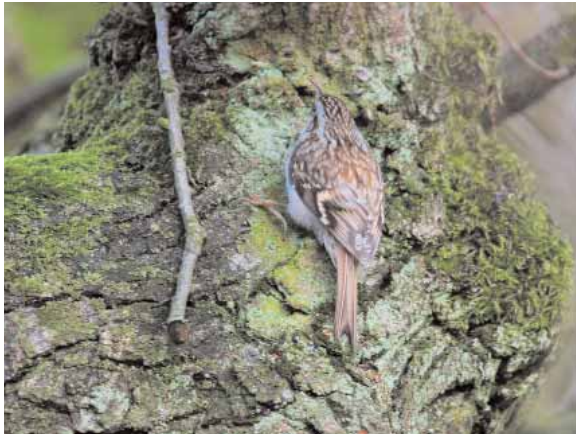
Efter två riktigt långstannande individer under 2004 och 2005 finns nu trädgårds-trädkryppare ( Certhia brachydactyla ) plötsligt på var mans sverigelista.