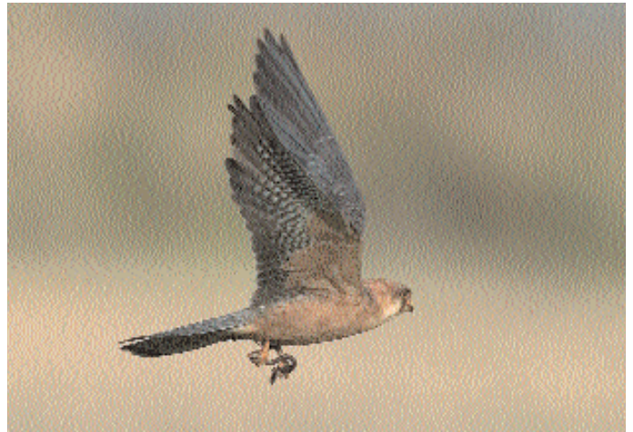
Aftonfalken ( Falco vespertinus ) vid Siggesta i Uppland gjorde frekventa utfall mot maskar och larver, så någon brist på föda verkade det inte vara. Den hade inte heller något emot att släppa skådarna in på livet – till och med amatörerna fick fina bilder. Men till amatörerna kan man inte räkna Lars Friberg, som här levererar ett par praktskott.