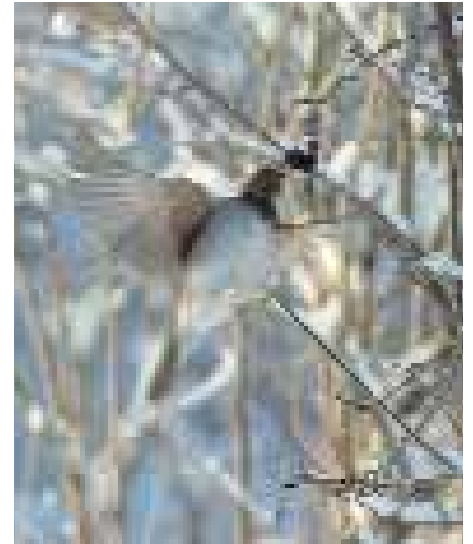
Taigatrasten ( Turdus ruficollis atrogularis ) i Tavelnsjö, upptäcktes den 20 november och kunde ses till och från under tio dagar. Det var Västerbottens första dragbara taigatrast.