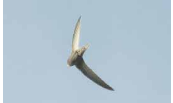
Luftakrobatik i den högre skolan. Individerna på den här sidan fotade Tomas Lundquist 10 november. Fågeln var en av de två omdiskuterade seglarna på Näset. Skådarna på plats var av den uppfattningen att det rörde sig om en blek tornseglare ( Apus pallidus ). Fotona gav upphov till diskussioner om arttillhörighet, och ännu har inte Rk sagt sitt.