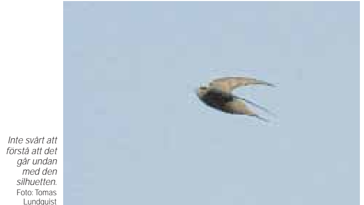
Inte svårt att förstå att det går undan med den silhuetten.

Trots att raritetsrapporter på Näset-fåglarna skickades in nästan omgående hann de inte komma in i tid