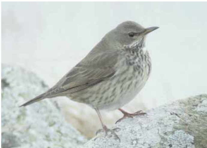
Taigatrasten ( Turdus ruficollis atrogularis ) i Halland var landskapets första. Fågeln, en 1k-hona, var kvar vid Södra Näs fram till den 25 november.

Kommentar: T.o.m. 2003 hade 27 fynd gjorts av taigatrast i Sverige. Hallandsfågeln var landskapets första fynd, medan fågelns i Tavelnsjö var den tredje för Västerbotten, men den första dragbara. Tidigare Vb-fynd har gjorts den 3 januari 1972 och vid julhelgen 1995.