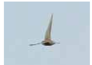
De senaste två åren har bjudit på oväntade inflöden av sena seglare. I förfölj lockade fåglar på Öland (Grönhögen) och i Nordostskåne (Friseboda). I år var det framförallt de två individerna på Näset i Skåne som var dragbara, men även på andra ställen i landet rapporterades det om bleka tornseglare ( Apus pallidus ).