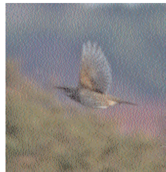
Ett par påpassligt avfytrade flyktskott på Hallandsfågeln.