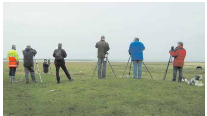
Det fanns gott om tid att studera de två seglarna när de for fram och tillbaka över skådar-nas huvuden.

för att kunna behandlas vid Rk:s möte i början av december.