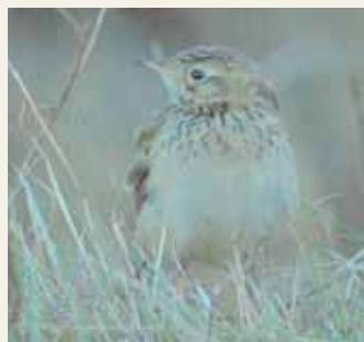
Finstreckat bröst var en av de karaktärer som fick skådarna att haka till om det verkligen inte kunde vara en mongolpiplärka trots allt.

Kommentar: Om fynden godkänns blir de landets sjätte respektive sjunde fynd, varav sex har setts under 2000-talet. Mongolpiplärka är kryssad av ungefär hälften av medlemmarna i Club300.