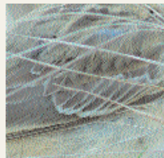
Juvenila mellersta täckare med utseende som pekar mot mongolpiplärka. Inte lika utdragen form som hos större piplärka.