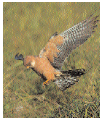
Aftonfalken vid Siggesta var kvar vid denna tidnings pressläggning och torde vara den senaste obsen av arten i landet.