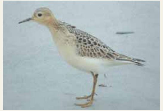
Prärielöparen stretchar lite innan den drar vidare. Kyls strandbad, Sydostskåne 11 september.