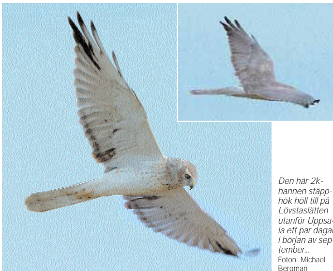
Den här 2k-hannen stäpphök höll till på Lövstaslätten utanför Uppsala ett par dagar i början av september...