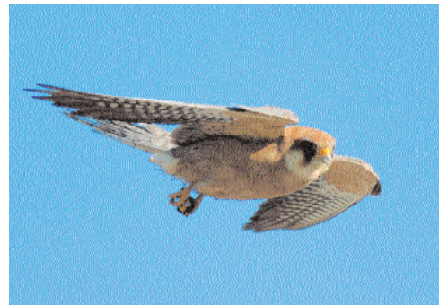
En orädd hona aftonfalk plockade larver och mask på en äng vid Siggesta i Uppland under sena oktoberdagar.