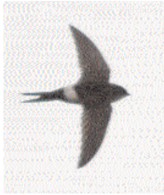
Fågeln form, den vita övergumpen, stor ljus hakfläck och vattningen på kroppen uteslöt allt annat än orientseglare. Landets andra fynd av denna megararitet – även i europeiskt perspektiv – var ett faktum. Hoburgen den 30 juli 2005.