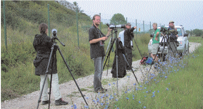
Bara ett 20-tal skådare hann se orientseglaren när den snurrade runt Hoburgsklippan i knappt två timmar.