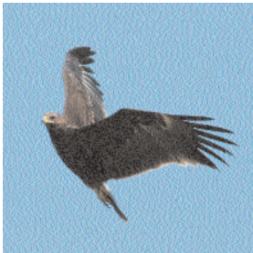
Den här subadulta större skrikörnen sträckte söderut längs sydöstra Öland den 7 september och dök senare upp i Falsterbo.