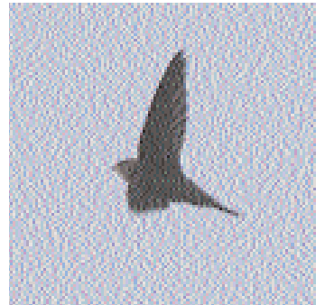
En del gotlandsskådare har flytt med seglare i år. Inte minst Gösta Reiland, som hann med orienten i juli och upptäckte den bleke mindre än tre månader senare. Blir det alpseglare till våren?