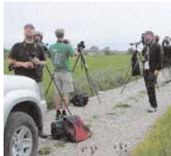
Långtifrån alla gotländska skådare hann fram innan seglaren försvann.

Kommentar: Ett tidigare fynd av orientseglare har gjorts i Sverige, den 6 juli 1999 på Getterön, Halland. Mikael Nord svarade för den upptäckten.