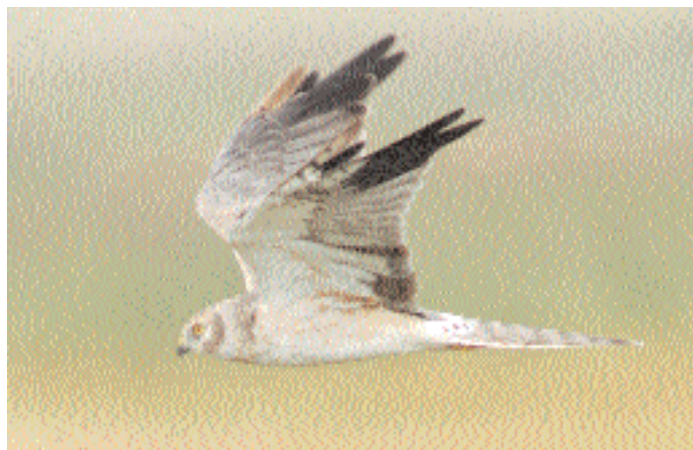
...och samtidigt sågs den här 2k-hannen i Falsterbo.