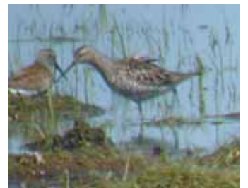
Lång i alla ändar – så kan väl en styltsnäppa bäst beskrivas.

De som trots allt fortfarande saknar styltsnäppa på sverigelistan bör de kommande åren ta semester i juli och hårdbevaka Beijershamn. Två av landets tre observationer är gjorda just här, båda under juli månad.