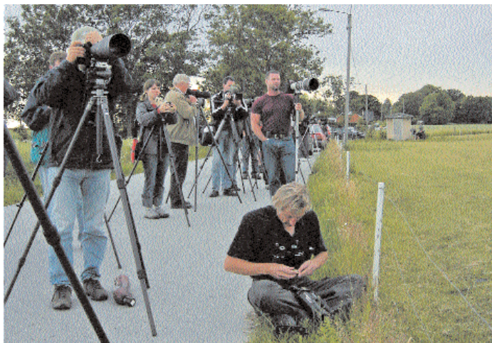
Vid den här tidningens pressläggning hade närmare 160 C3-skådare uppdaterat kohägern på sin Sverigelista.

dahägern är bara landets tredje fynd av denna minihäger. Efter ett underkänt fynd 1985 från Bjarred i Skåne som rörde en rymling, kom landets första fynd två år senare i Åkersberga i Uppland – denna dock funnen död. År 2002 stälde en kohäger till stort förtret när den passerade genom landet och sågs som hastigast på tre ställen.