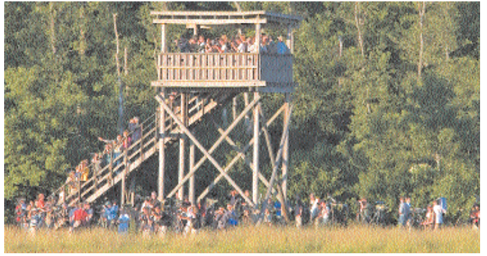
Kanske hade det behövts "dörrvakter" vid norra tornet kvällen den 4 juli. Det var "En ned, en upp" som gällde.

Bästa fotolägena verkar ha givits första timmarna efter upptäckt.