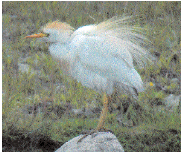
Hägern var kvar tillräckligt länge för att hinna beskådas av ett flera hundra skådare.