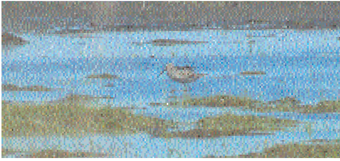
Jesper Danielson hittade inte bara styltsnäppan – han fick också bland de bästa bilderna på fågeln.