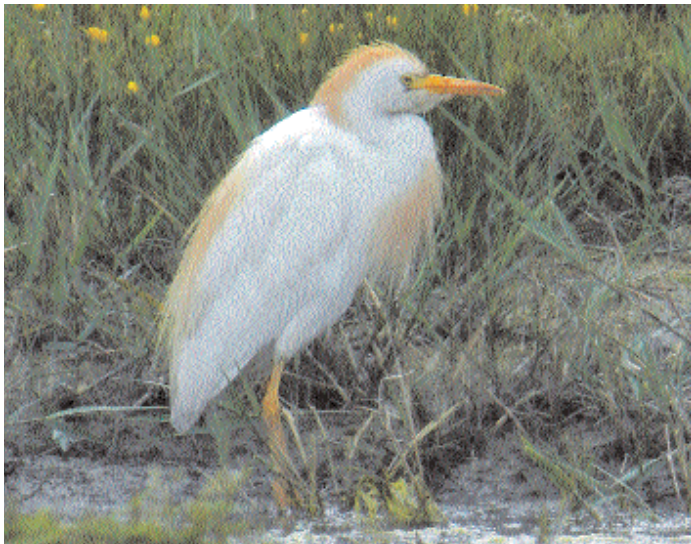
Kohägern spatserade lugnt omkring i kanten på Råbydammen i sydöstra Lund.