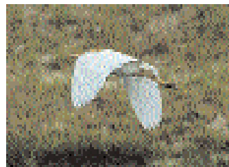
Kohägern sågs från och till i tre dagar innan den drog iväg 2 juli.

Kommentar: Blott 16 skådare hade sett arten i Sverige innan årets fynd. Ytterligare 156 hade uppdaterat på nätet per den 16 juli. Totalt bedömer Lars GR Nilsson att cirka 500 skådare tittade på fågeln. Lund