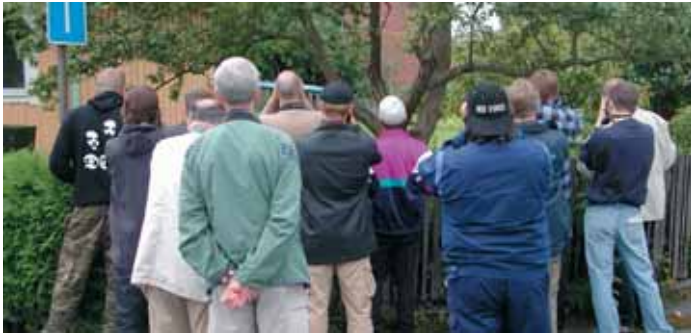
Aldrig har väl så många skådare kliat sig i huvudet samtidigt.