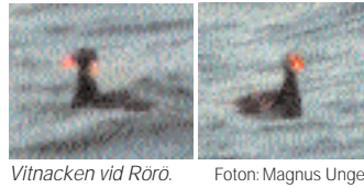
Vitnackan vid Rörö.

Sista budet är att det rör sig om Grey-hooded White-eye, Lophozoterops pinaiae , en art som är endemisk för Seram i Moluckerna.