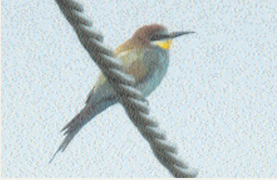
En av sensommarens många biätare, Petgårde träsk 26 augusti.