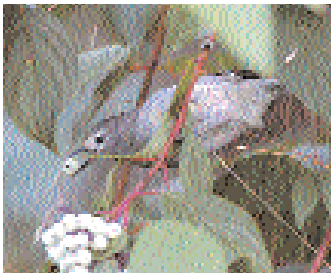
Först var huvudspåret Warbling Vireo. Men det lysande vita partiet runt ögat stämde dåligt med denna nordamerikanska art.