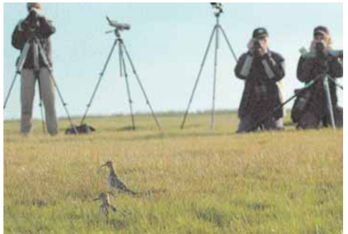
Kom gärna och titta lite närmare på oss. Frågan är vilka som är mest nyfikna – prärielöparna eller skådarna.

vilket innebär att den letat sig in bland Kungarter 2004.