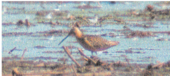
Ny art för Sörmland. Den större beckasinsnäppan stannade i fem dagar.