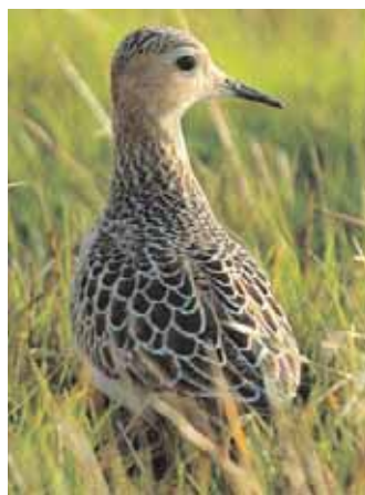
De bägge prärielöparna var totalt orädda till glädje för fotograferna.

Det är faktiskt tredje gången som två juvenila prärielöpare uppenbarar sig samtidigt och alla tre gångerna har det varit på Öland. Första gången var 28 och 29 september 1996 vid Eckels udde och andra gången 10 till 14 september vid Ottenby 1999. Tidigare finns 46 fynd av 48 fåglar av denna amerikanska raritet.