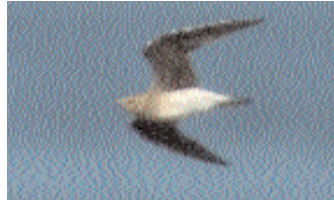
För det mesta stod fågeln på stranden och tjurade, men då och då gjorde den korta flyguppvisningar.