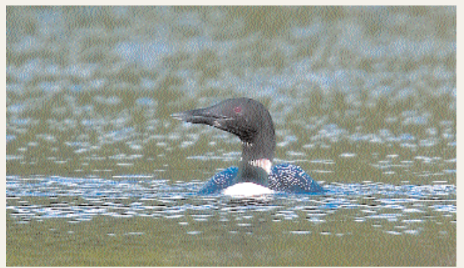
Den svartnäbbade islommen hittade ett bra fiskevatten i Båven.