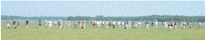
Larmet om vadarsvalan kom på en söndagmorgon, vilket innebar att många kunde skaka sig loss för en tur till Norduppland.