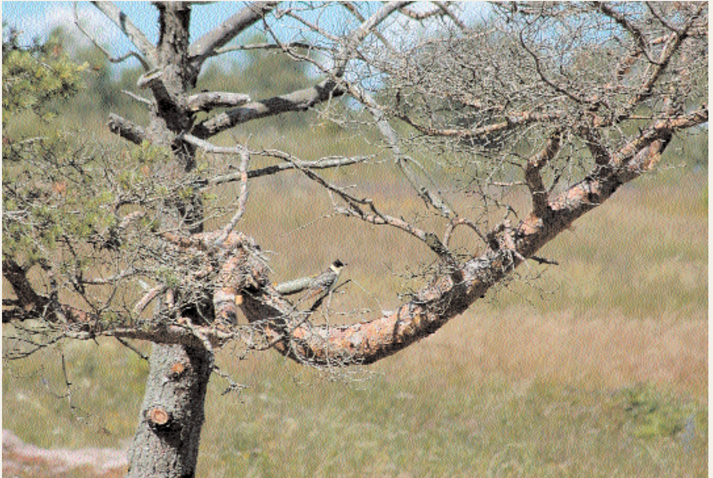
Dragbar under en mycket kort tid. Bara de snabbaste hann fram. Definitivt en av årets läckraste raritetsbilder