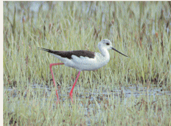
Stiltpöpare, Uppsala den 27 april.

Vassångare är långtifrån en vanlig ringmärkningsart – speciellt inte på Ottenby. Men den 22 april kunde stationspersonalen plocka ett ex ur näten. Nu var det också många som