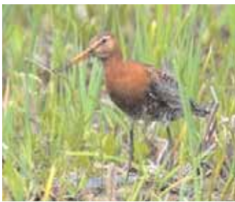
Isländsk rödspov, Angarn.

Kommentar: Det finns tidigare blott fyra godkända fynd av mindre bergand i Sverige även om observationerna varit något fler. I ett par fall har det varit uppenbart att det rört sig om samma individ som flyttat på sig, t ex i Ostergötland. Idag är det drygt 60 procent av klubbens medlemmar som har arten på sina listor.