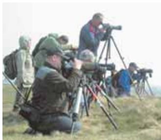
Många var snabbt på plats för att hänga in gulbena.

Två hybrider blåvingad ärta/skedand upptäcktes under perioden – en vid Skåraviken, Nyköping, och en vid Durrudden, Piteå.