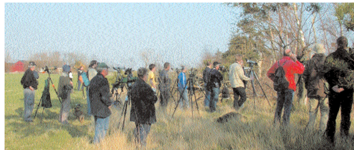
På eftermiddagen samma dag som den iberiska gransångaren upptäcktes och ringmärktes i Skanör samlades skådare för att hänga in detta andrafynd. Men fågeln var borta. Det dröjde dock bara några dagar innan den till allas glädje återupptäcktes.