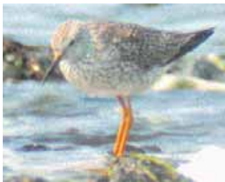
Mindre gulbena vid Stavstensudden