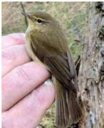
Den iberiska vid Knösen.

Den svarthuvad sparven var kvar även dagen efter men var då svårsedd.