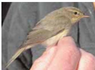
Den nästan iberiska vid Lönestig.

Fågeln släpptes vid 15-tiden och fågeln sågs därefter kort i fält av några