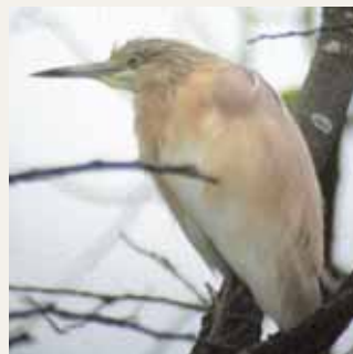
Rallhägern var dragbar i minst fem dagar.

– Hon var lite tveksam när jag frågade om hon tyckte det var okej att larma ut fågeln. I stort sett tycker hon att vi har skött oss bra. Hon ville