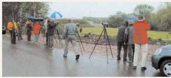
Ivrigt spannande in i Anki Cronbergs damm.

att vi skulle hålla oss på vägen, men vid några tillfällen har det brutits mot den regeln. Rallhägern var kvar i alla fall till den 16 maj och hade då varit dragbar i fem dagar. Det var det 14:e fyndet i landet och det andra i Skåne.