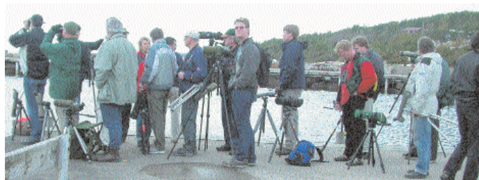
De snabbaste skåningarna är på plats efter bara ett par timmar. Här väntar de på småbåtar som ska ta ut dem till Balgö.