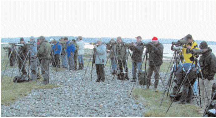
Jublet visste inga gränser när det visade sig att gladan var kvar i gryningen även dag två.