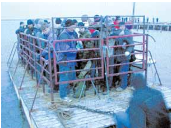
Färskallar som färskallar. Båtägarna tog till boskapsprämen – som normalt används för att frakta Balgöns mufflonfår – i bruk för att det skulle gå fortare att landsätta alla skådare.

Dagen efter – den 28 april – var gladan fortfarande kvar och hann kryssas av ytterligare ett antal skådare som inte hunnit komma loss tidigare. Den svartvingade gladan sågs vid 10.30-tiden slå mot en fågel och landa på marken, skymd bland enbuskarna. Därefter sågs den aldrig mer,