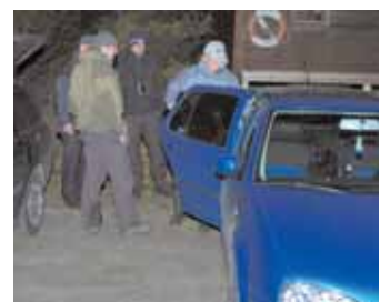
Spänd, nattlig väntan på första båten. Skulle gladan vara kvar?

Kommentar: Svartvingad glada är mycket ovanlig utanför sitt utbredningsområde. Tidigare finns bara ett enda fynd från Nor-