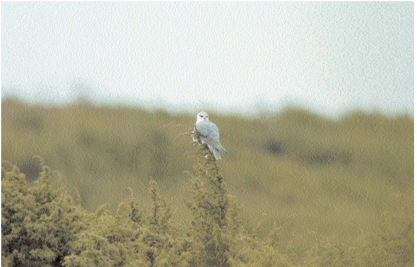
Den svartvingade gladan blev en oförglömlig upplevelse för alla som mitt i arbetsveckan lyckades slita sig loss.