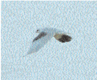
För det mesta satt gladan i en enbusktopt och surade, men då och då gjorde den en uppvisning i luften till skådarnas förtjusning.