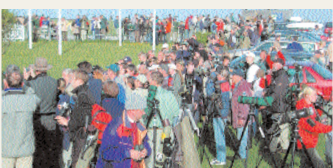
Närmare 600 skådare var på plats när gråsångaren visades upp. Nytt publikrekord för Ottenby. Här har det börjat tunnas ut, men några minuter innan bilden togs stod folk i fyrdubbla led runt hela stationsstaketet.