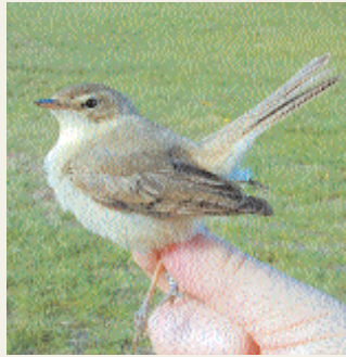
Gråsångare av rasen caligata .

Både utseende och mått pekar entydigt på att det var en gråsångare av rasen caligata . Efter släppandet kunde fågeln ses hela dagen i