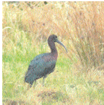
Bronsibisen i Halmstad.

Kommentar: Det finns tidigare 12 godkända fynd av större beckasinsnäppa i Sverige. Det senaste gjordes vid Foteviken i Skåne 1998.