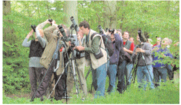
Ett gäng skådare lyssnar på den intensivt sjungande trädgårdsträdskryparen när den sitter vid Falsterbo fågelstation.