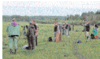
Dvärgsumplyssning vid Angarn.

Kommentar: Det finns tidigare 15 fynd av rödvingad vadarsvala i Sverige.