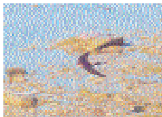
Rostgumpsvala i Klintehamn den 25 april.

Månadsskiftet april-maj karaktäriserades av ett influx av rostgumpsvalor. Obsar rapporterades från Skåne, Blekinge, Öland och Gotland. Flera av dem var stationära vilket ju normalt inte kännetecknar arten. Mot mitten av maj dök det upp ännu fler exemplar, bl a vid Ottenby (två individer samtidigt) och i Östergötland. I juni dök det upp två ex i Värmland och en ringmärktes vid Ottenby.