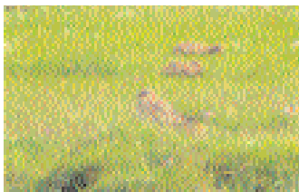
Den rödvingade – en dålig bild är bättre än ingen alls är vårt motto.

Rödvingad vadarsvala har varit svårkrädd under senare år. De senaste dragbara var en fågel som uppehöll sig två dagar vid Stockviken på