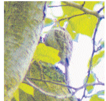
Notera de jämna "trappstegen" på vingen.