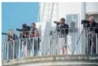
Långe Jan – bästa platsen för obsar av amerikansk tundrapipare.

Den 17 juli hittades en amerikansk tundrapipare vid Ottenby. Det var en gammal fågel i grann sommarträkt som stannade i nästan två veckor. För det mesta uppehöll den sig ute vid Sandvik och de bästa obsarna fick man faktiskt om man stod uppe på Långe Jan.