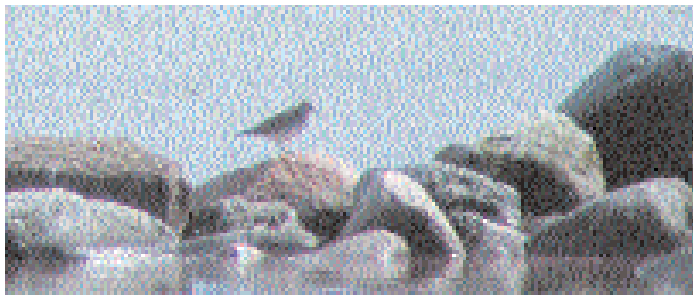
Bara ett par veckor efter hudsonspovens sorti var det dags för ännu en ny vadarart – sibirisk gråsnäppa.

Hudsonspoven blev början på en raritetsperiod som saknar motstycke i öländsk fågelhistoria. Mega-arterna avlöste varandra. Det kom nästan bara Ölands-larm under en dryg månads tid. Till slut gjorde Mikael Nord inläsningen: "Ni kanske tror att ni har kommit till Ölandssvararen, men det här är faktiskt Club 300s RIX-svarare".