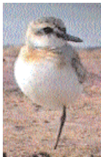
Ökenpipare nr 1.