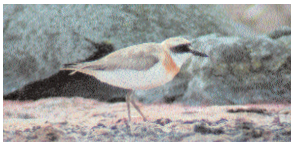
Ökenpipare nr 2.

son , Göteborg, fick ökenpiparen som 400:e art.