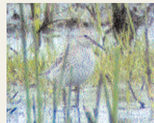
Vitgump nr 2 vid Beijershamn.

Den 18 juli hittade Staffan Rodebrand en spännande calidris -vadare