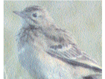
Lägg märke till att fågeln har bytt nästan samtliga mellersta täckare. Notera också den karaktäristiska trubbiga formen på kärnan.