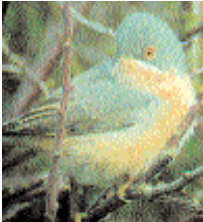
Genom köksfönstret.

Rödstrupig sångare – blytung på septemberlistan. Den 26 september upptäckte Geta "Gula Gubben" Lööf