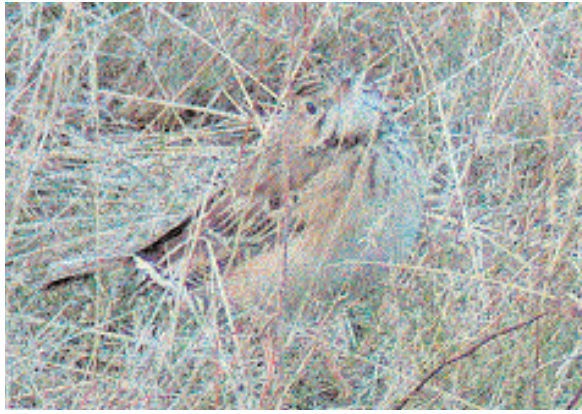
Mongolpip-lärkan på Nabben blev en långstannare och gjorde att det är den hittills i år mest kryssade arten

Fotnot. Det finns tidigare tolv godkända fynd av dvärgrördrom i Sverige. De flesta är av äldre datum. Det senaste gjordes 1990 på Gotland.