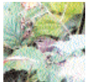
Tittut i björnbärssnäret.