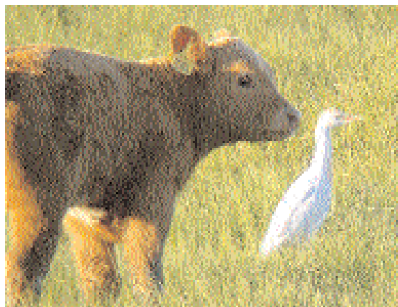
Kohägern vid Lövsund den 14 maj gäckade de flesta. Få skådare hann fram.