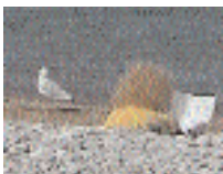
Som synes orädd

Kommentar: Det finns tidigare nio godkända fynd av ringnäbbad mås i Sverige.