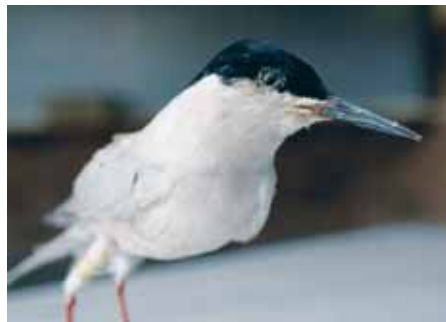
Trots över 50 år på nacken är rosentärnan i gott skick.